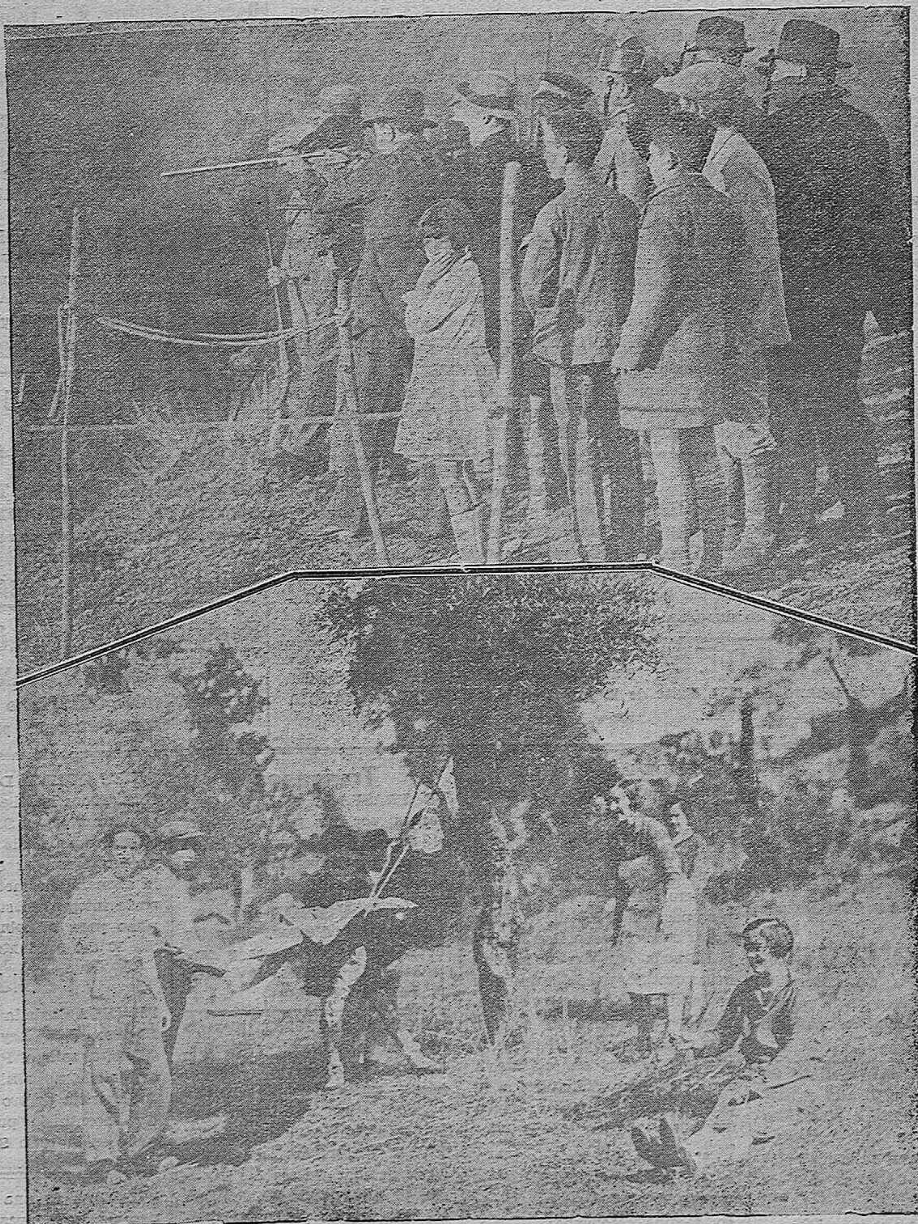
LA FIESTA CAMPESTRE DE AYER.—Arriba: En la aldea de Trasserra, El tiro al gallo.—Abajo: En rearoches, unos "perolistas" se distraen en el "deporte" del columpio.