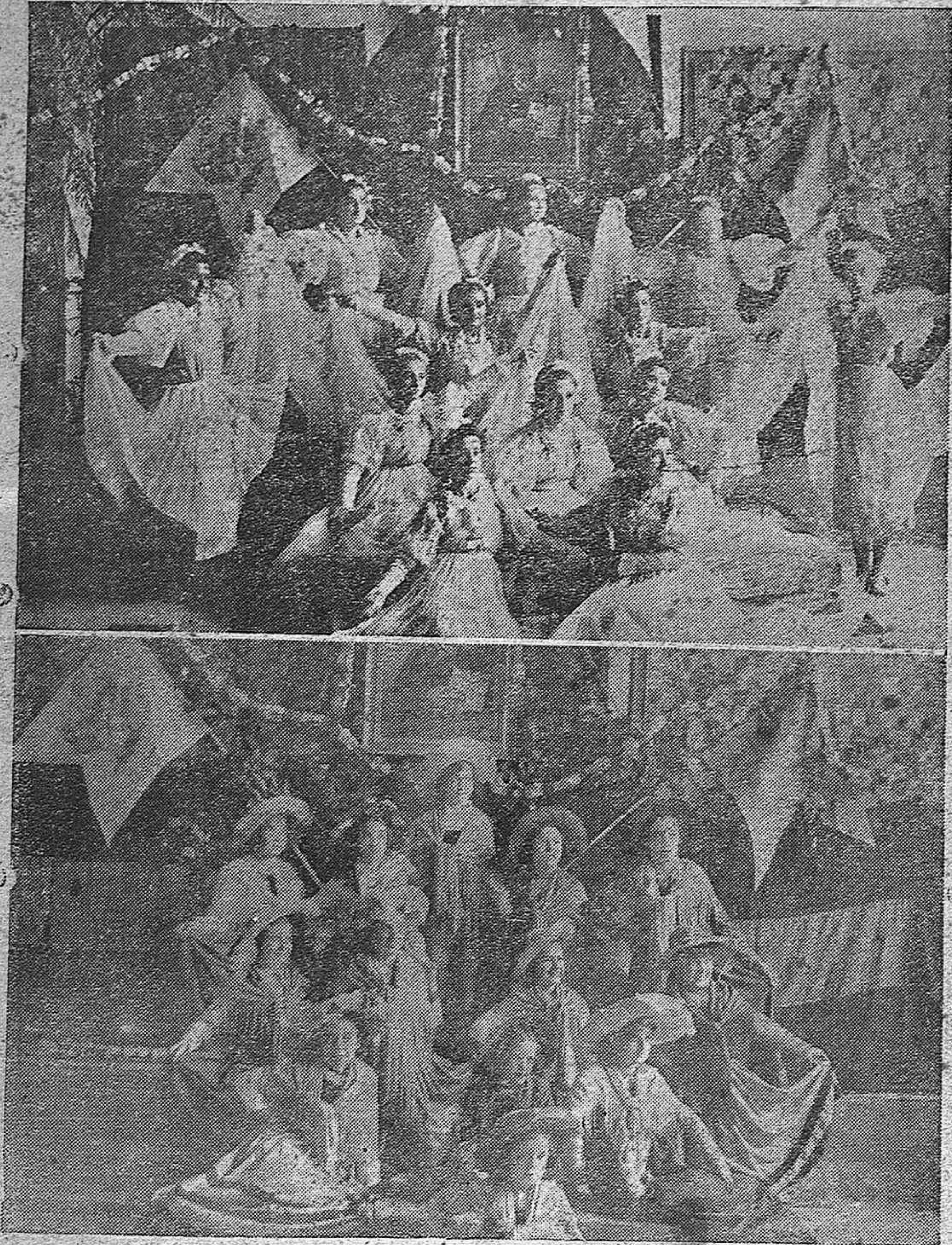
Fiesta celebrada en el Colegio de San Rafael que funciona costeadado por S. E. Ilma. el Obispo de Córdoba. El festival fué organizado en honor de San José de Calasanz.