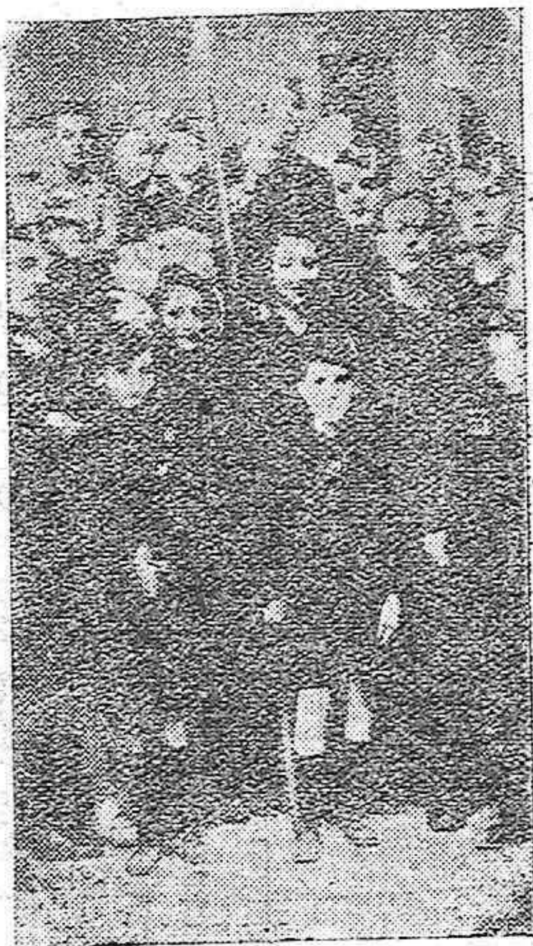
Momento de ser entregada la bandera por la madrina a los flechas de Porcuna.