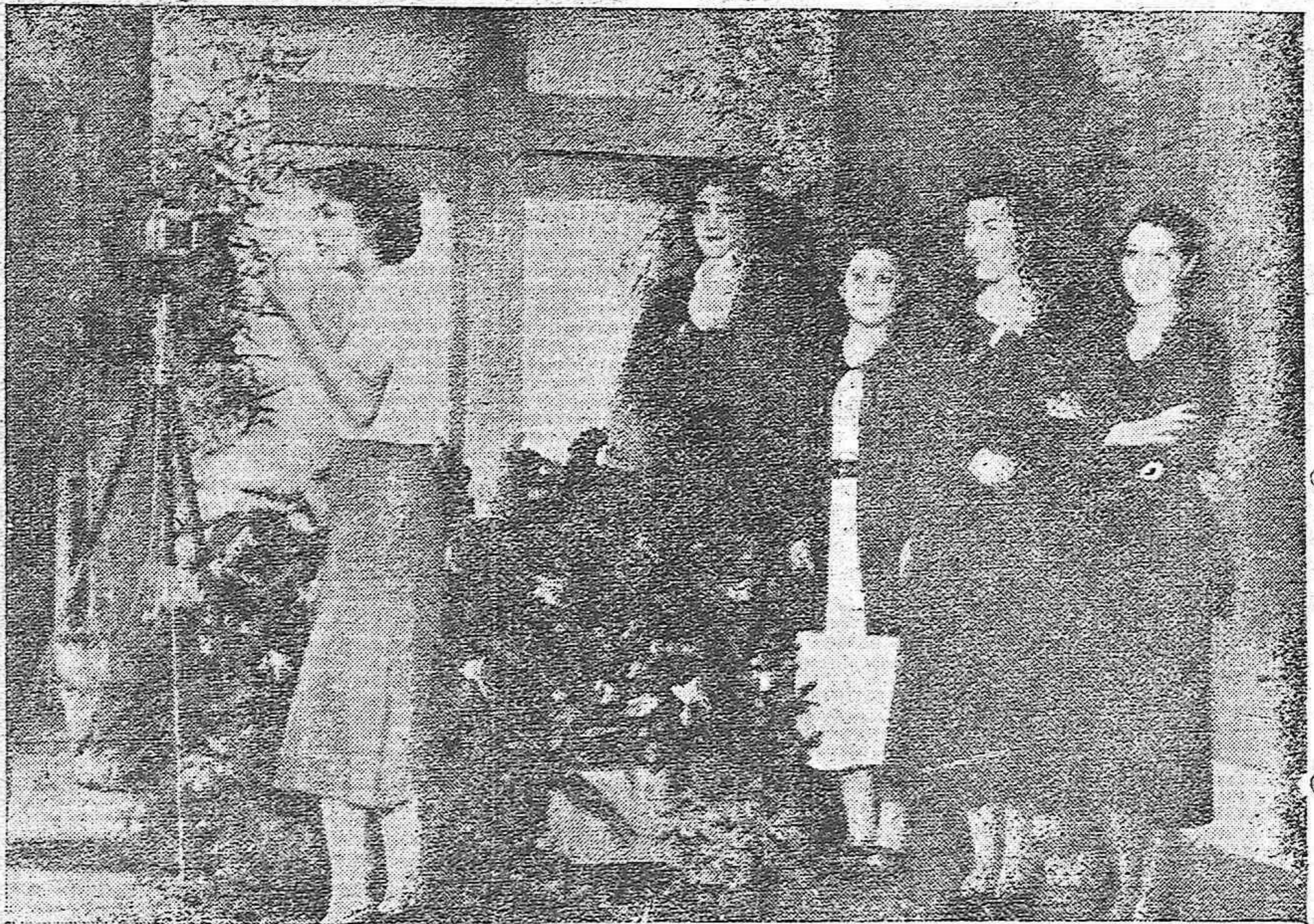
El Concurso de Sacas celebrado anoche en la Emisora Cordobesa.-Una de las concursantes cantando ante el micrófono.