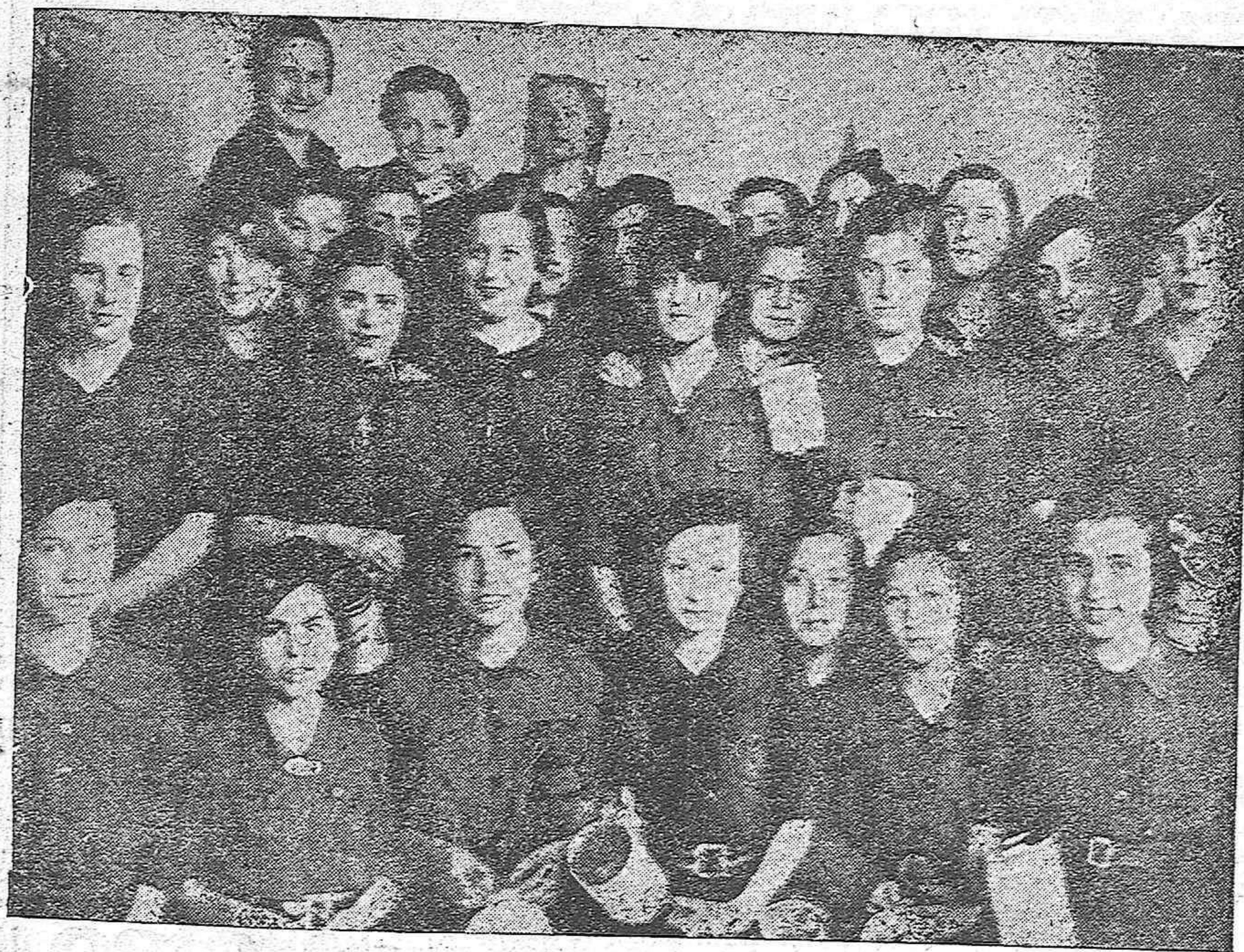
Un grupo de la Sección Femenina de Falange que hoy ha hecho una colecta a favor del "Auxilio de Invierno"