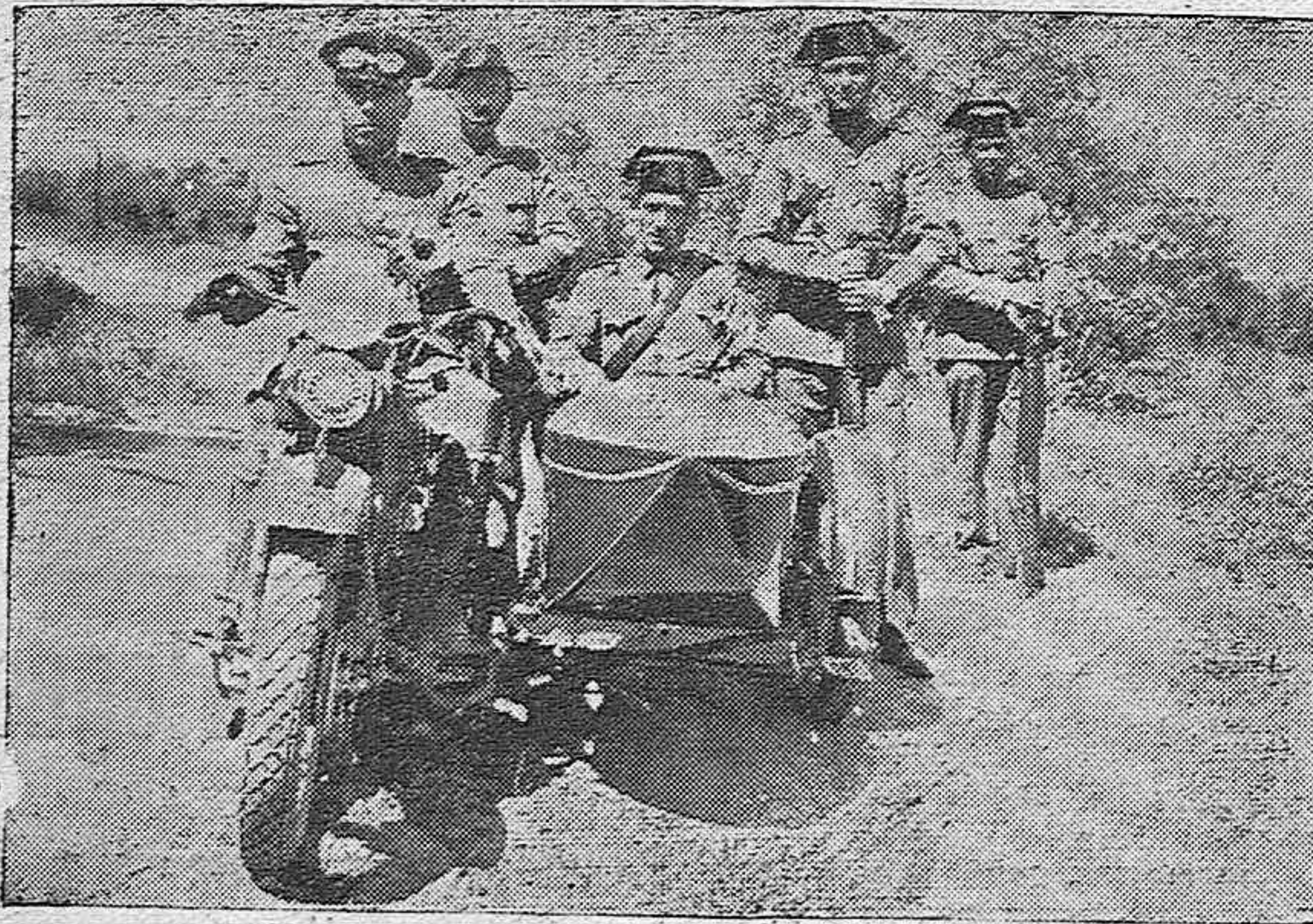
LA ESTANCIA DEL PRESIDENTE DE LA REPUBLICA EN "LA GINESA". Fuerzas de la Benemérita vigilando la finca, en la que S. E. el señor Alcalá Zamora ha pasado unos días