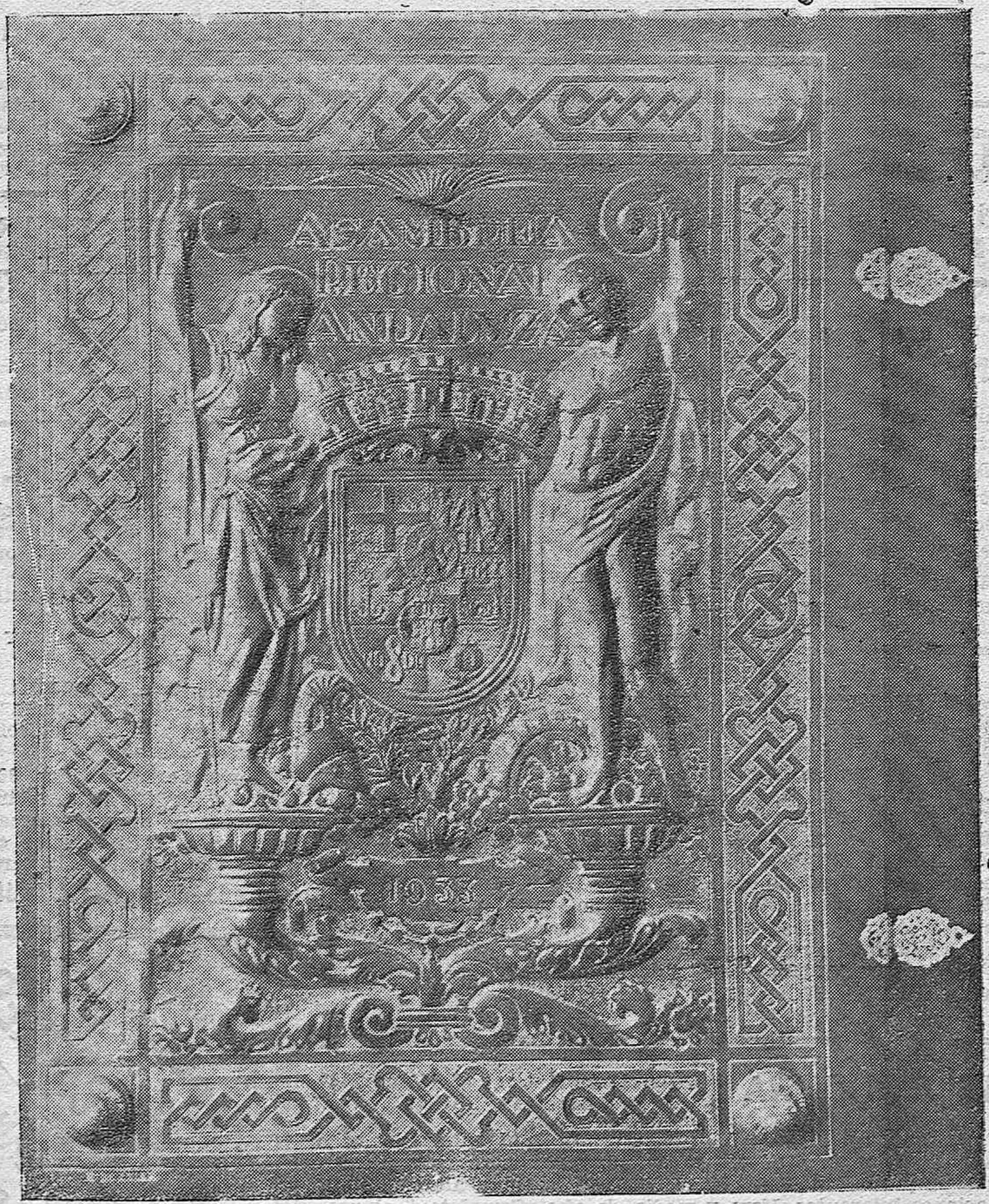
LA ACTUALIDAD EN CORDOBA.—Artístico album que las Diputaciones andaluzas ofrecen al Círculo de la Amistad en testimonio de gratitud por haber cedido sus locales para la celebración de la Asamblea pro Estatuto Andaluz.—El album es obra del notable artista don Rafael Bernier