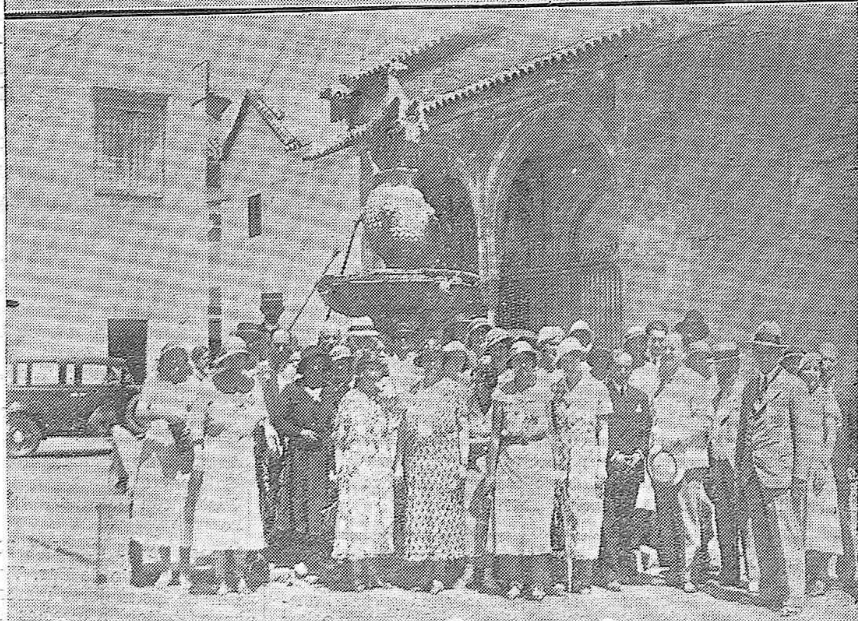
NOTAS GRAFICAS DE ACTUALIDAD.—Los profesores franceses, nuestros huéspedes de unas horas, durante la visita que hicieron a la Mezquita y Museo Julio Romero de Torres