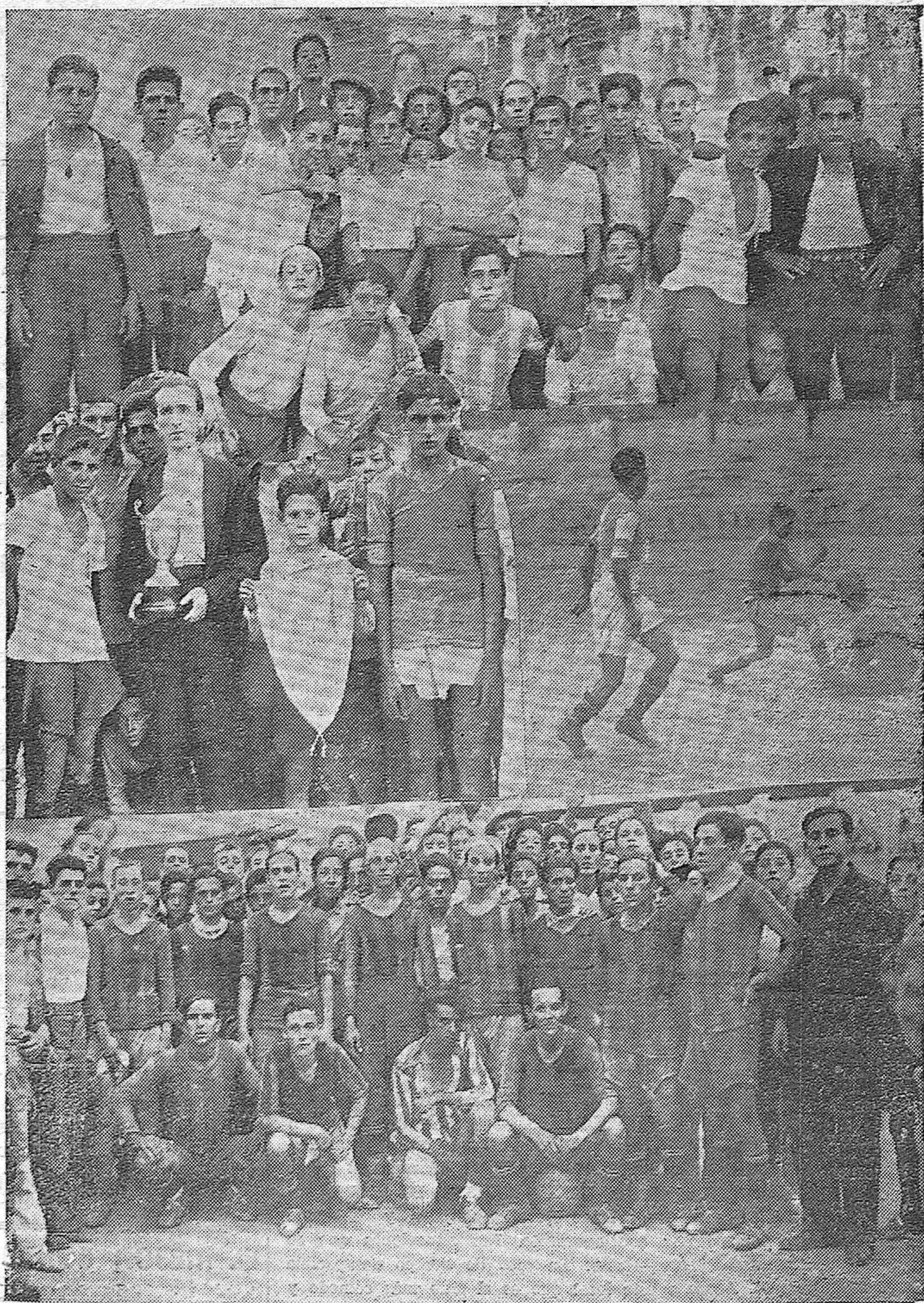
NOTAS GRAFICAS DE DEPORTES. —Varios motivos sobre el campeonato entre equipos no federados que se ha jugado en Córdoba con sin igual éxito