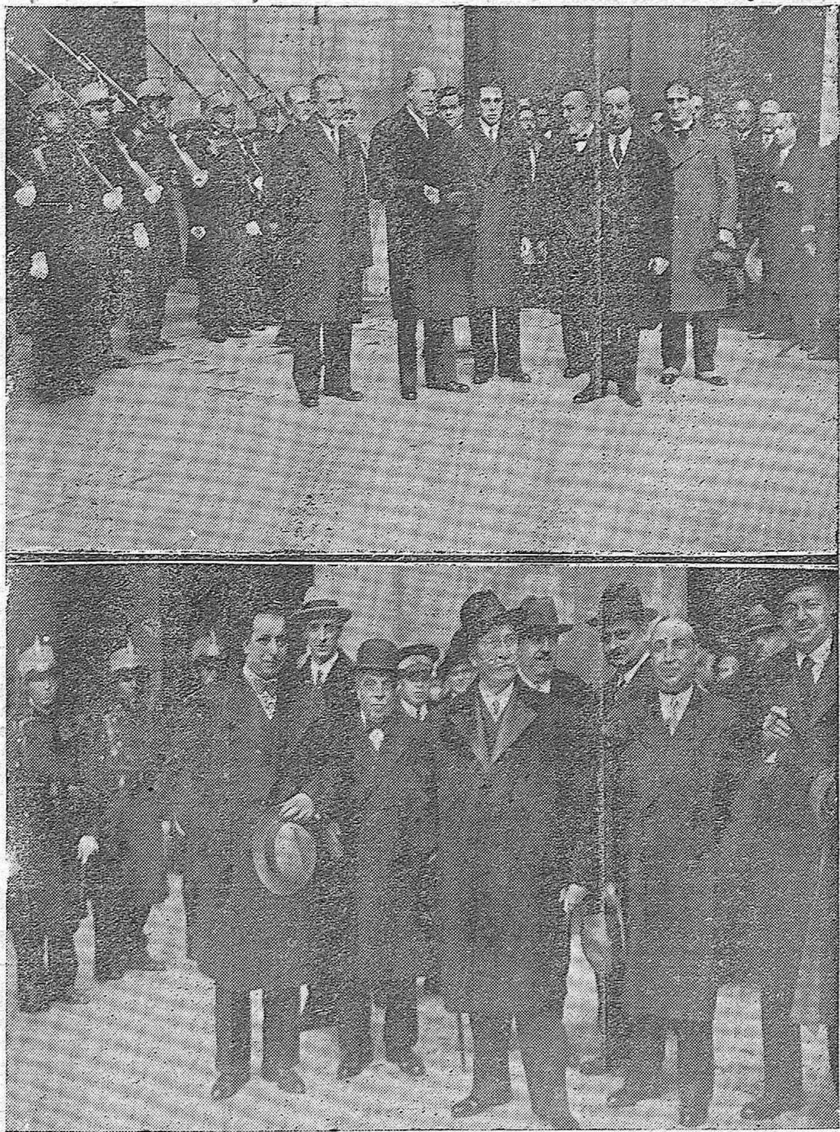
ACTUALIDAD GRAFICA. —La Mesa del Congreso y diputados de diferentes fracciones que se han unido para felicitar al señor Alcalá Zamora con motivo de cumplirse el primer aniversario de su mandato presidencial.—El jefe del partido radical don Alejandro Lerreux con otros diputados de su minoría, entre los que figura nuestro amigo don Ramón Carreras, que también fueron a felicitar al Presidente de la República