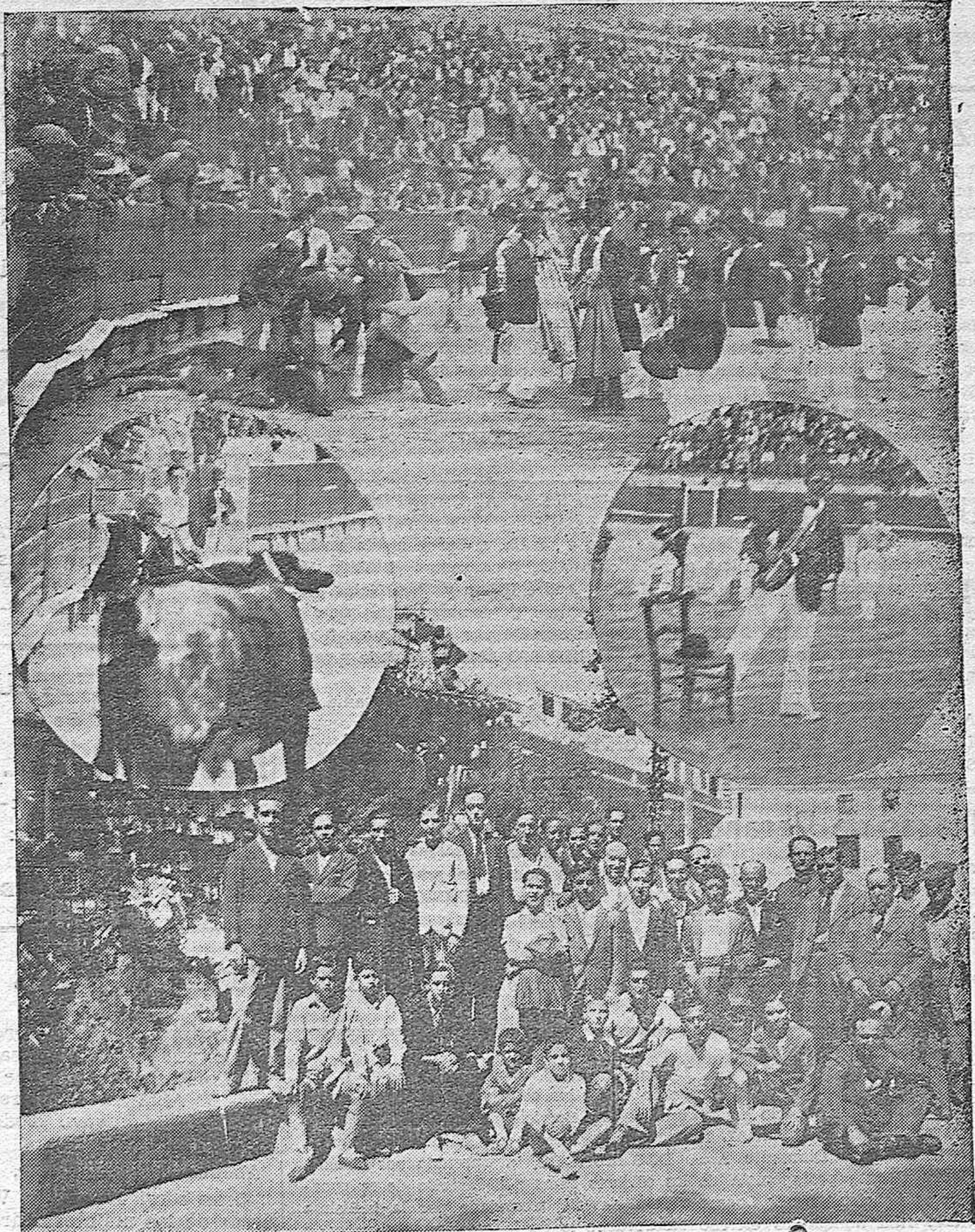
NOTAS GRÁFICAS DE ACTUALIDAD. —Varios momentos del festival celebrado en Priego por la Banda Infante Los Califas.—Los excursionistas cordobeses en la renombrada fuente de la Salud