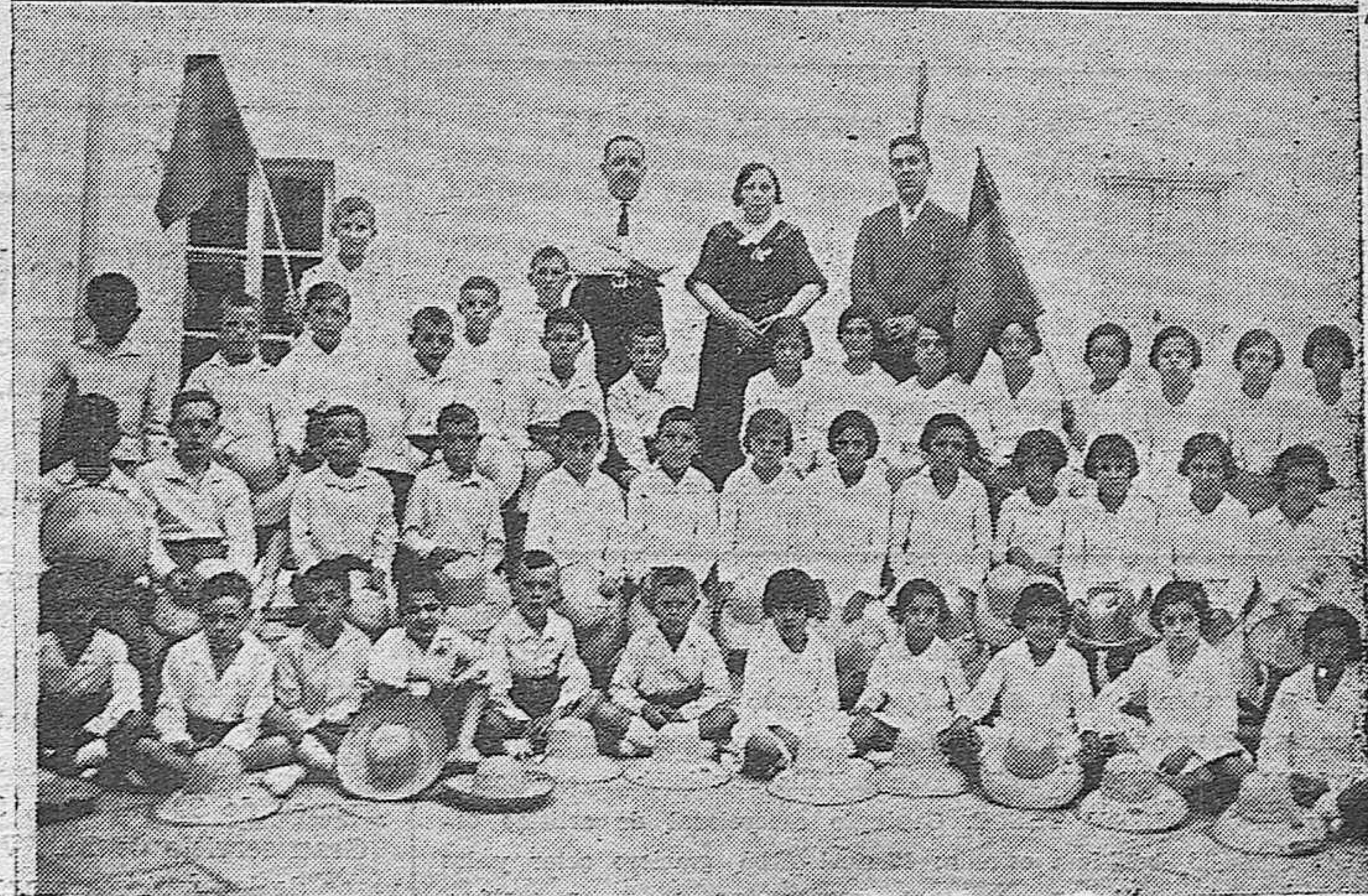
NOTAS GRAFICAS DE ACTUALIDAD. —Excursionistas del Athletic de Palma de Mallorca que llegaron ayer a esta capital.—Niños que forman la colonia escolar de La Rambla que ha marchado a Torremolinos donde permanecerán una temporada