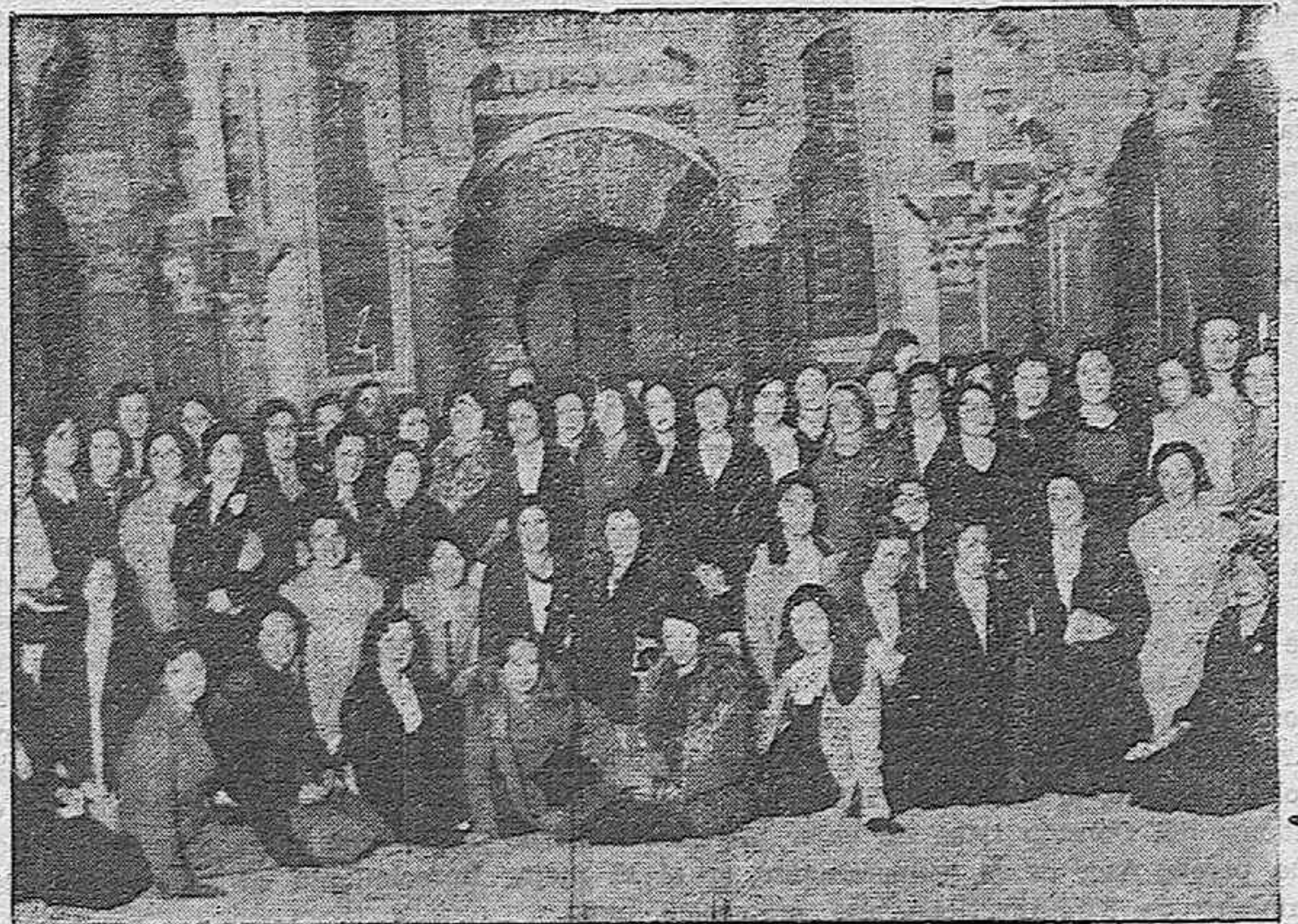
Grupo de jóvenes escolares que en viaje de estudio, estuvieron en la capital.

Córdoba 21 de marzo de 1932.—La Comisión.