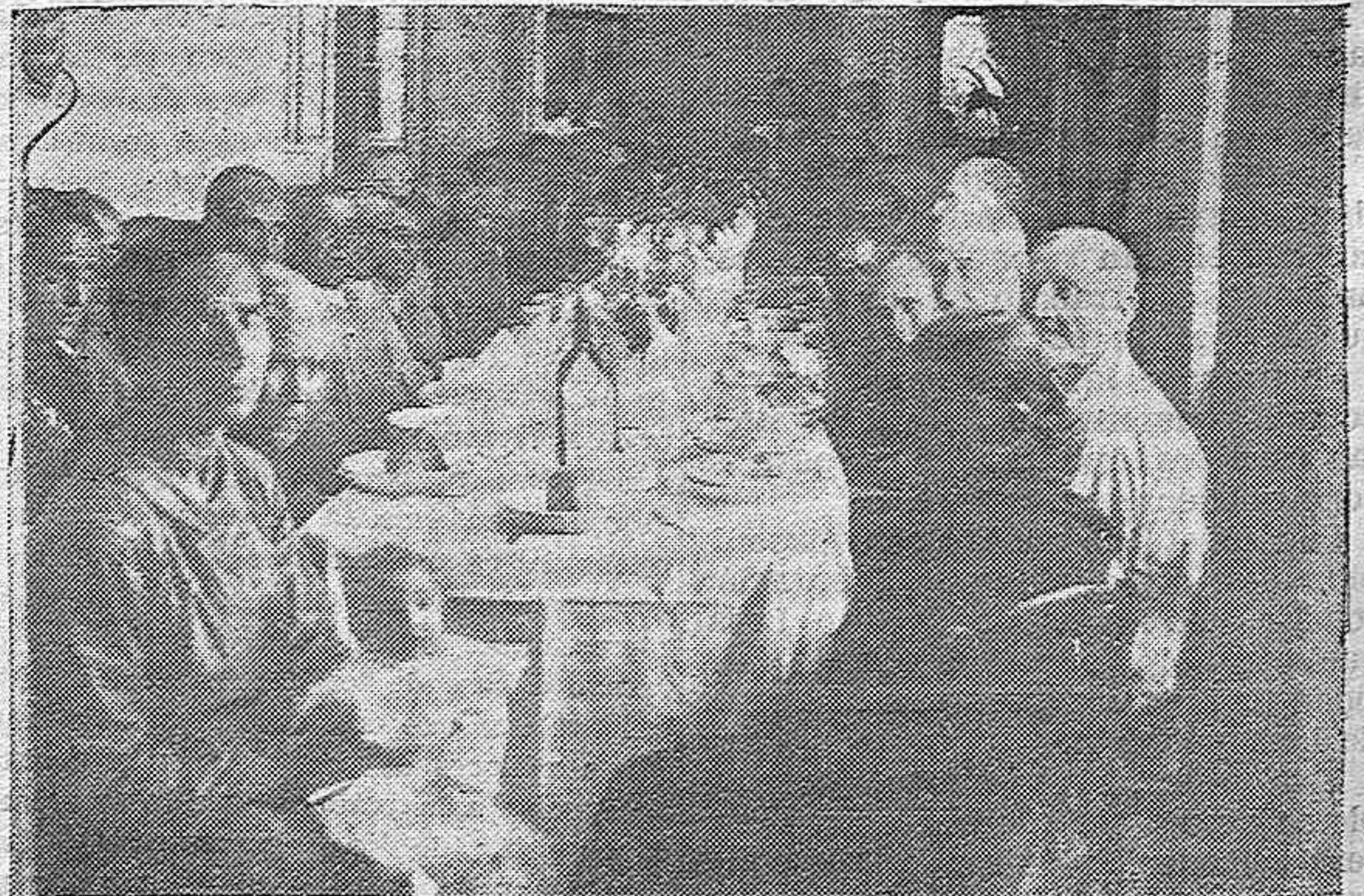
Banquete ofrecido por el Agente del Retiro Obrero a los beneficiarios después del acto celebrado ayer