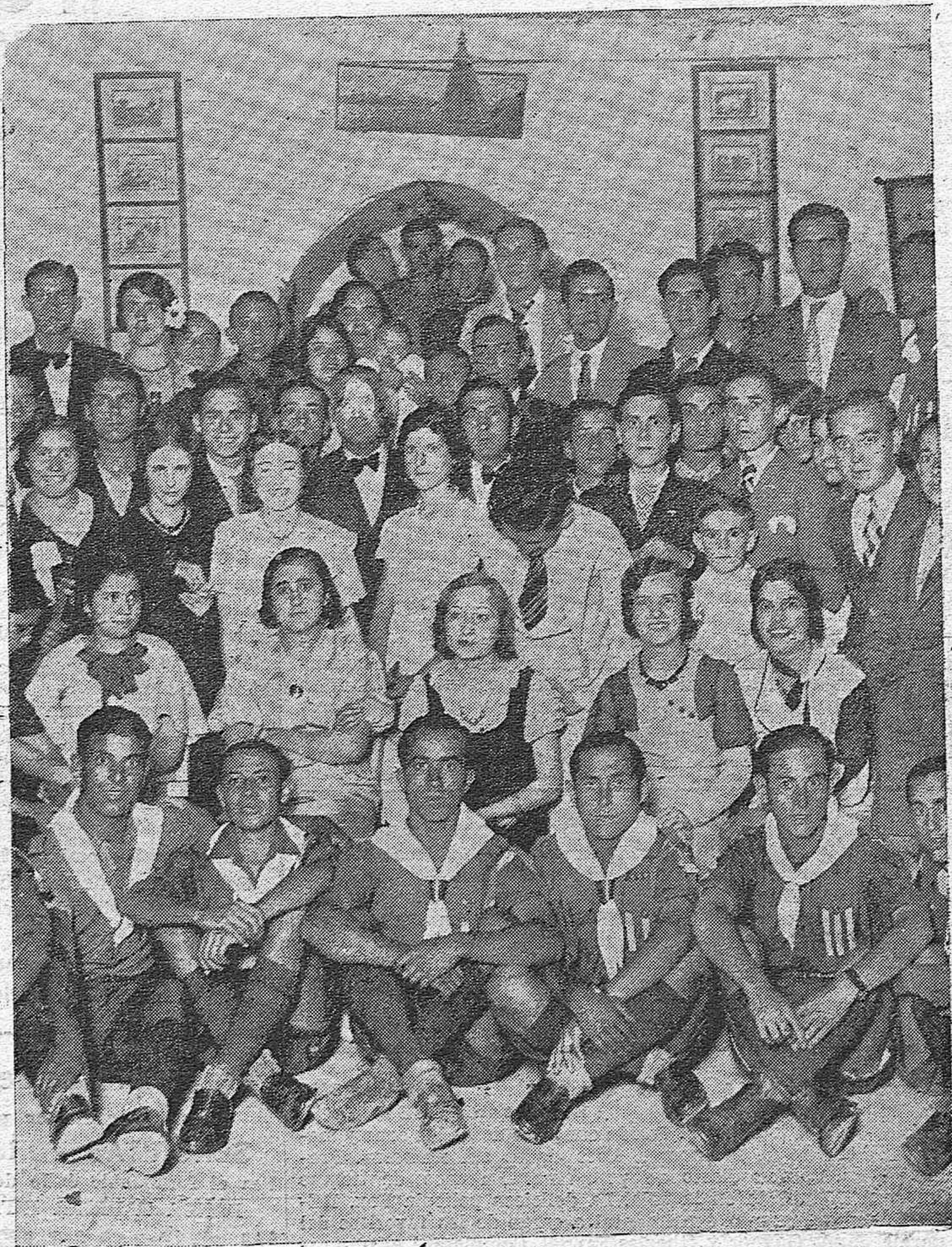
ACTUALIDAD GRAFICA.—Grupo de asistentes a la verbena celebrada en el Club de los exploradores