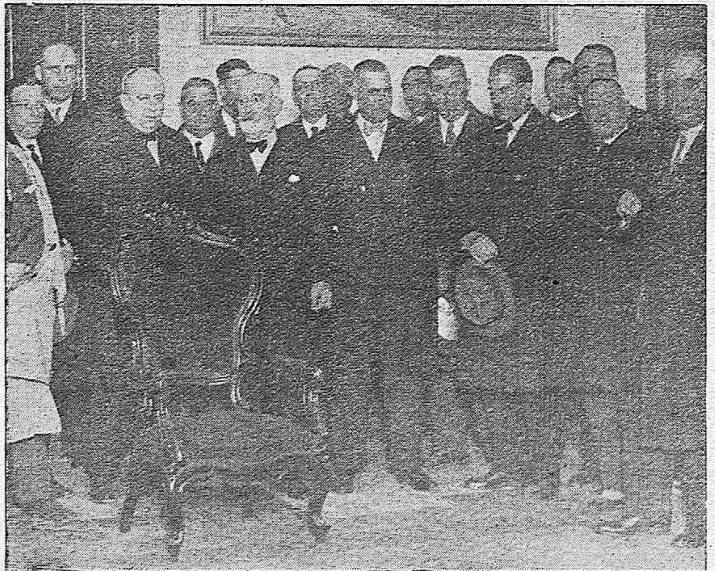
Los representantes de la Ciudad, Centros y demás entidades de Córdoba, que acudieron al despacho del Gobernador civil para rogarle desistiera de sus propósitos dimisionarios y continuara en el mandato de los destinos civiles de la provincia