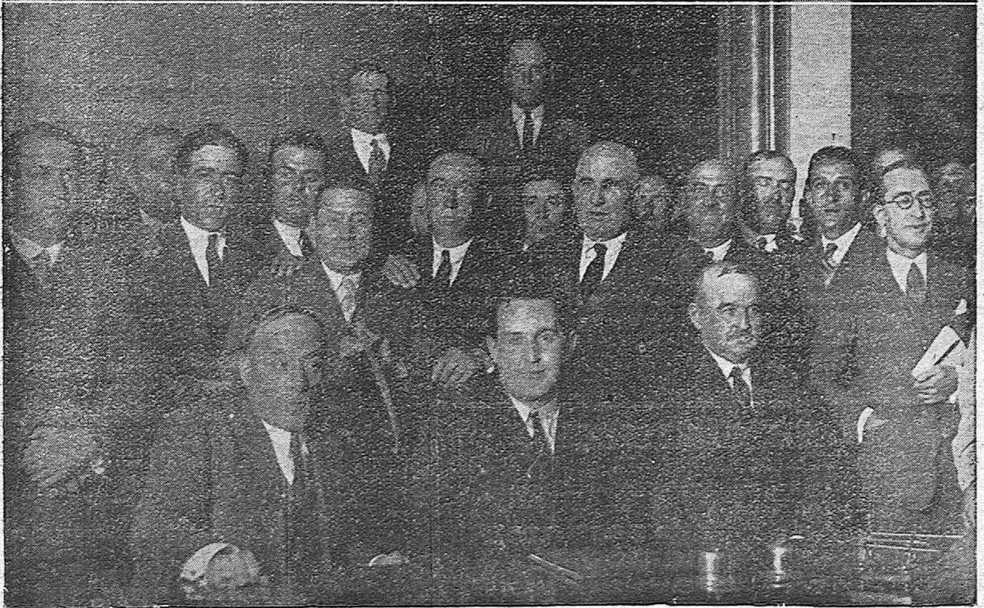
GRANADA.—Los assembleistas agrarios de Córdoba, en su visita a la Alhambra.—Presidencia de la Asamblea de Arrendatarios-Agricultores celebrada con carácter regional en el salón capitular del Ayuntamiento.