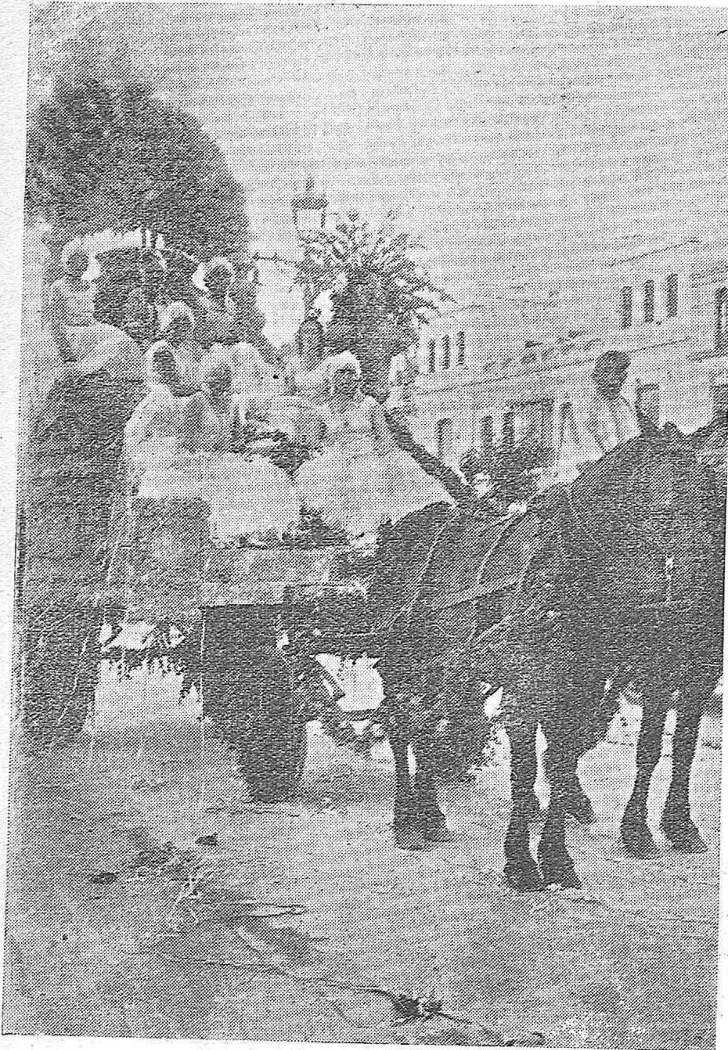
LA BATALLA DE FLORES.—MAGNIFICA CARROZA QUE OBTUVO EL TERCER PREMIO EN EL CONCURSO.

OCASION: lonas para cortinas, desde 125 pesetas metro; cortinas de crudillo con fleco desde 4 pesetas; estores, desde 5 pesetas; cretonas rameadas, desde 1 peseta, en El Metro y sus Sucursales.