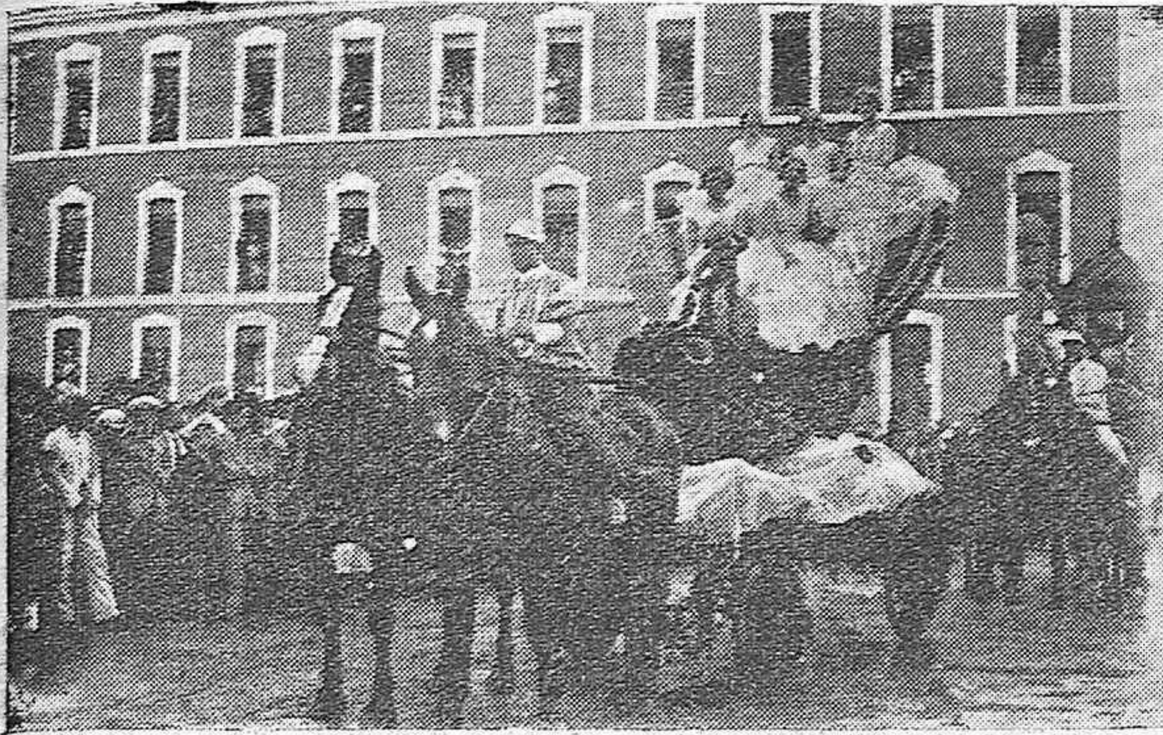
LA BATALLA DE FLORES.- OTRA DE LAS LINDAS CARROZAS PREMIADAS.