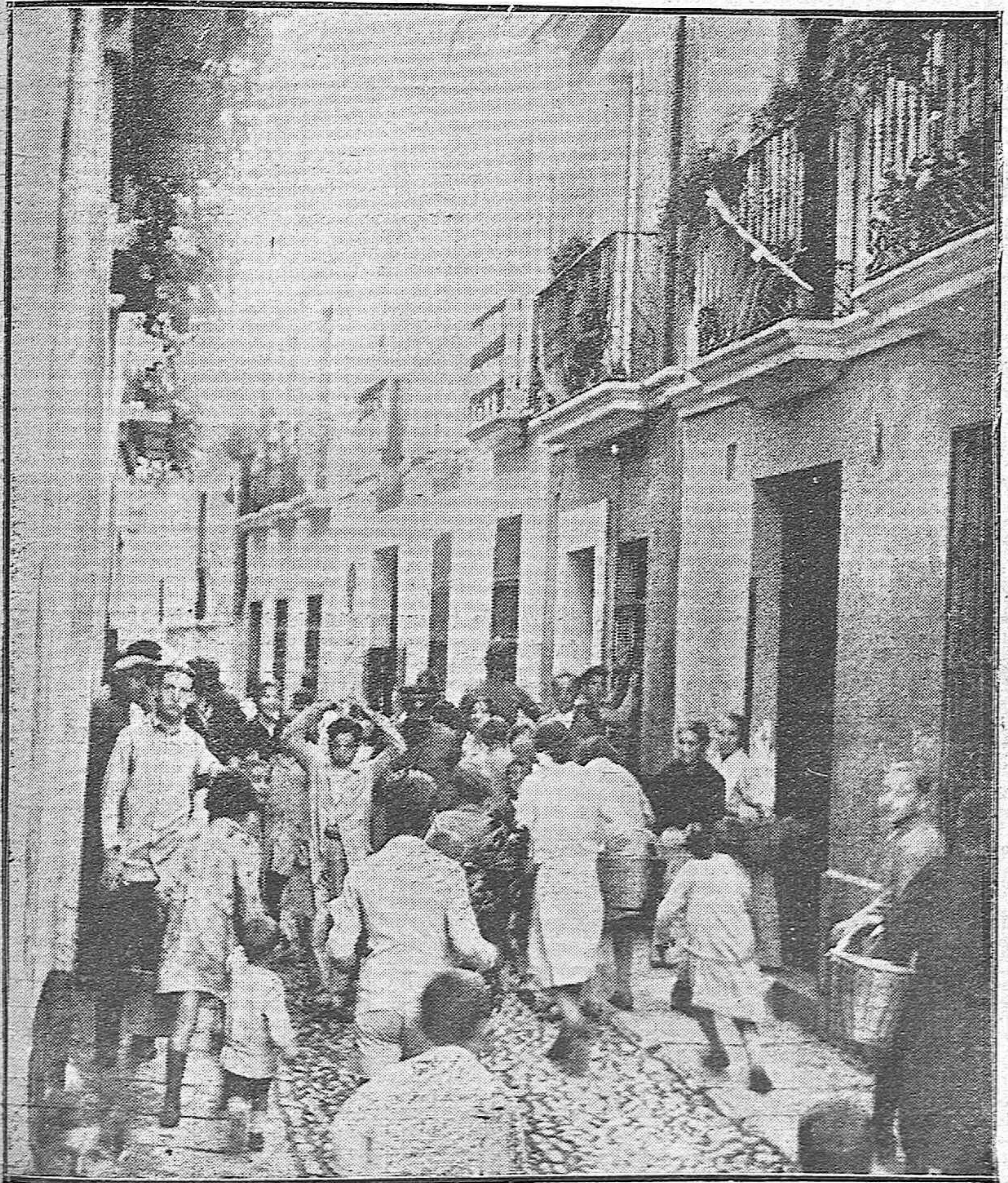
EL SUCESO DE LA CALLE CARLOS RUBIO.—La «CASA DEL FANTASMA», ADONDE UNA MANO INVISIBLE NO DEJA DE ARROJAR PIEDRAS DURANTE TODO EL DIA, MANTENIENDO LA ALARMA DEL BARRIO Y SIN QUE LAS AUTORIDADES LOGREN DESCIFRAR EL MISTERIO.