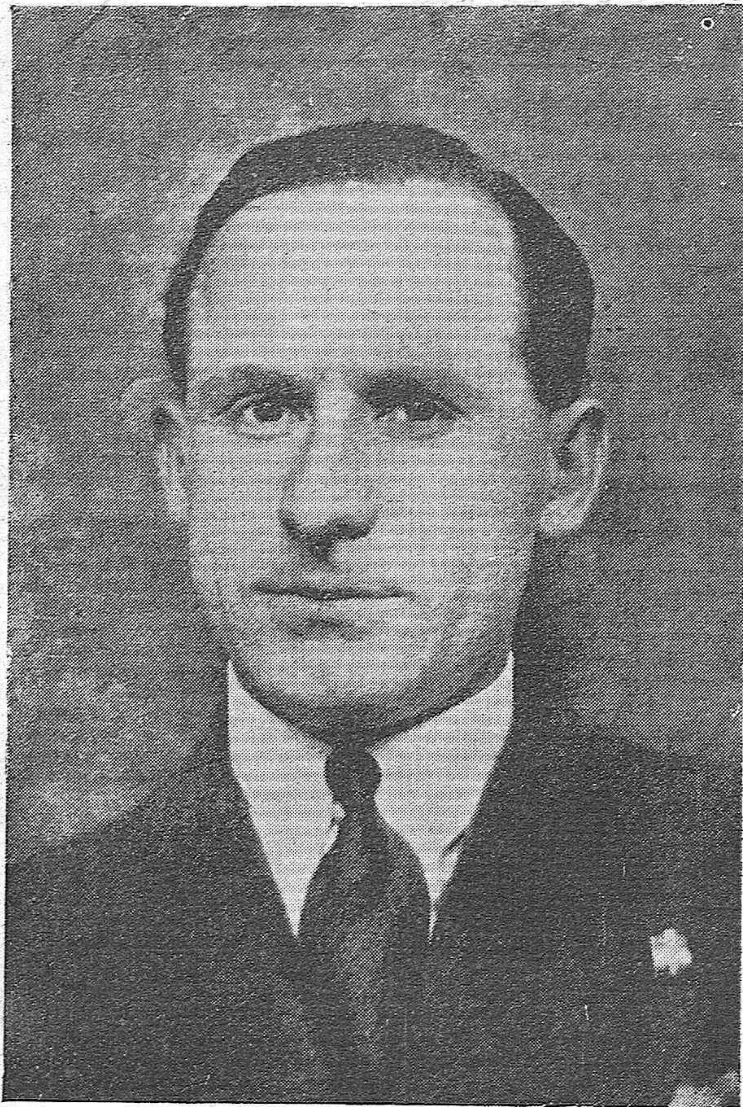
GETAFE.—EL AVIADOR Y AGREGADO NAVAL DE LA EMBAJADA DE ITALIA EN ESPAÑA, FILIPPO MONTI, QUE SE MATÓ AYER MIENTRAS PRACTICABA ARRIESGADAS ACROBACIAS CON EL AVIÓN.

Consultas al agente para Córdoba y su provincia: E. OBREGÓN.-A. Morales, 10, Tel. 1470