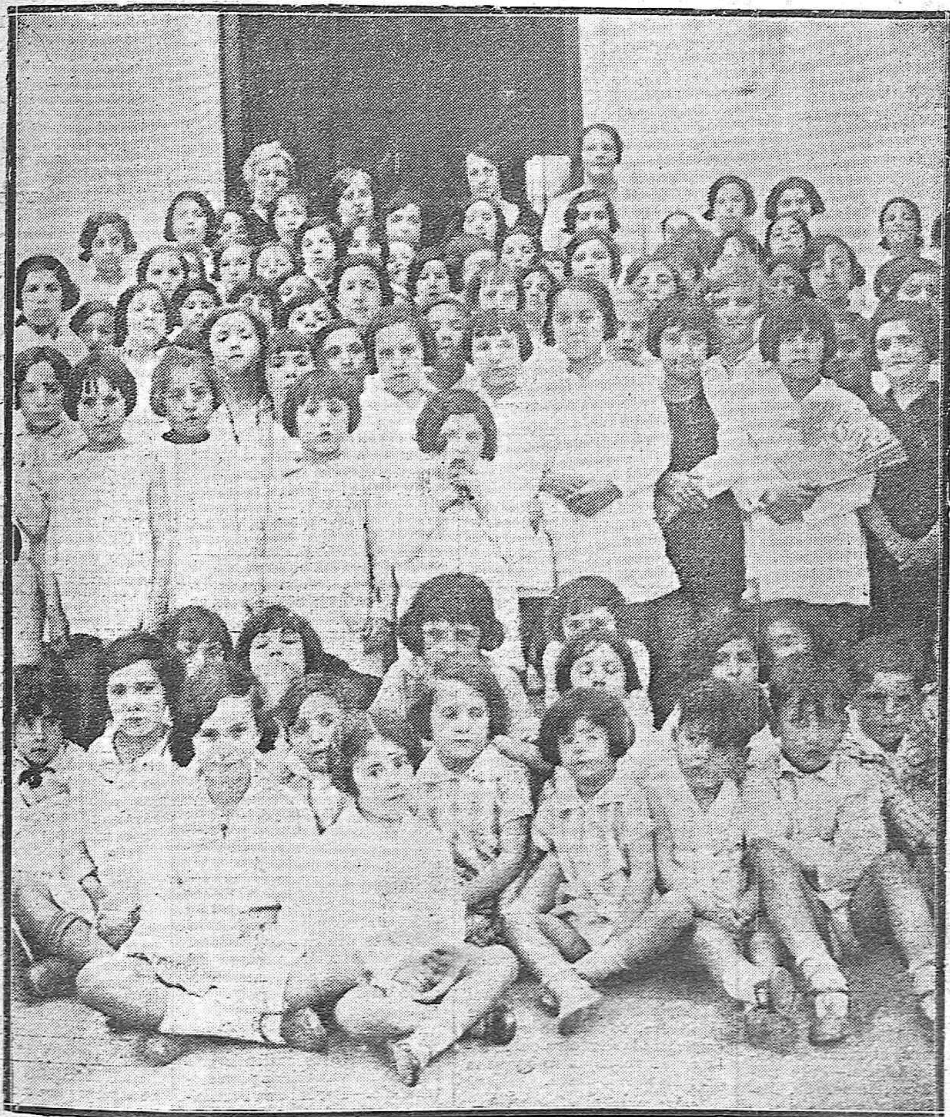
FIESTA ESCOLAR. — NIÑOS QUE INTERVINIERON EN LA FIESTA CELEBRADA AYER TARDE EN EL GRUPO ESCOLAR MARQUÉS DE ESTELLA.