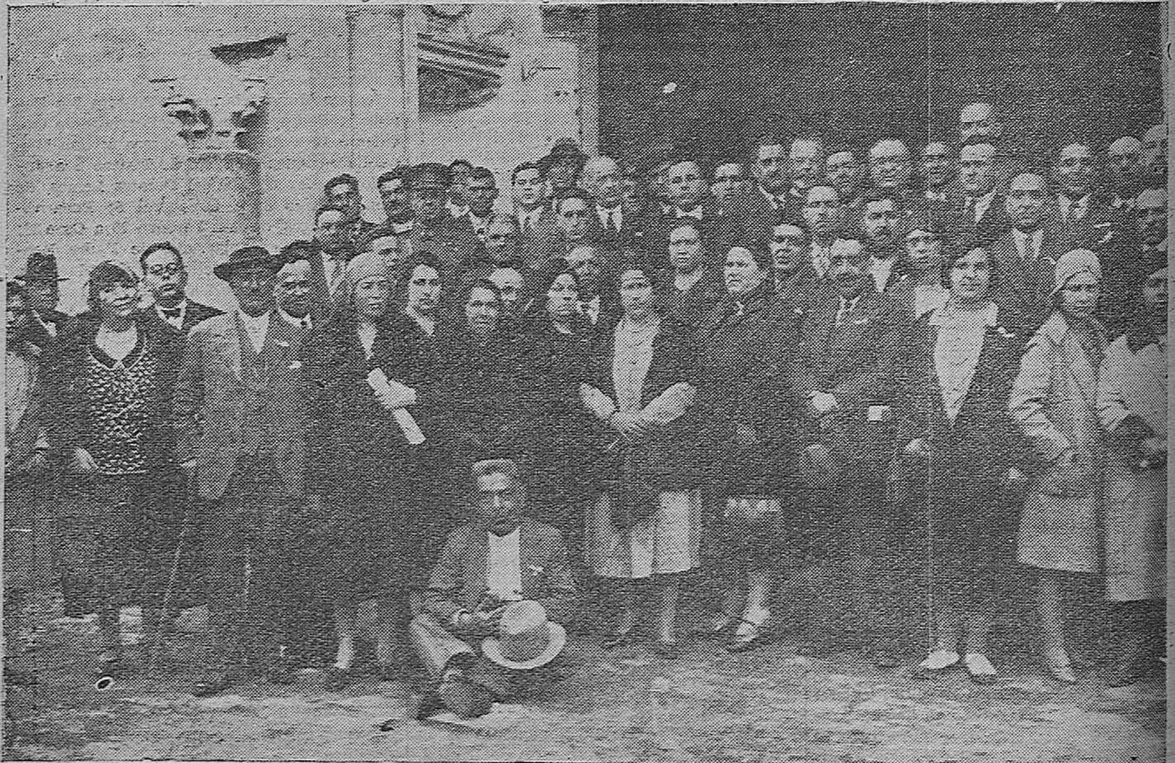
EXCURSIONISTAS GALLEGOS QUE ACABAN DE LLEGAR A CÓRDOBA EN VIAJE DE TURISMO.