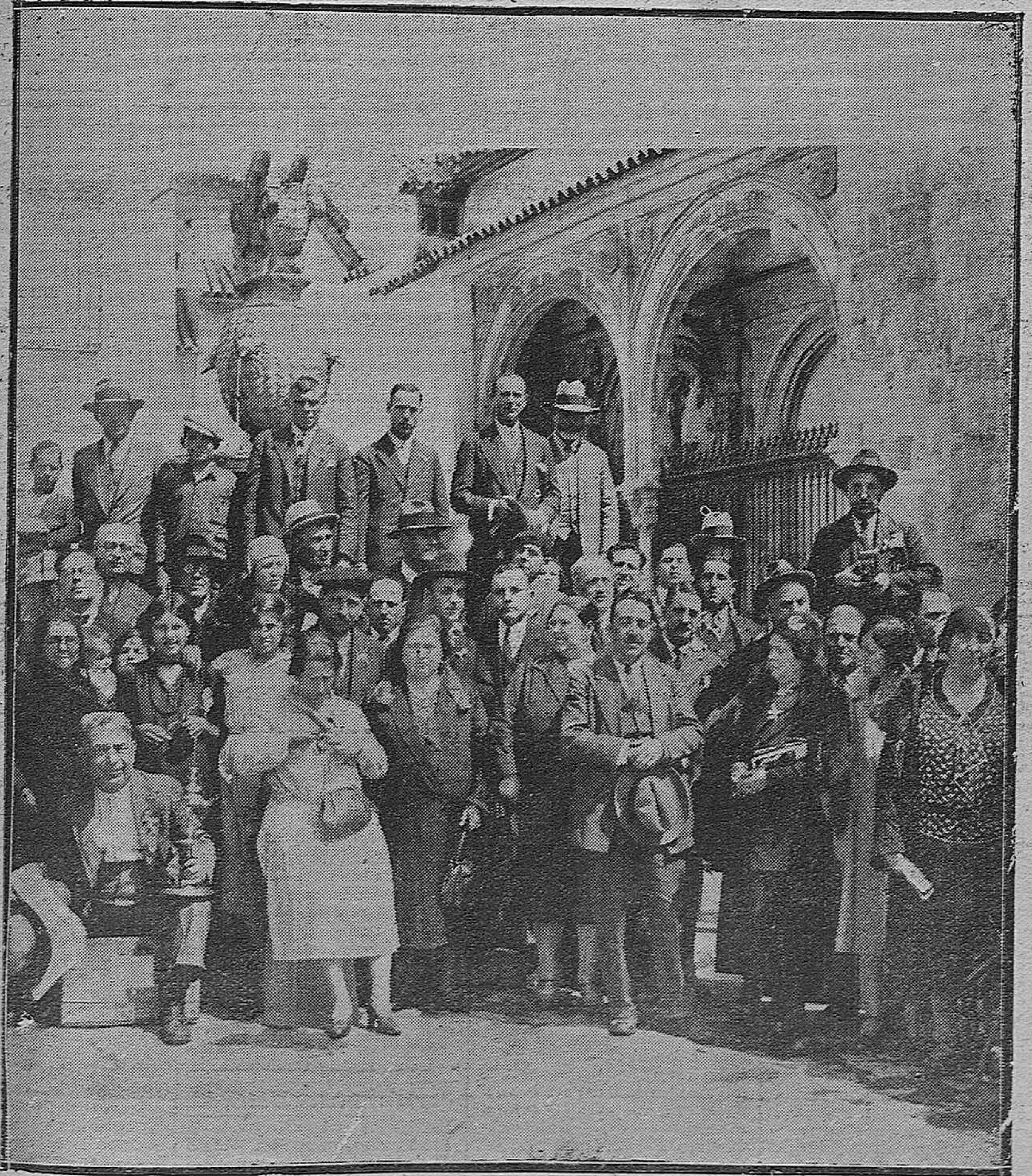
MIEMBROS DE LA UNIVERSIDAD POPULAR QUE SE ENCUENTRAN EN CÓRDOBA EN VIAJE CULTURAL.