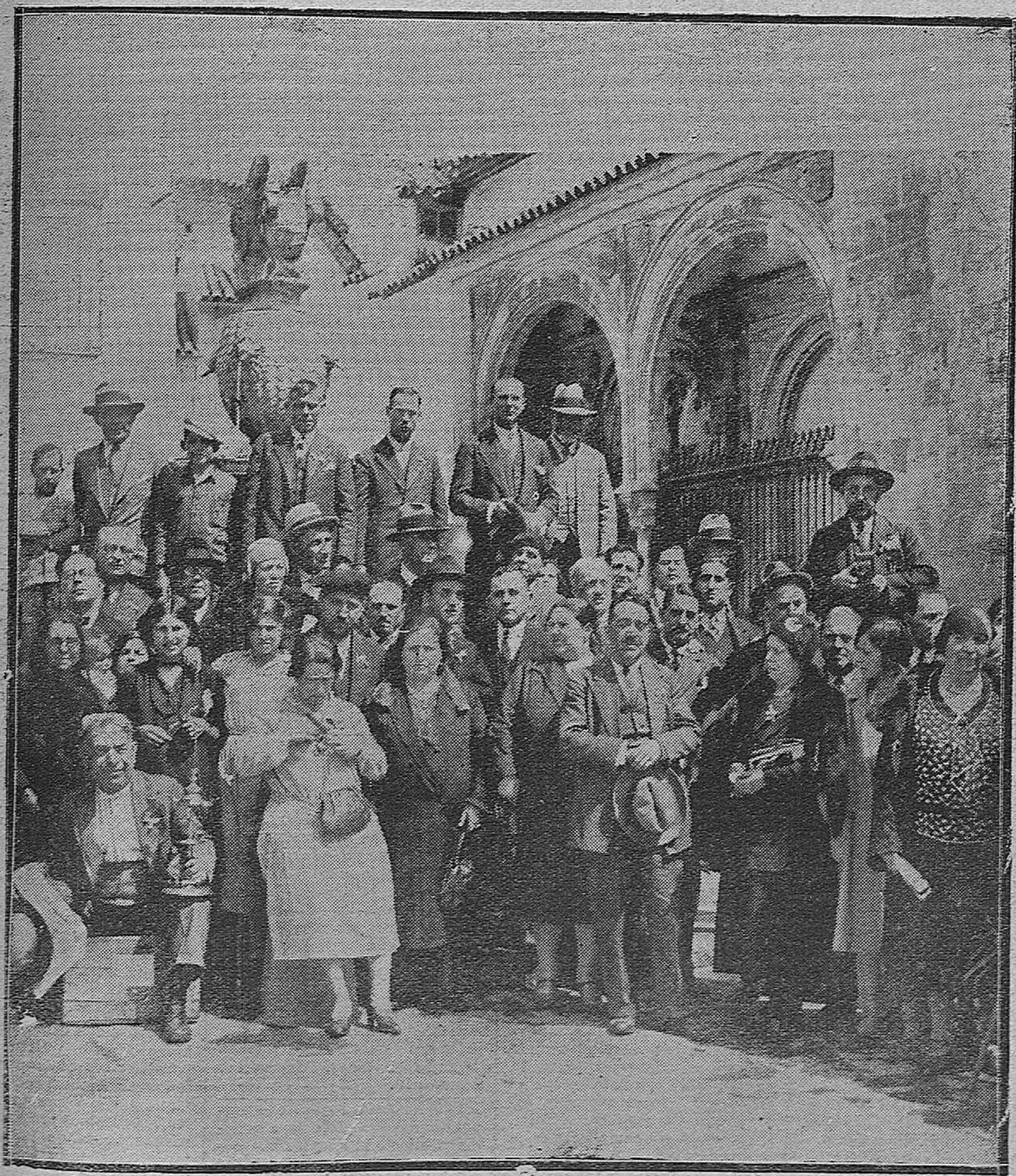
MIEMBROS DE LA UNIVERSIDAD POPULAR QUE SE ENCUENTRAN EN CÓRDOBA EN VIAJE CULTURAL.