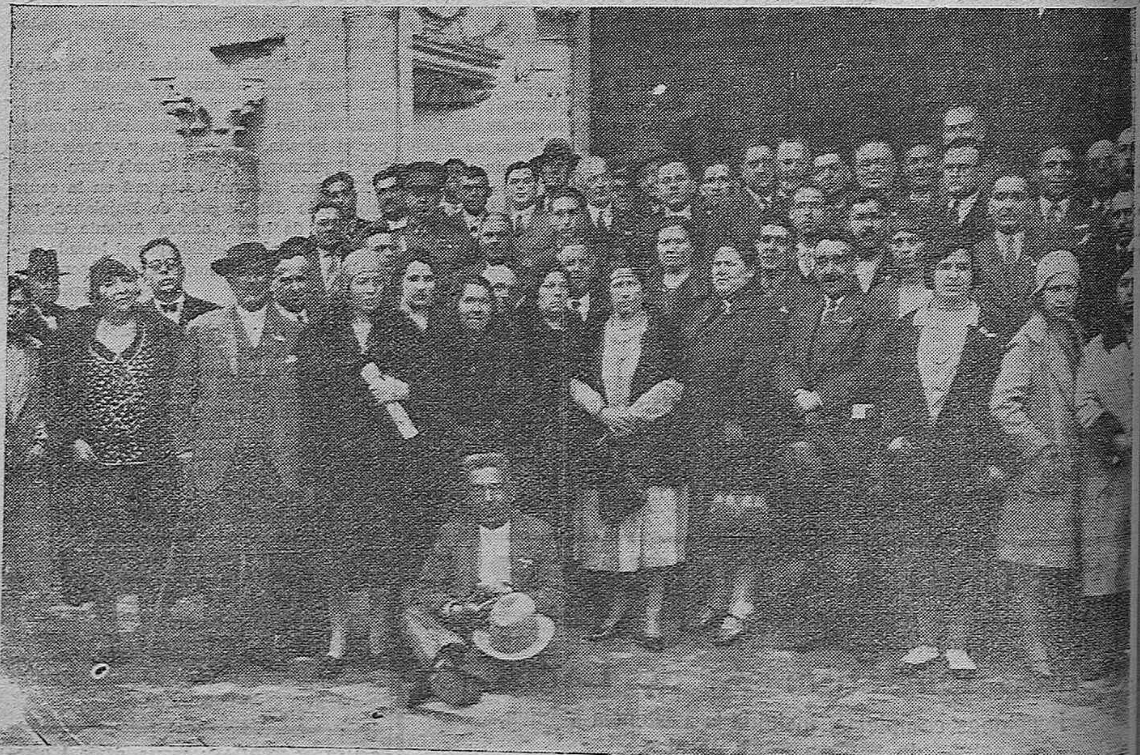
EXCURSIONISTAS QUE ACABAN DE LLEGAR A CÓRDOBA EN VIAJE DE TURISMO.

El lunes próximo, 12 de los corrientes, tendrá lugar en este establecimiento, la subasta pública de ropas y efectos procedentes de empeños hechos en las sucursales primera y segunda durante el mes de Septiembre último y que con arreglo a los estatutos de la casa corresponden venderse.