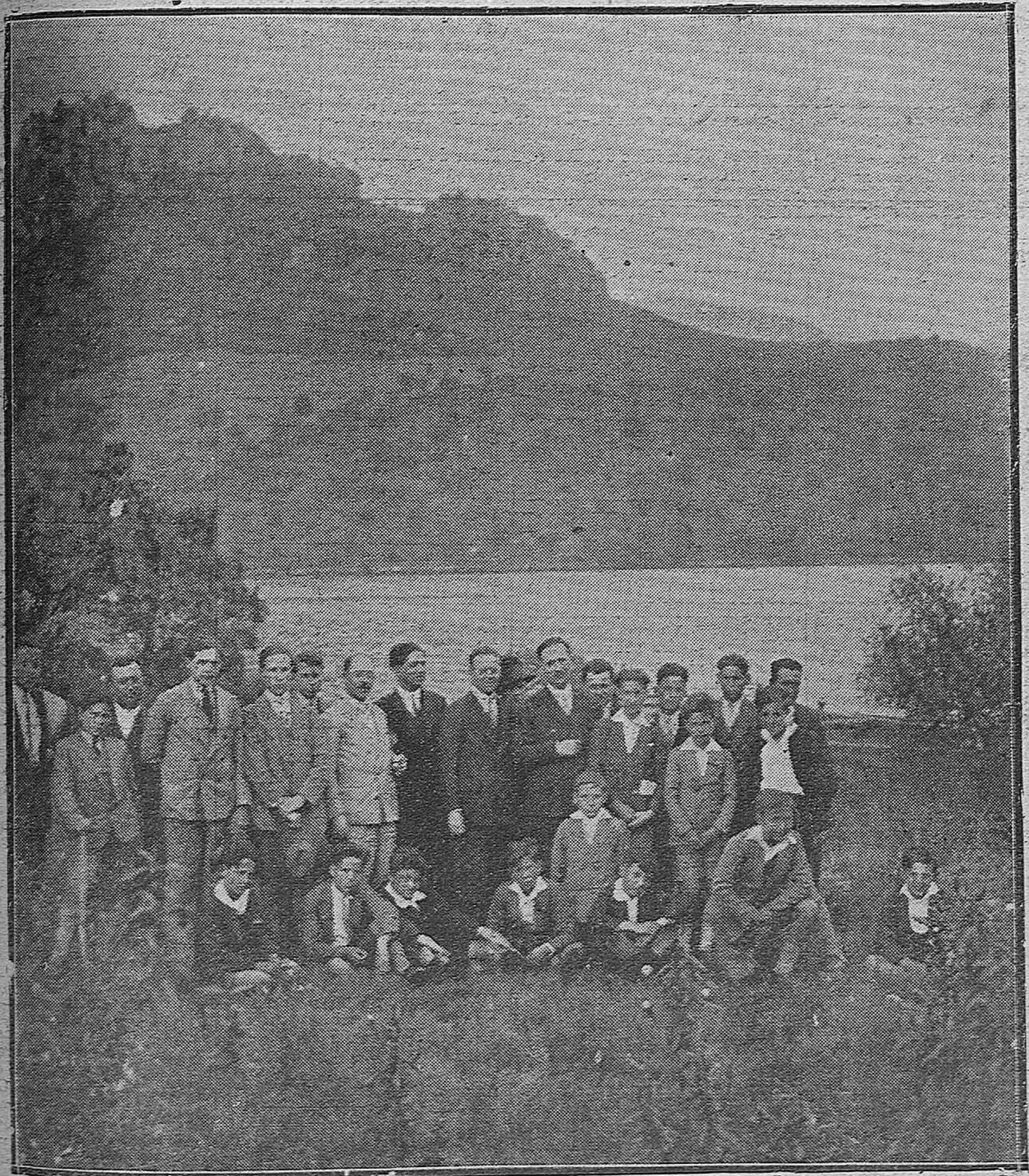
PROFESORES Y ALUMNOS DEL INSTITUTO DE FREGENAL DE LA SIERRA, QUE NOS VISITARON EN VIAJE CULTURAL, RECORRIENDO LUGARES PINTOESCOS DE LAS PROXIMIDADES DE NUESTRA CAPITAL.