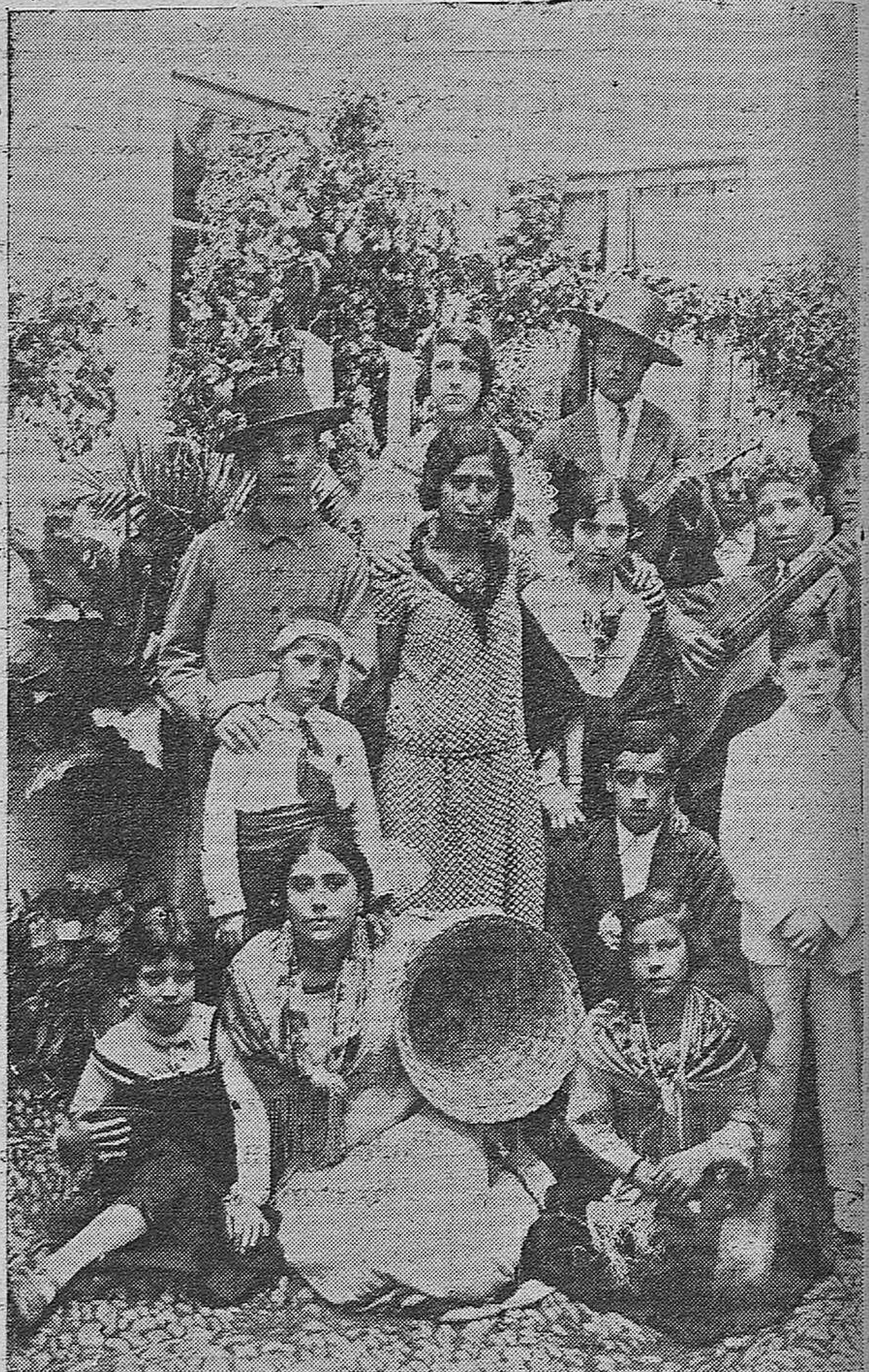
CRUCES DE MAYO.—LA ARTISTICA CRUZ INSTALADA EN LA CALLE DE CANELARIA

OCASION VERDAD: gorras, desde 1 peseta; camisas percal, desde 350; calzoncillos, desde 2 pesetas, en El Metro y sus Sucursales.