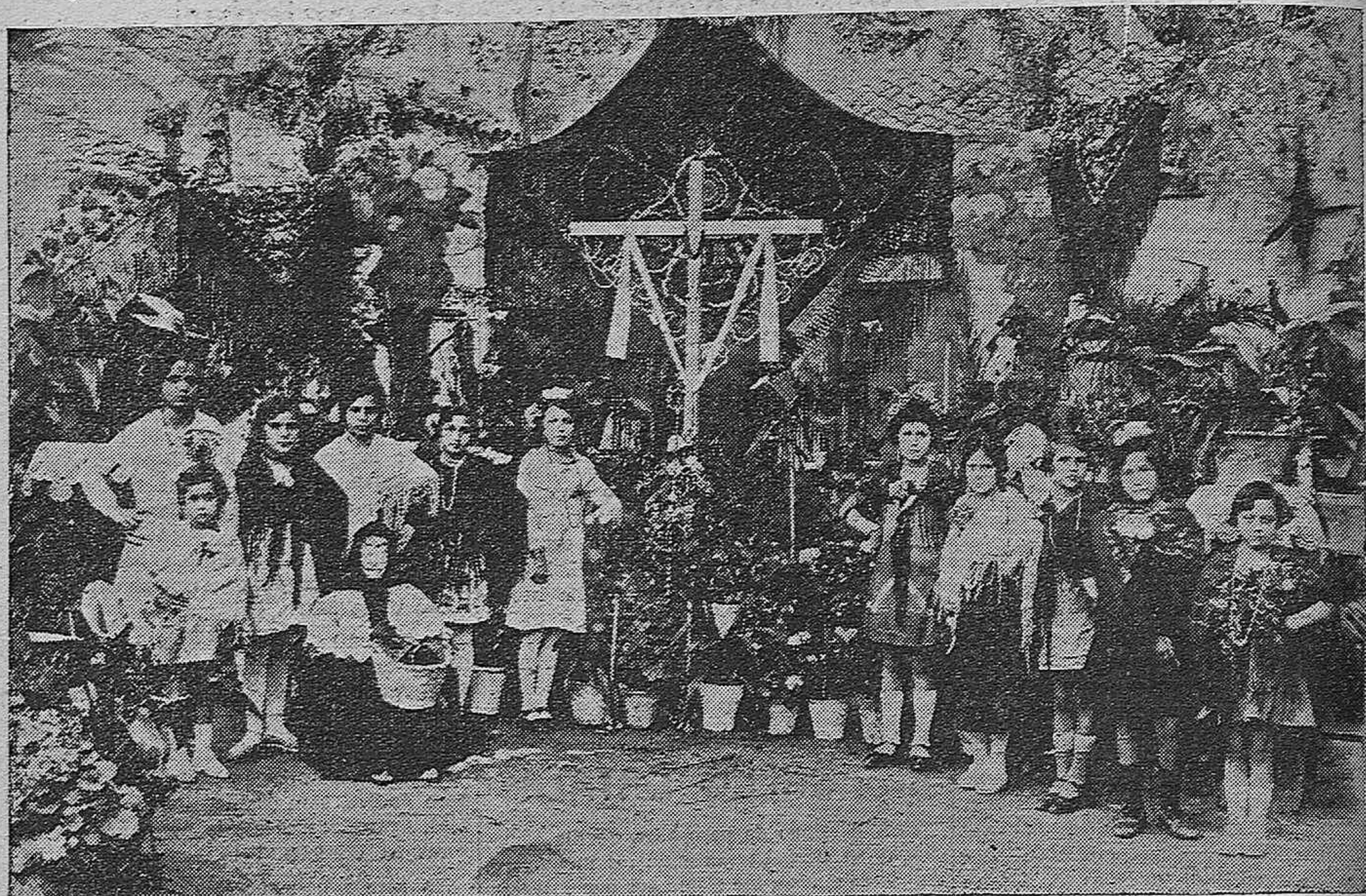
UNA CRUZ ADORNADA CON MUCHO GUSTO QUE LLAMÓ JUSTAMENTE LA ATENCIÓN.