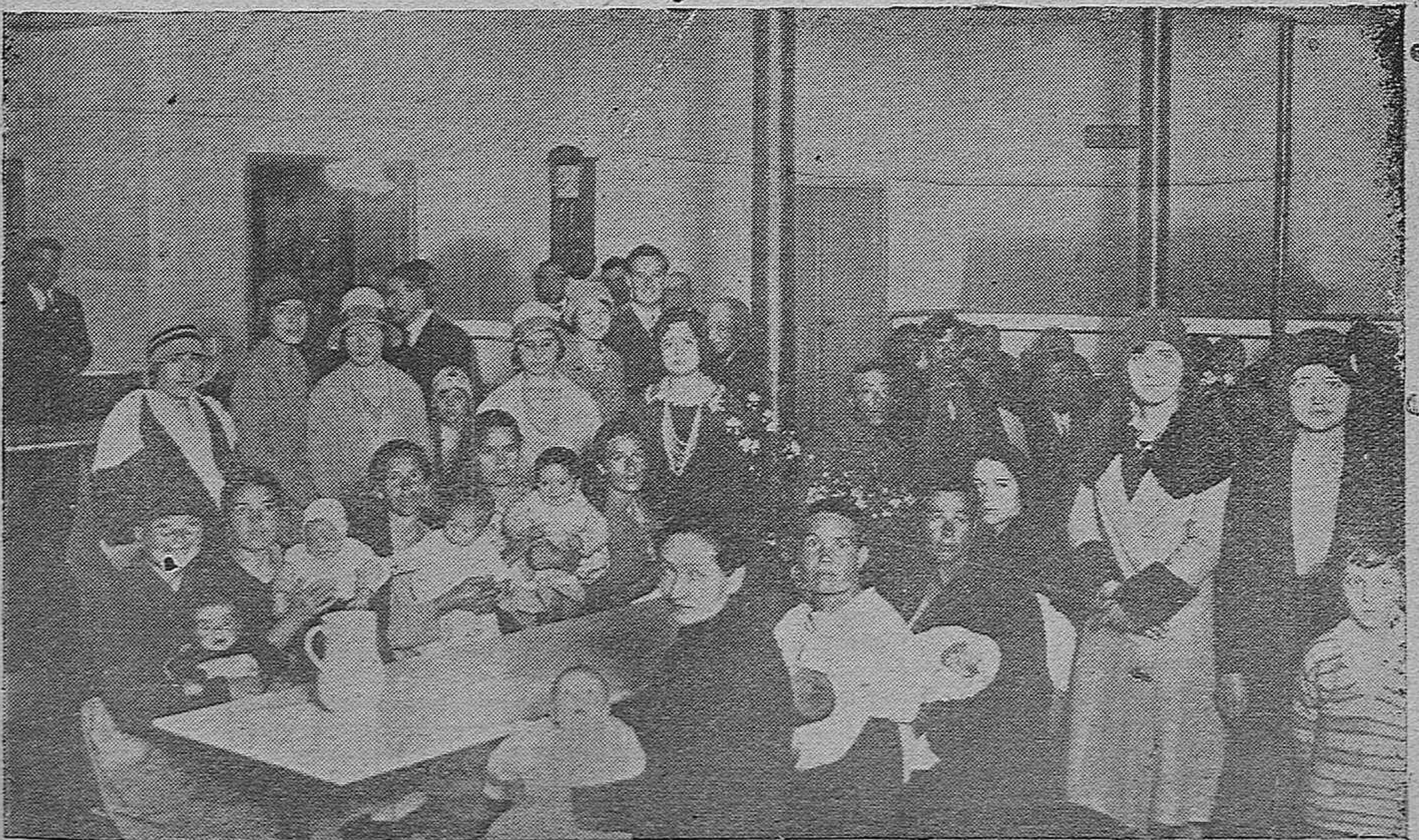
SOLEMNE INAUGURACIÓN DEL COMEDOR PARA MADRES LACTANTES, CON ASISTENCIA DE LAS AUTORIDADES.