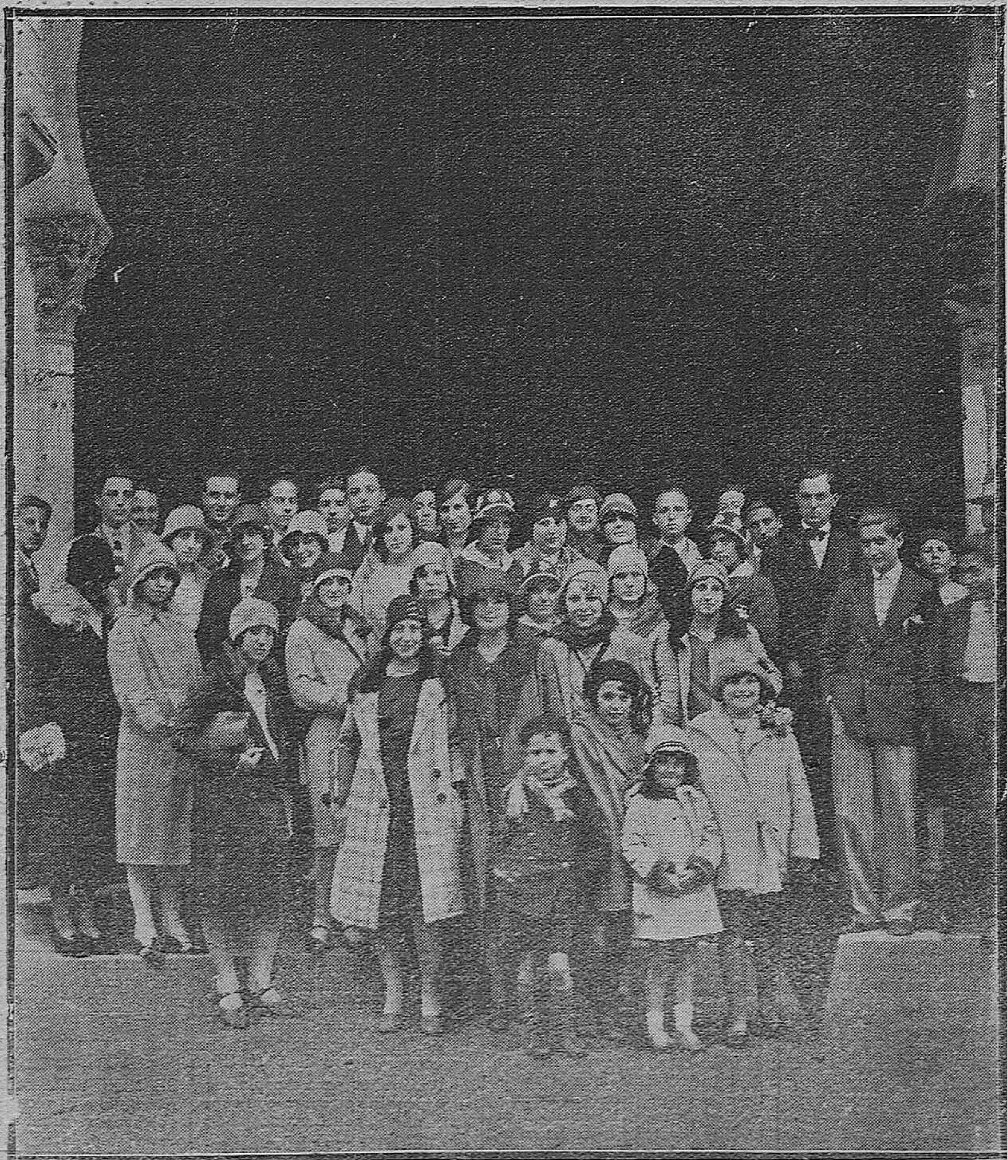
EXCURSIONISTAS ESCOLARES.—PROFESORAS Y ALUMNAS DE LA ESCUELA NORMAL DE SORIA, DESPUÉS DE VISITAR LA MEZQUITA.