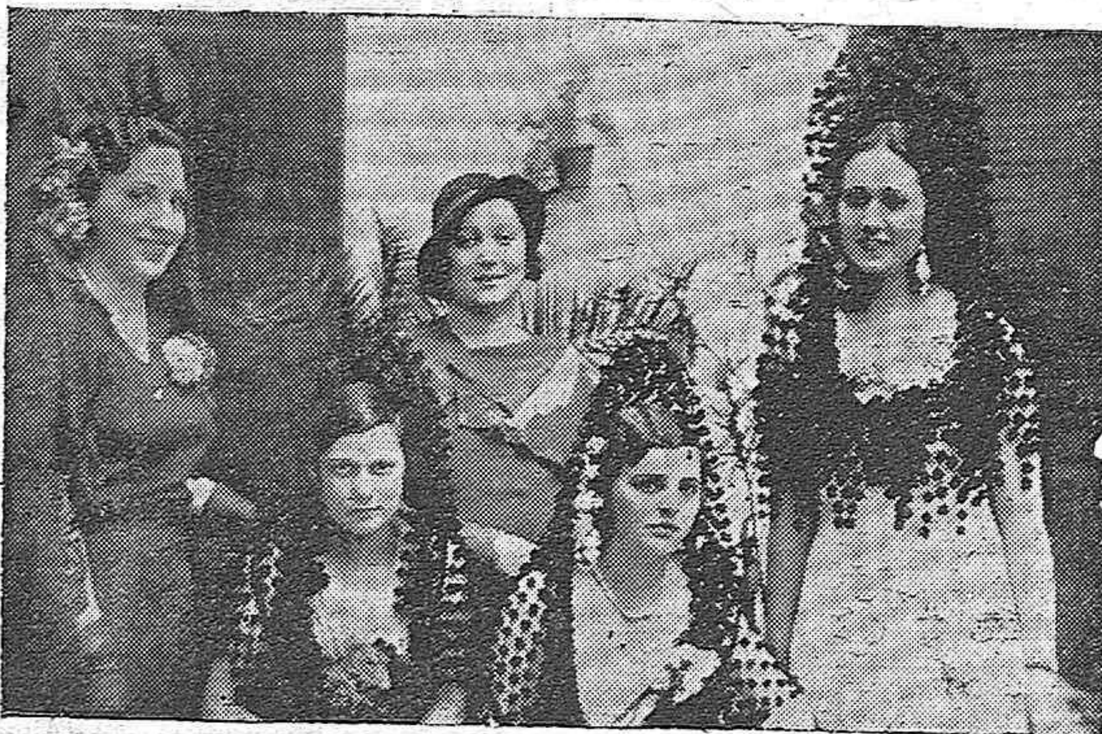
PRIEGO DE CORDOBA.—Bellas y distinguidas señoritas que presidieron la becerrada a beneficio de los pobres celebrada en este pueblo el día 1.º de Mayo.