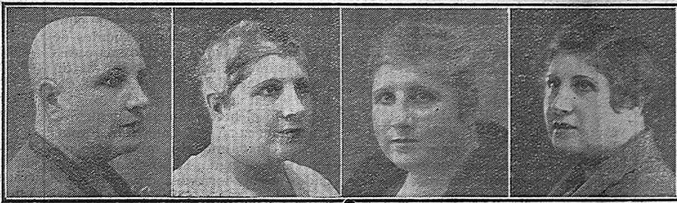
18 años calva 5 meses de tratamiento 8 meses de tratamiento 12 meses curada

DESINFECTANTE, 10 PESETAS CAPILAR, 20 PESETAS