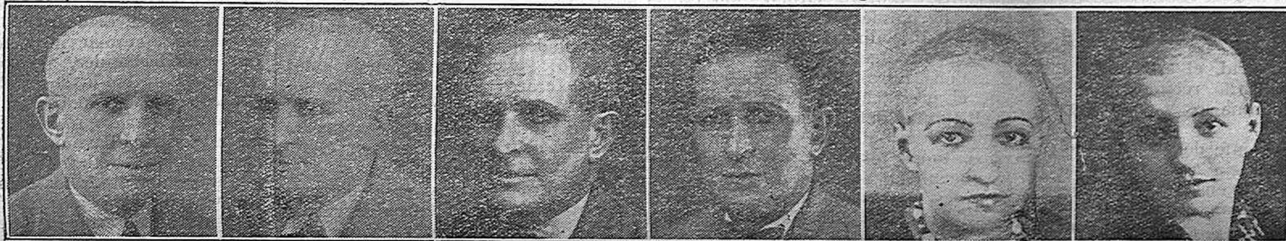
25 años enfermo 5 meses tratamiento 10 meses tratamiento 12 meses curado 3 meses tratamiento 12 años enferma

Todo frasco lleva esta etiqueta que sirve de garantía para el cliente