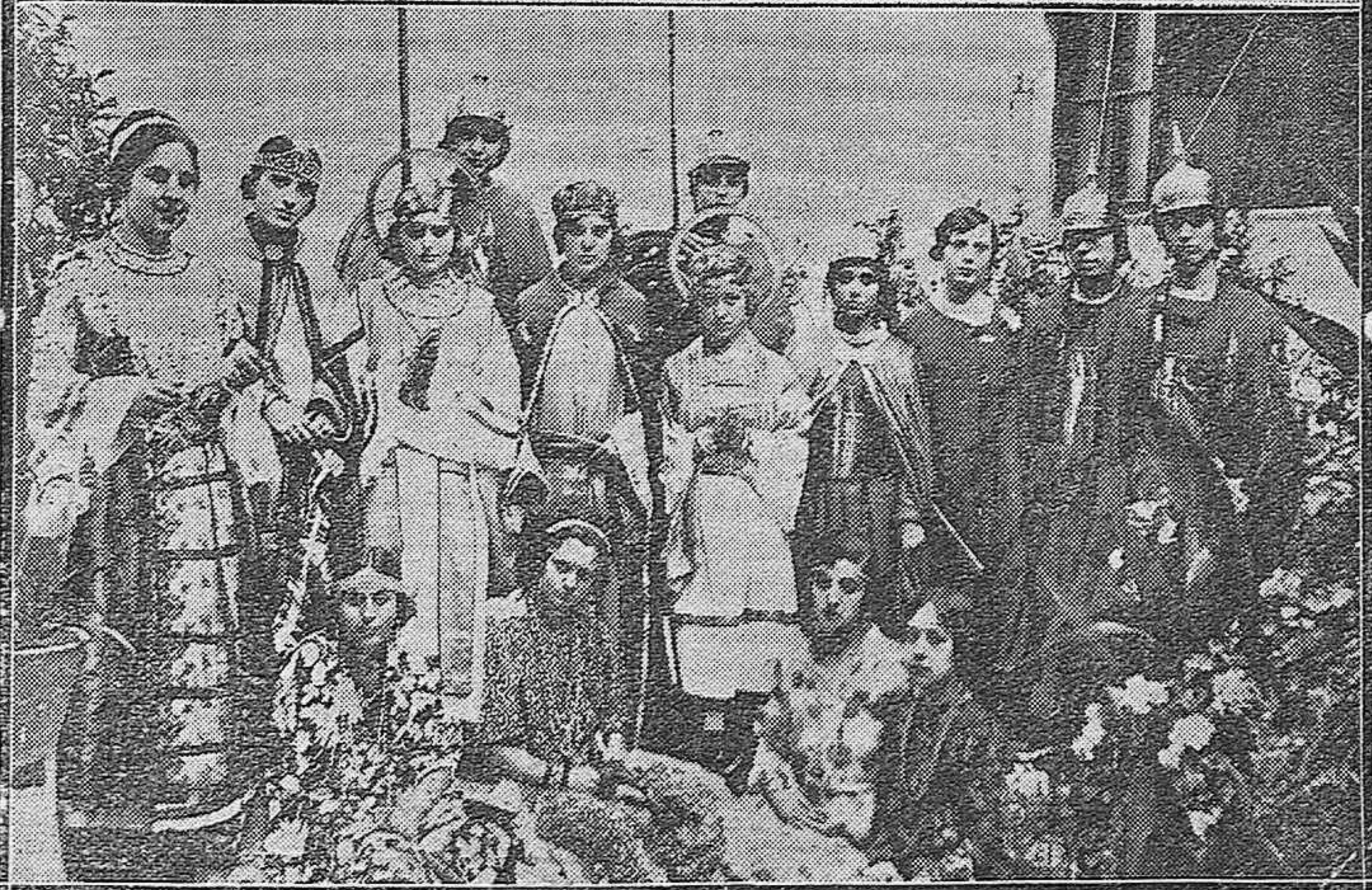
NOTAS GRÁFICAS DEL FESTIVAL EN EL ASILO DE JESÚS NAZARENO.—Niñas que presentaron un interesante cuadro plástico.—Lindas muchachas que intervinieron en la función teatral.