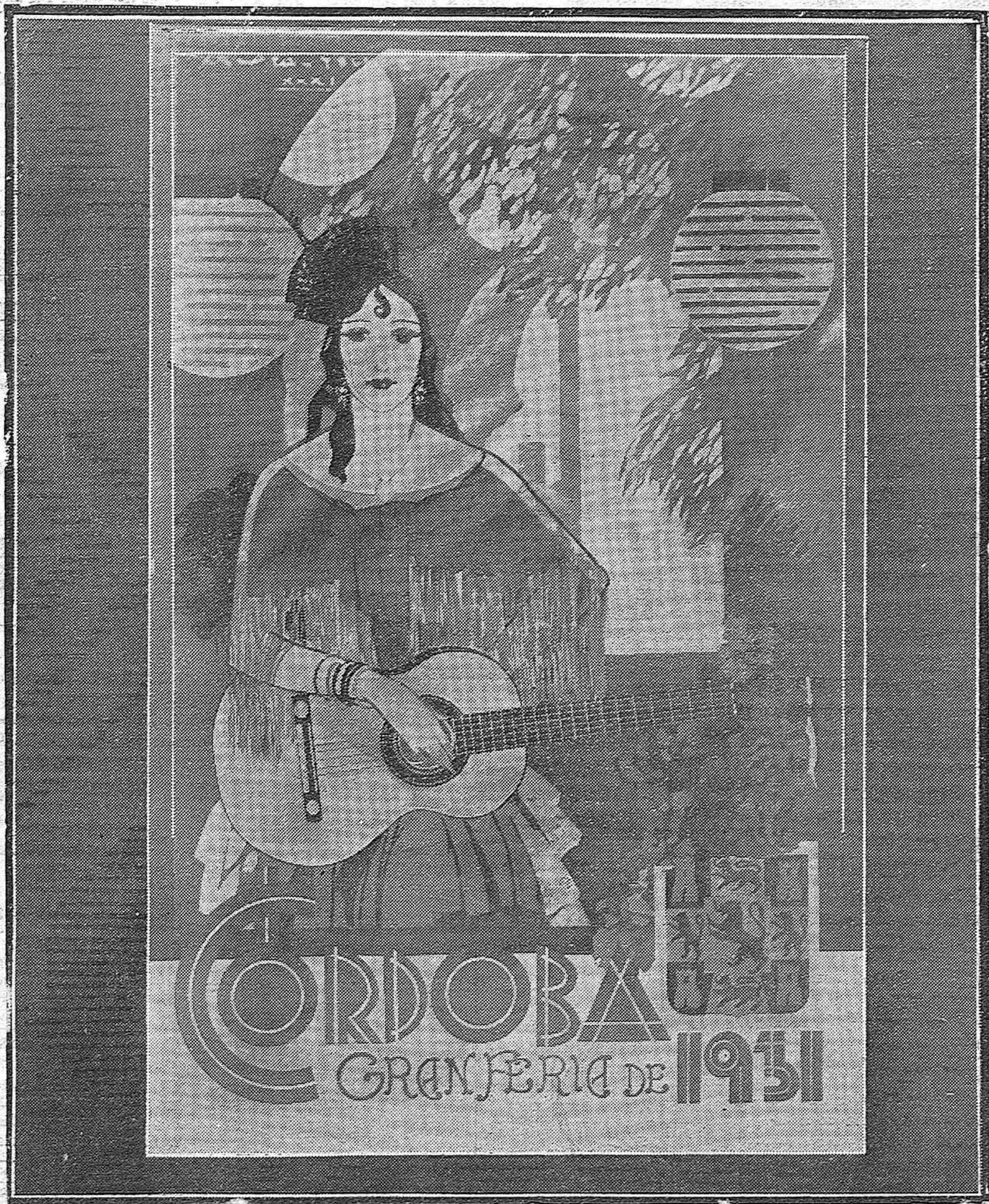
EL CARTEL ANUNCIADOR DE LA FERIA DE NUESTRA SEÑORA DE LA SALUD, ORIGINAL DEL REPUTADO ARTISTA ARISTO TELLEZ