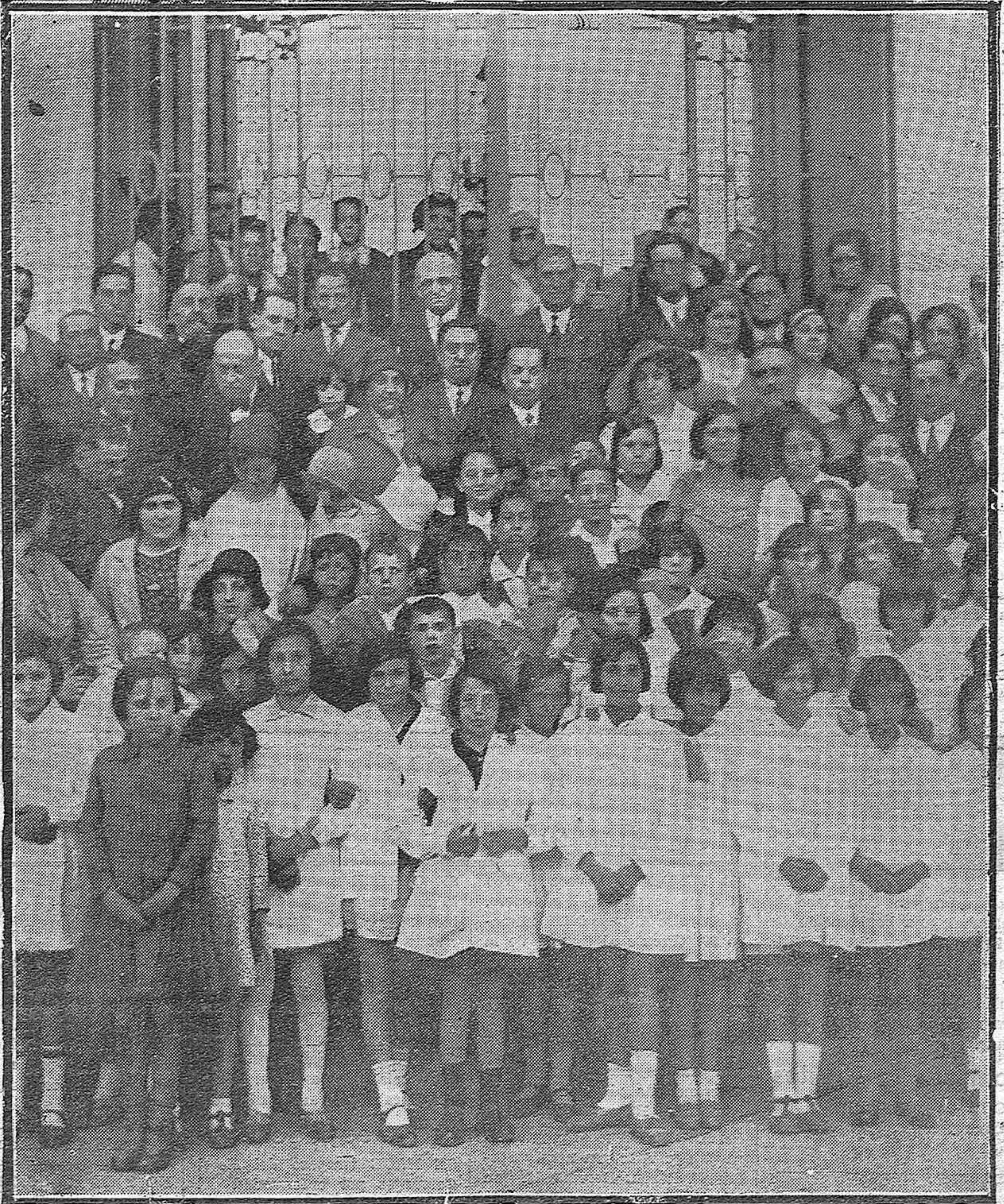
LA FIESTA DEL LIBRO EN CORDOBA.—Las autoridades y los niños de las escuelas municipales en la pérgola de los Jardines del Duque de Rivas, después del hermoso acto celebrado ayer