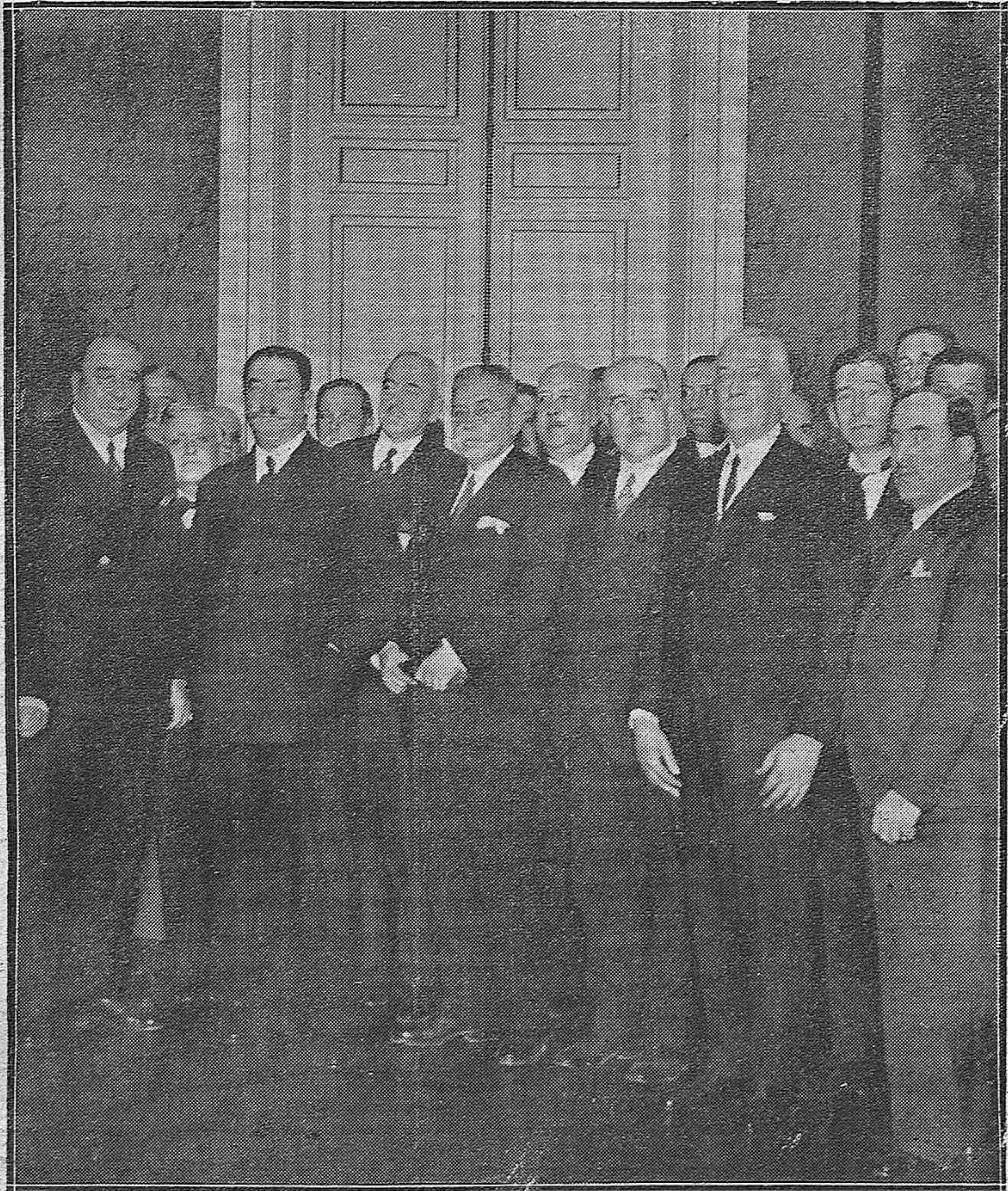
EL PRESIDENTE DEL CONSEJO DE MINISTROS, GENERAL BERENGUER, CON EL MINISTRO DE LA GOBERNACIÓN Y LOS NUEVOS GOBERNADORES, ENTRE LOS CUALES SE ENCUENTRA EL DE CÓRDOBA (X) SEÑOR ATIENZA.