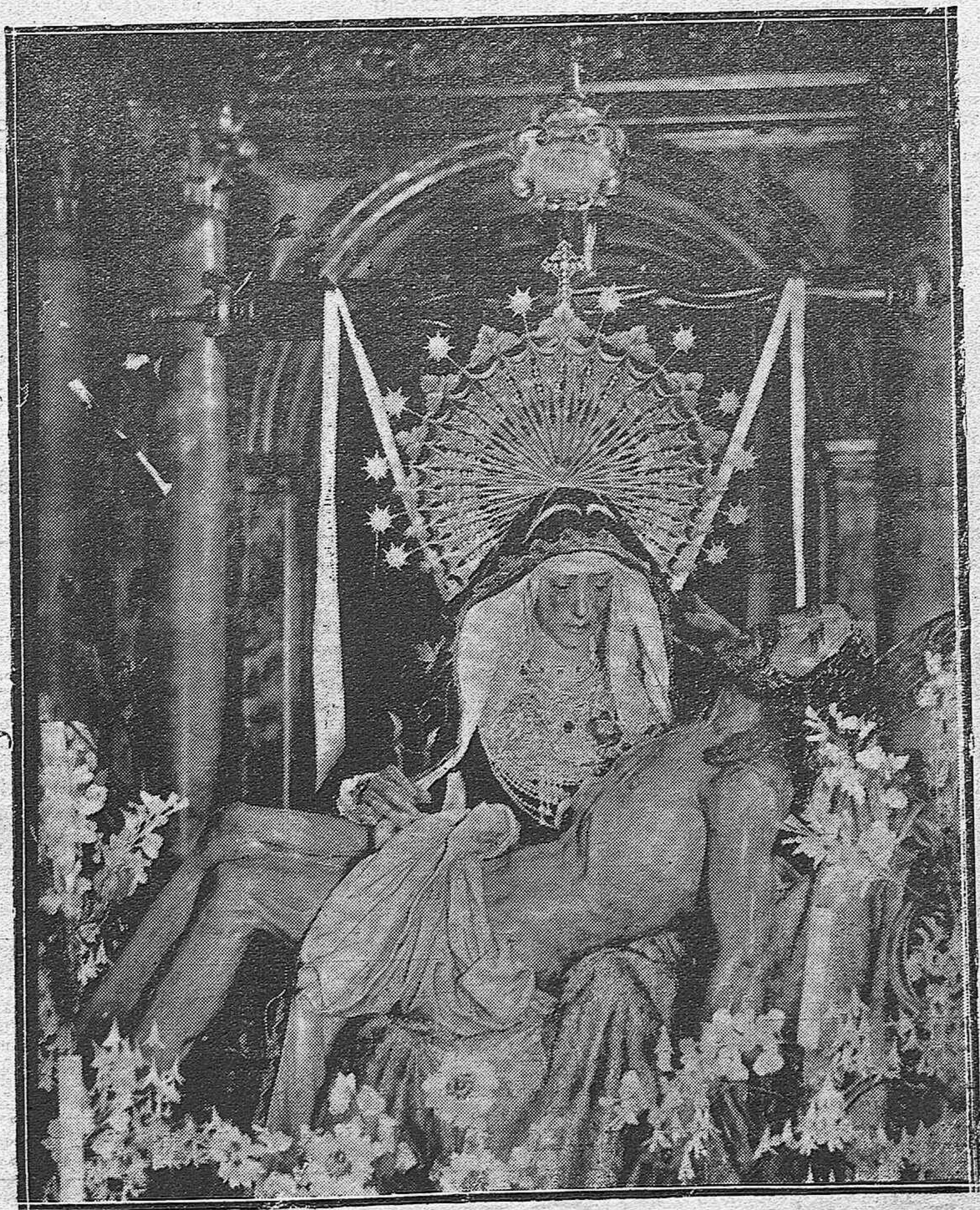
LA VIRGEN DE LAS ANGIUSTIAS, MAGNIFICA ESCULTURA QUE SE VENERA EN SAN AGUSTIN, Y QUE SE ATRIBUYE, MUY FUNDADAMENTE, AL IMAGINERO CORDOBES JUAN DE MESA, AUTOR, SEGUN SE HA COMPROBADO, DEL FAMOSO JESUS DEL GRAN PODER, DE SEVILLA.