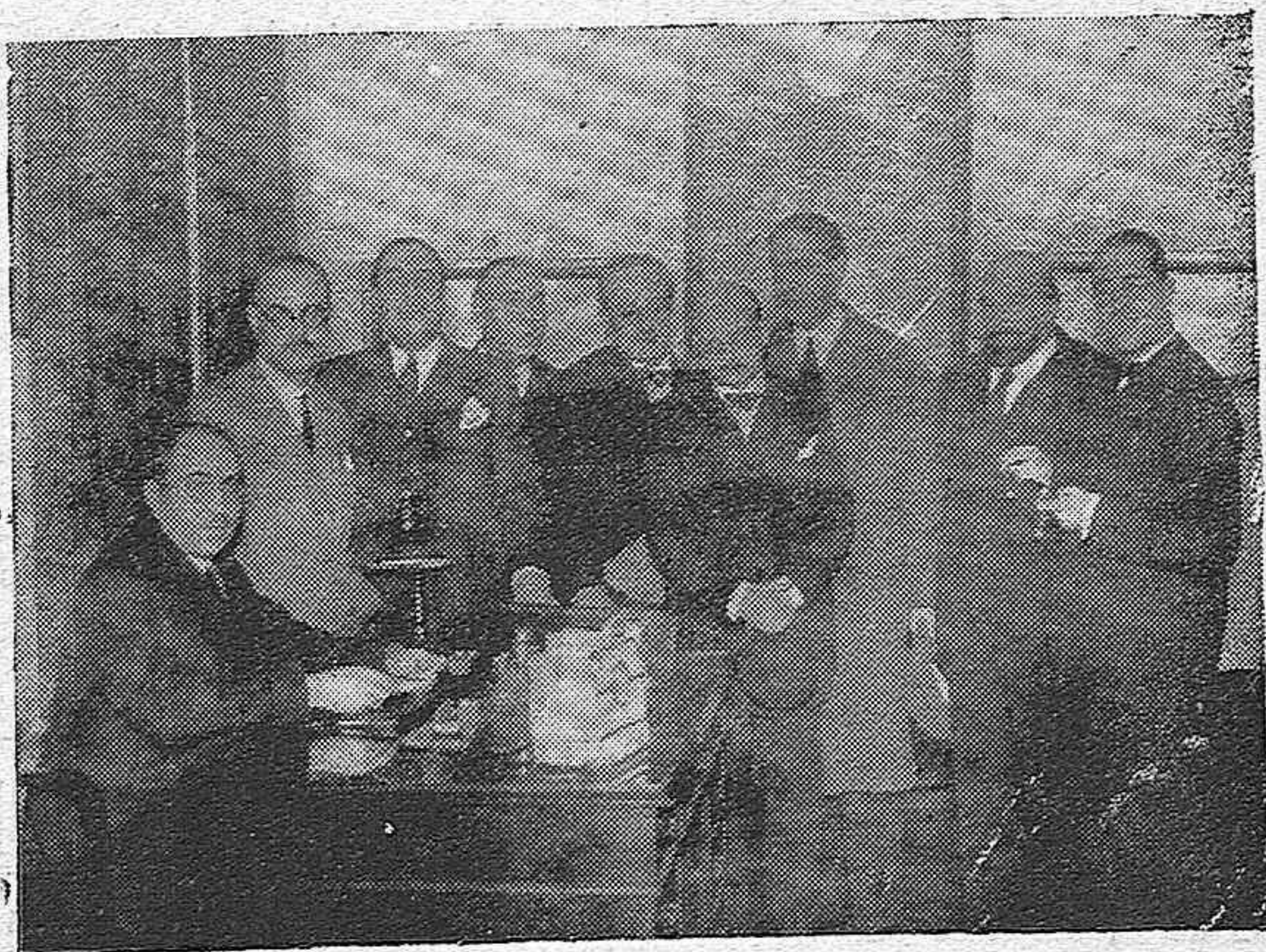
MADRID.—LA ANTIGUA JUNTA DEL ATENEO MADRILEÑO EN EL ACTO DE POSESIONARSE AYER NUEVAMENTE DE SUS CARGOS.

GANGA VERDAD: retales varias clases de telas, a una peseta el retal; lienzo moreno, fuerte, a 0'50 pesetas el metro; telas blancas, suaves, desde 0'60 pesetas, en EL METRO y sus Sucursales.