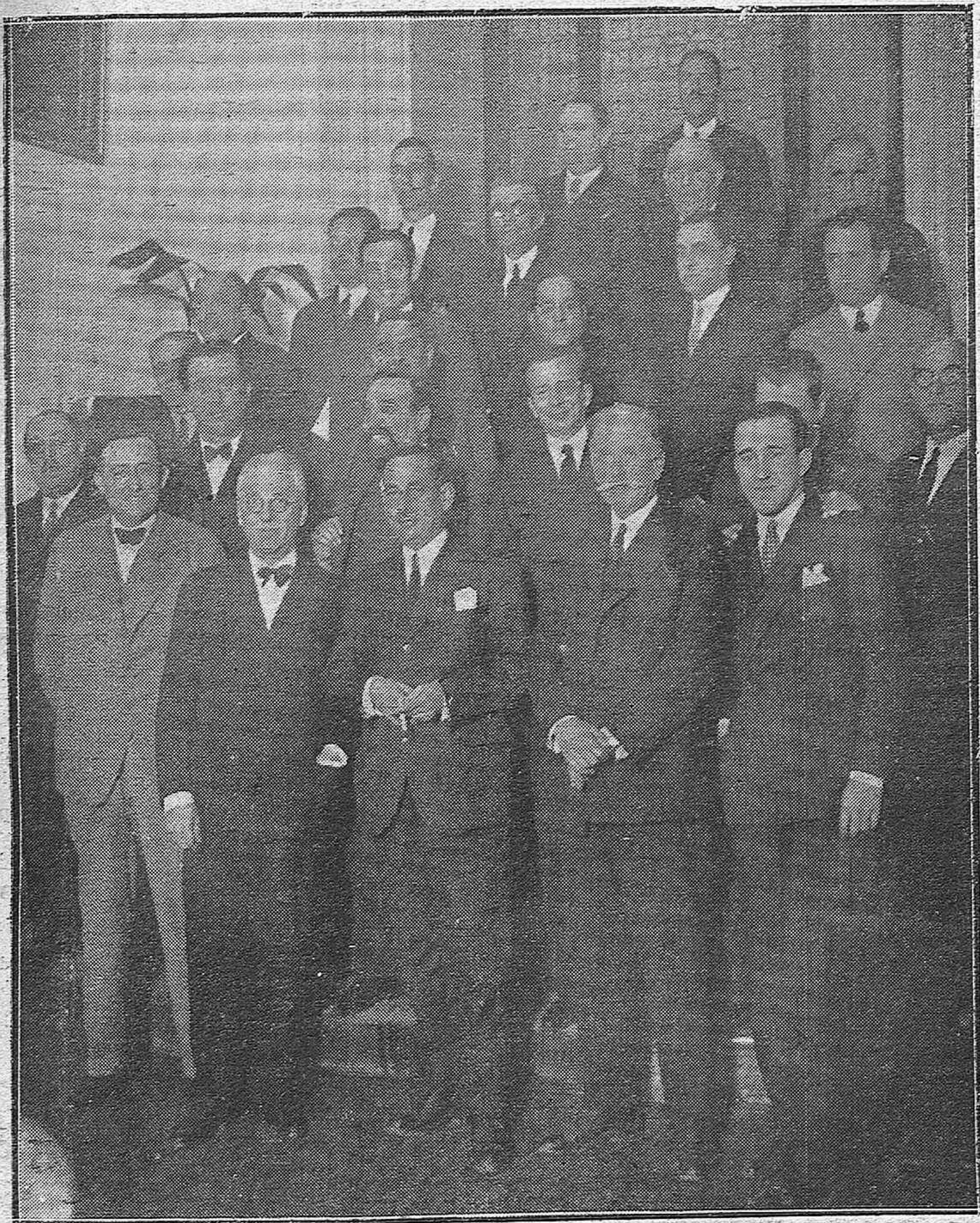
EN EL AYUNTAMIENTO. — SESIÓN EXTRAORDINARIA DEL PLENO MUNICIPAL. DONDE SE ACORDÓ REITERAR, CON CARÁCTER IRREVOCABLE, LA DIMISIÓN DEL AYUNTAMIENTO.