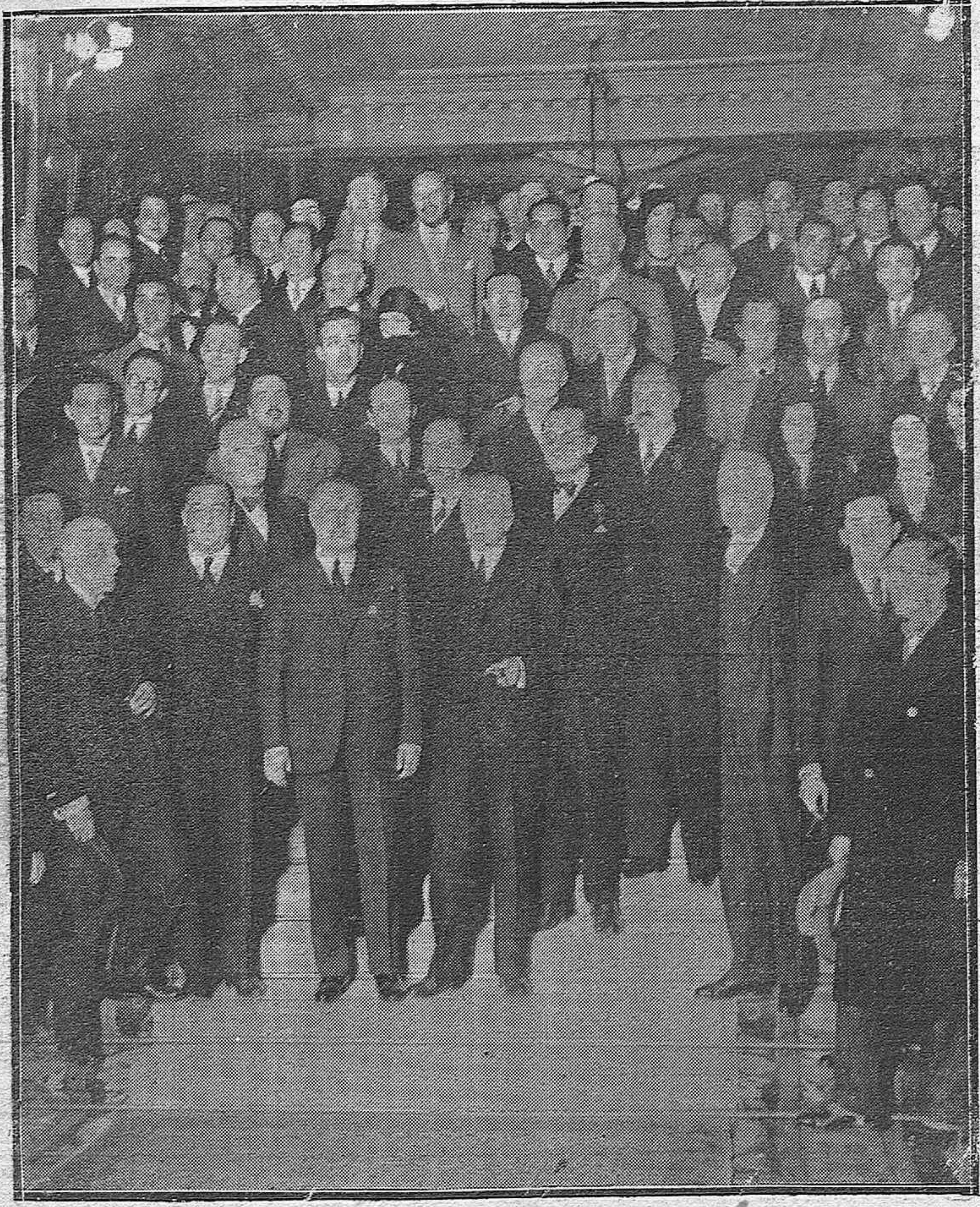
MADRID.—EN EL HOTEL PALACE—EL EX-MINISTRO DE FOMENTO, CONDE DE GUADALHORCE, DESPUÉS DEL BANQUETE MONSTRUO CON QUE LE OBSEQUIARON SUS COMPAÑEROS DE CUERPO, LOS INGENIEROS CIVILES.