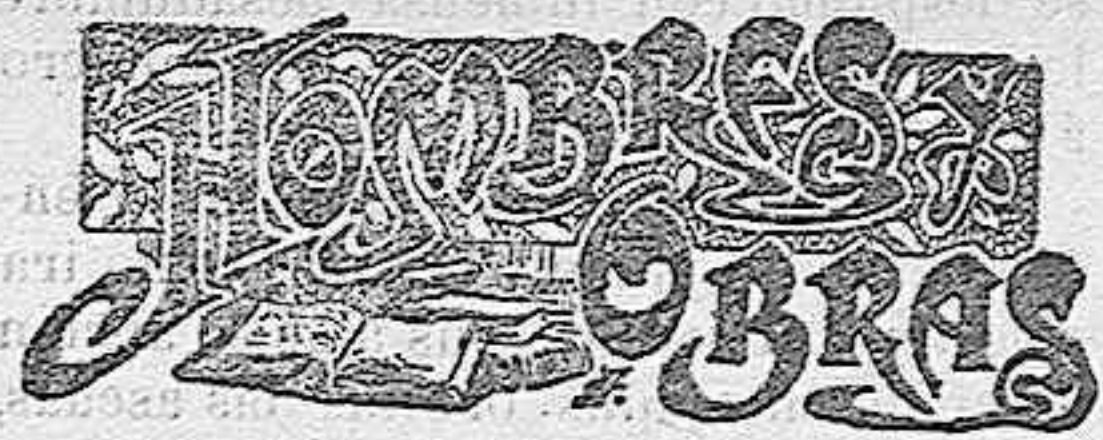
GARCILASO DE LA VEGA