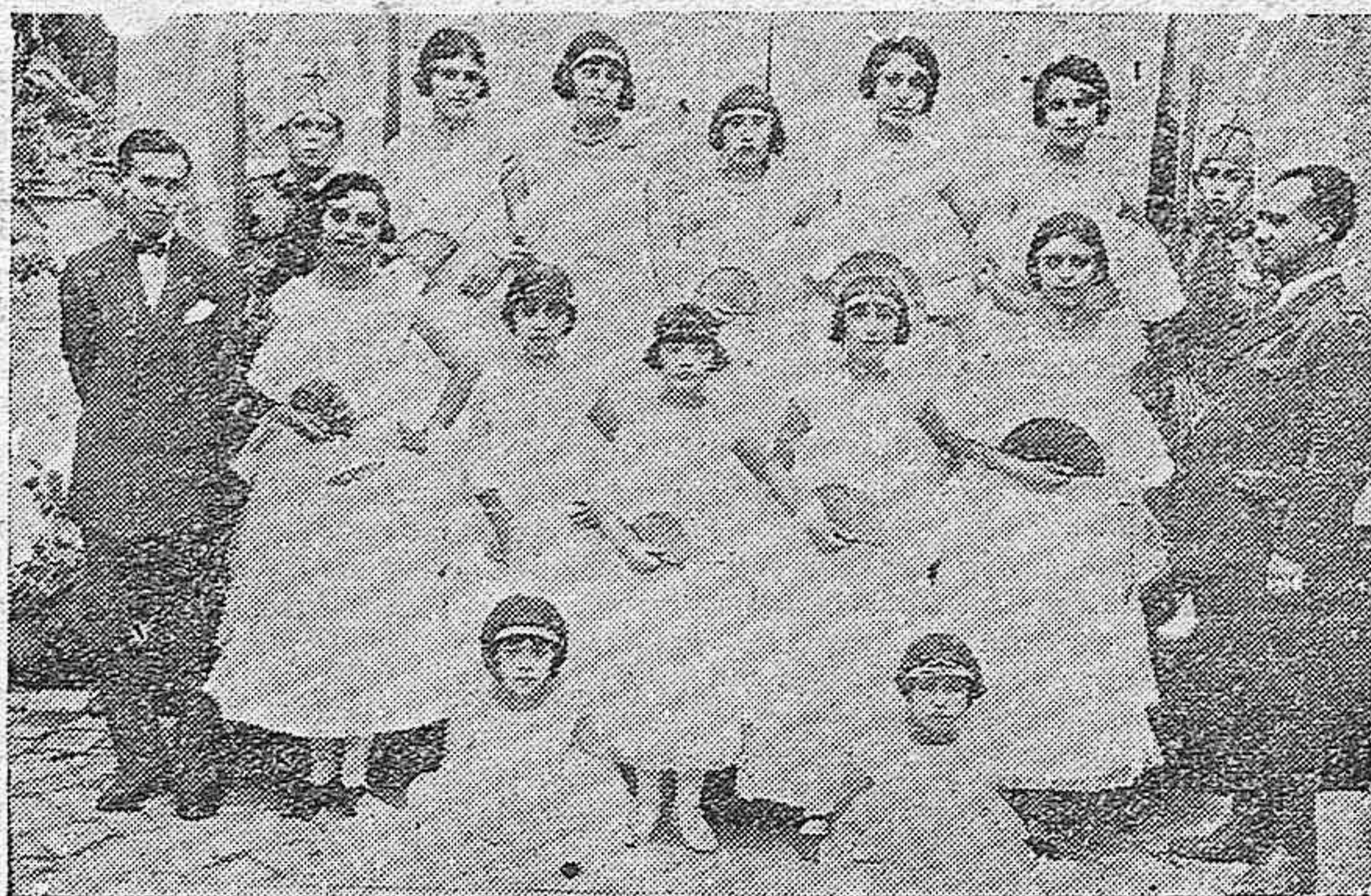
SEÑORITAS QUE INTERVINIERON EN LA FUNCIÓN CELEBRADA EN EL DOMICILIO DE LOS EXPLORADORES CORDOBESES.

OCASION: Percales, Driles, Vichy, Telas blancas y Opales a precios increíbles en El Metro y sus Sucursales.