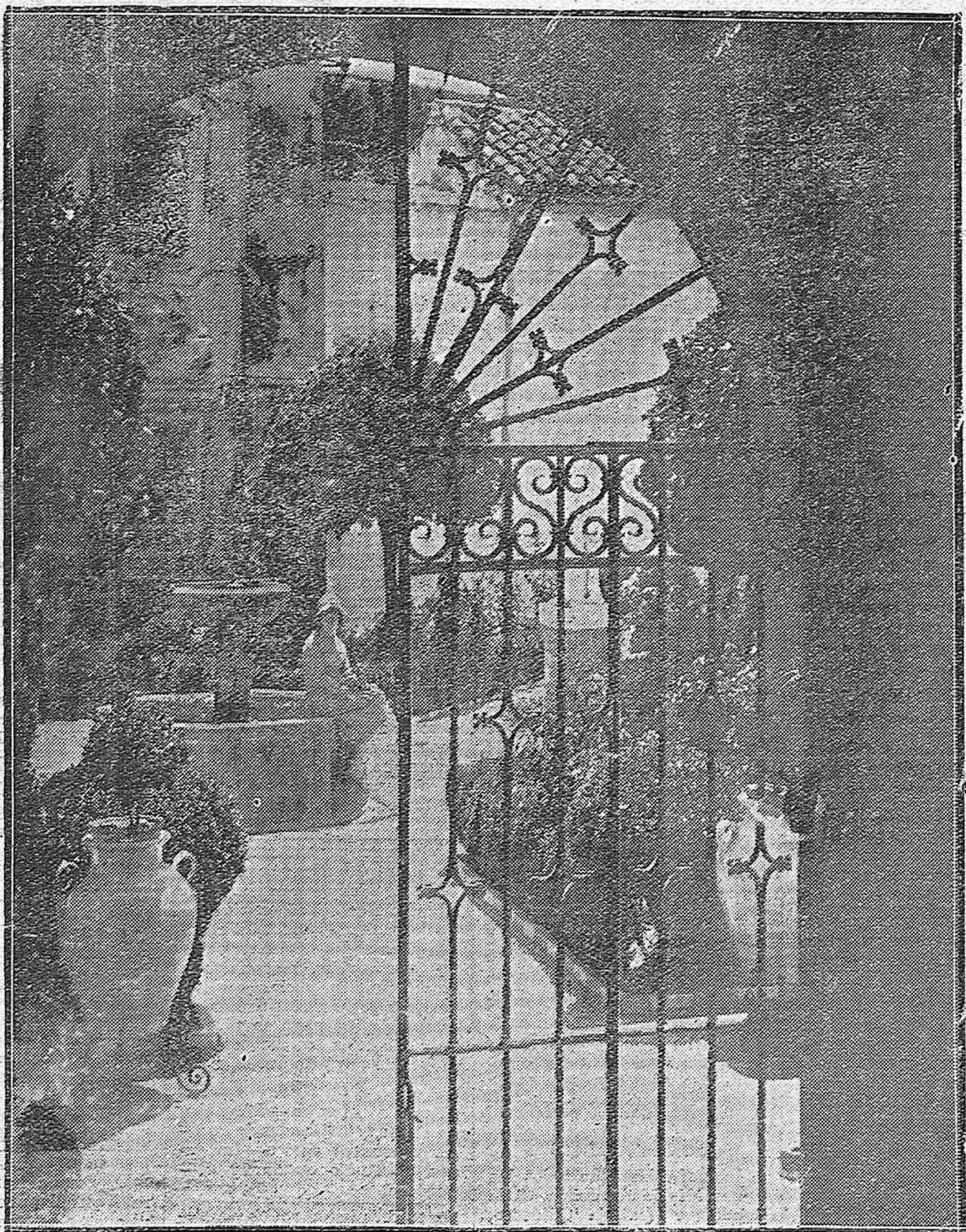
Nuestro Museo de Bellas Artes.—Un aspecto del interesante y artístico patio central.