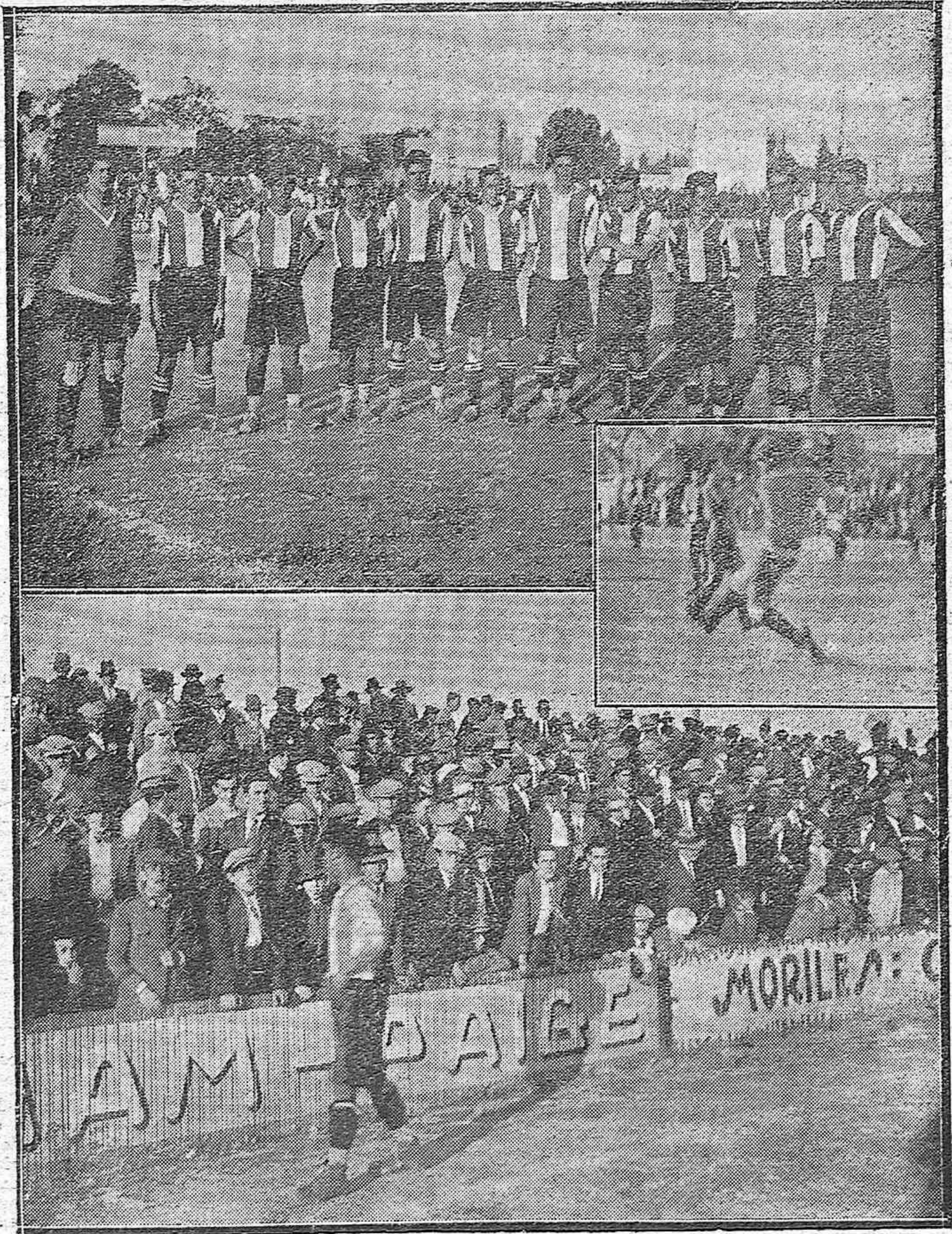
NOTAS DEPORTIVAS DEL DOMINGO. —Presentación en el Stadium América, del nuevo equipo Racing Club, que luchó contra el Real Betis, quedando vencedor.—Una vista del numeroso público que acudió.—En el centro, una salida peligrosa del portero del Racing.