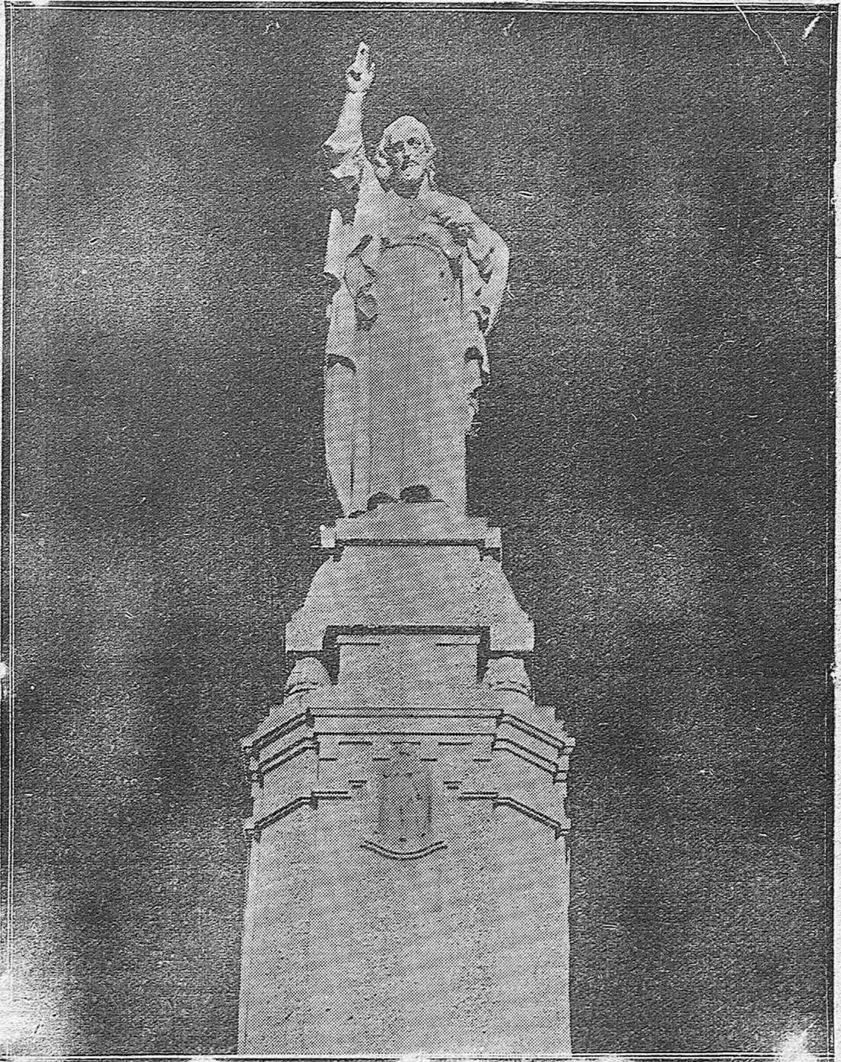
Bellísima escultura del Sagrado Corazón de Jesús, obra del insigne artista Collaut Valera, que se alza en las Ermitas, y cuya inauguración se celebrará mañana con gran solemnidad.