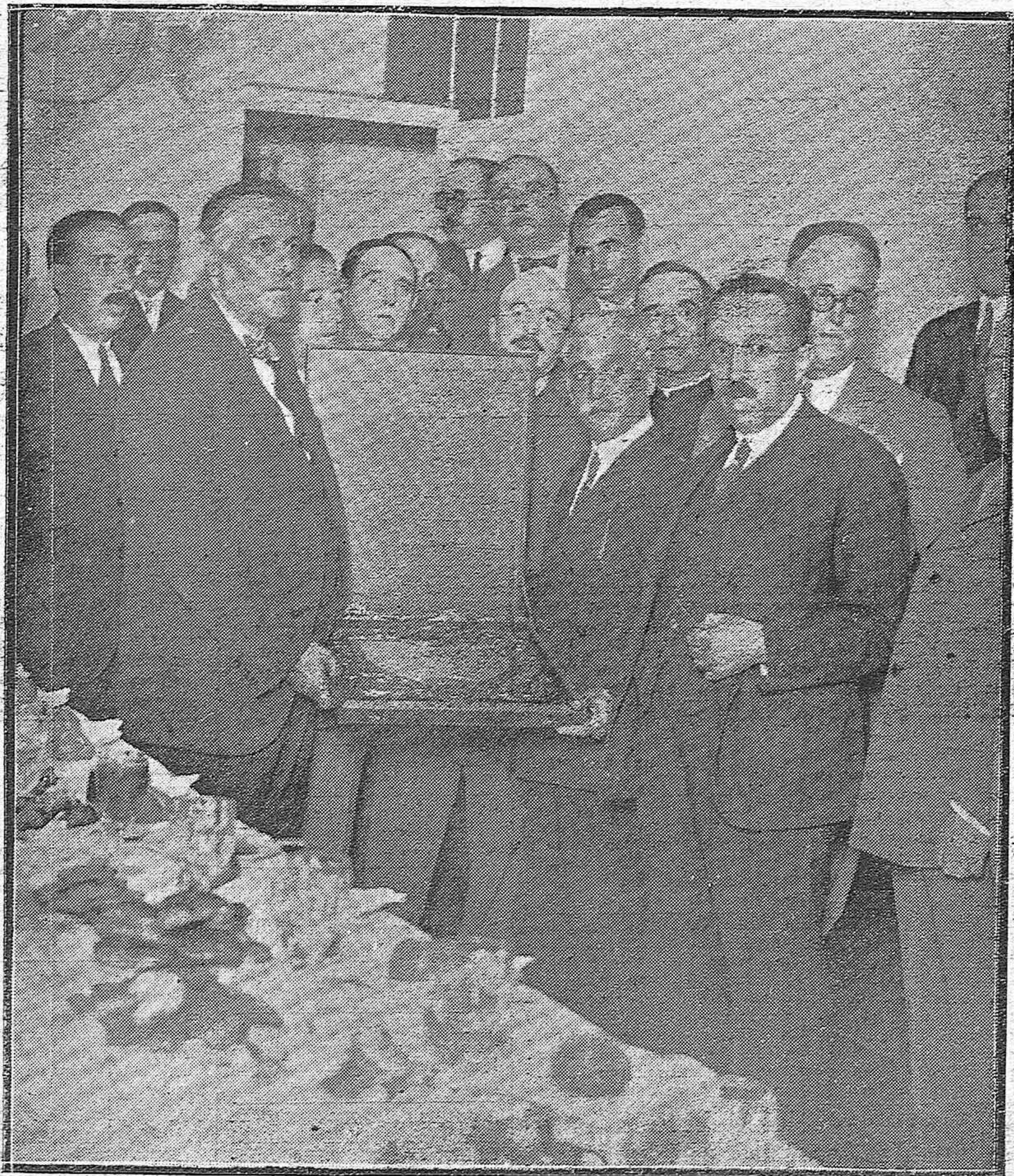
MADRID.—EN LA CARCEL MODELO.—HOMENAJE TRIBUTADO POR EL CUERPO DE PRISIONES AL MINISTRO DE GRACIA Y JUSTICIA, CON LA ENTREGA DE UNA PLACA DE HONOR NOMBRÁNDOLO SOCIO HONORARIO DE LA MUTUALIDAD BENÉFICA DEL CUERPO