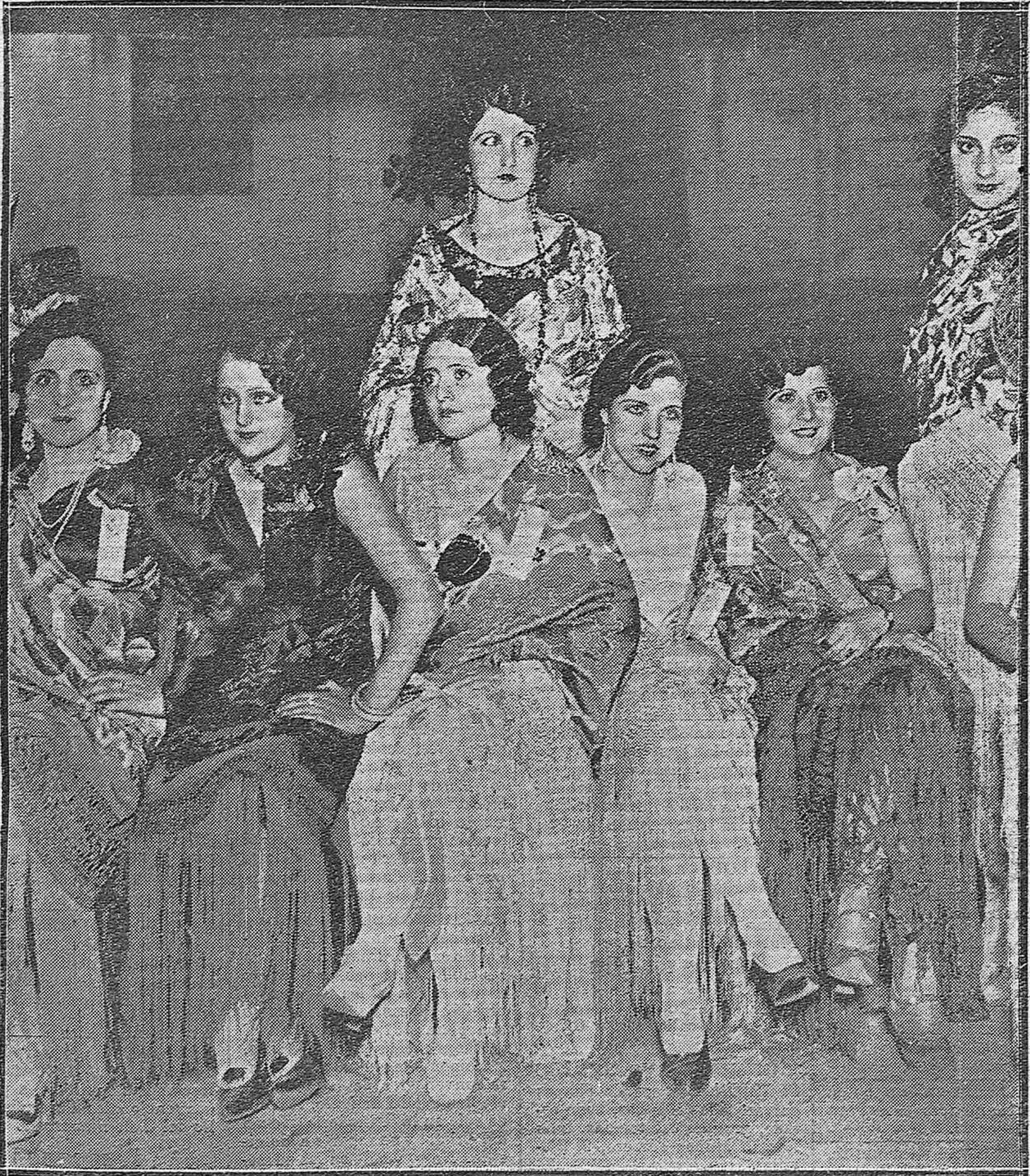
MADRID.—BELLÍSIMAS SEÑORITAS DE TODOS LOS DISTRITOS DE LA CORTE, REUNIDAS EN EL CENTRO DE HIJOS DE MADRID, ENTRE LAS CUALES SE DESIGNARÁ LA REINA DE LA BELLEZA MADRILEÑA.