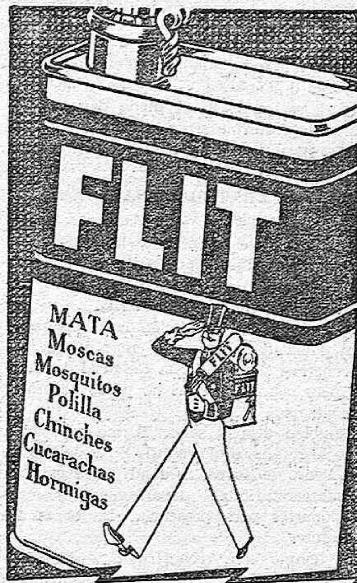
Flit mata más rápido. Bidón amarillo - franja negra.

Los baños de la Ribera estuvieron también hasta las primeras horas de la madrugada bien concurridos, habiendo algunos aficionados al remo que dieron sus paseitos por la acuática superficie del sufrido Bclis.