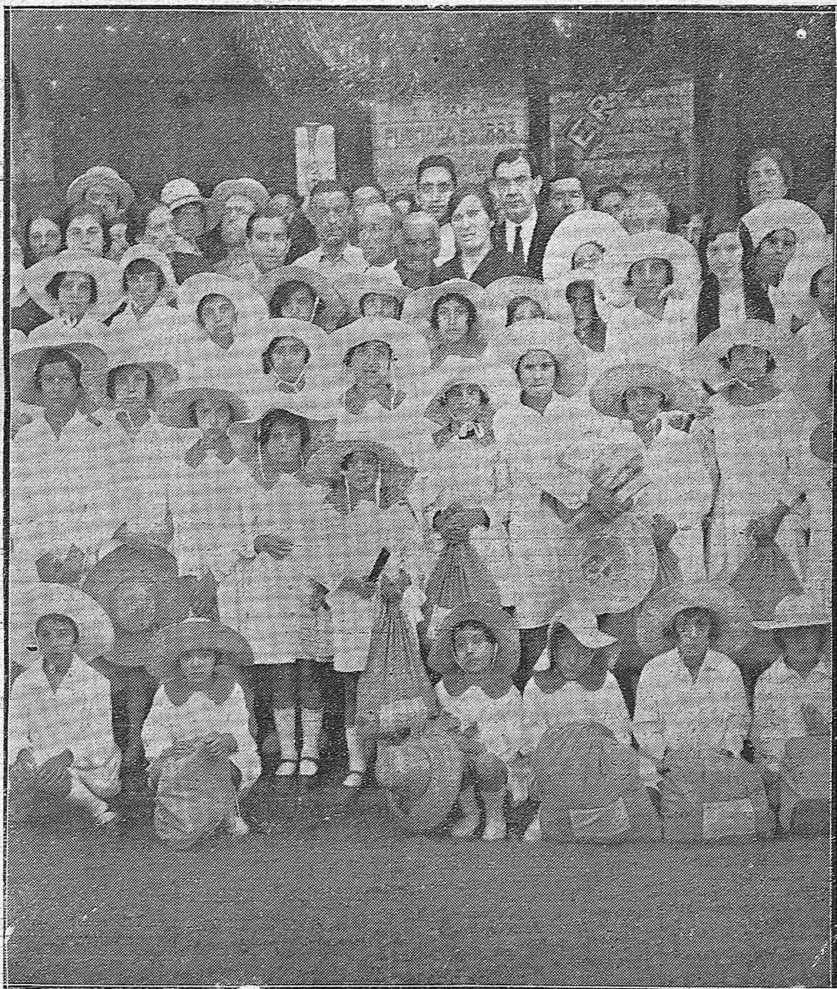
LA COLONIA ESCOLAR MARITIMA.—LAS CINCUENTA NIÑAS QUE FORMARON LA COLONIA ESCOLAR PERTENECIENTES A LAS ESCUELAS NACIONALES DE CÓRDOBA Y QUE MARCHARON PARA TORREMOLINOS (MÁLAGA)