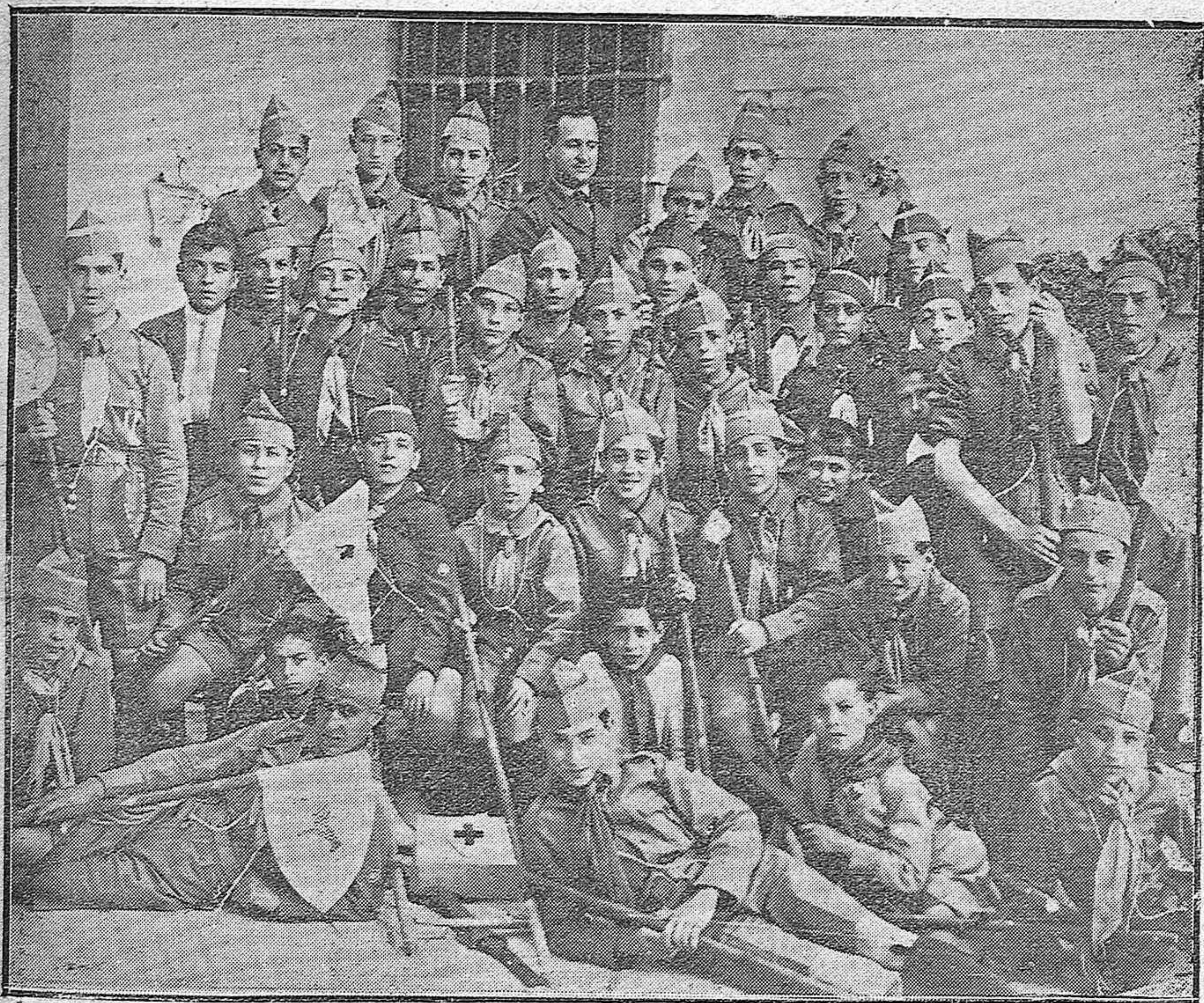
Grupo de exploradores cordobeses que forman la Sección de Córdoba, recientemente organizada.