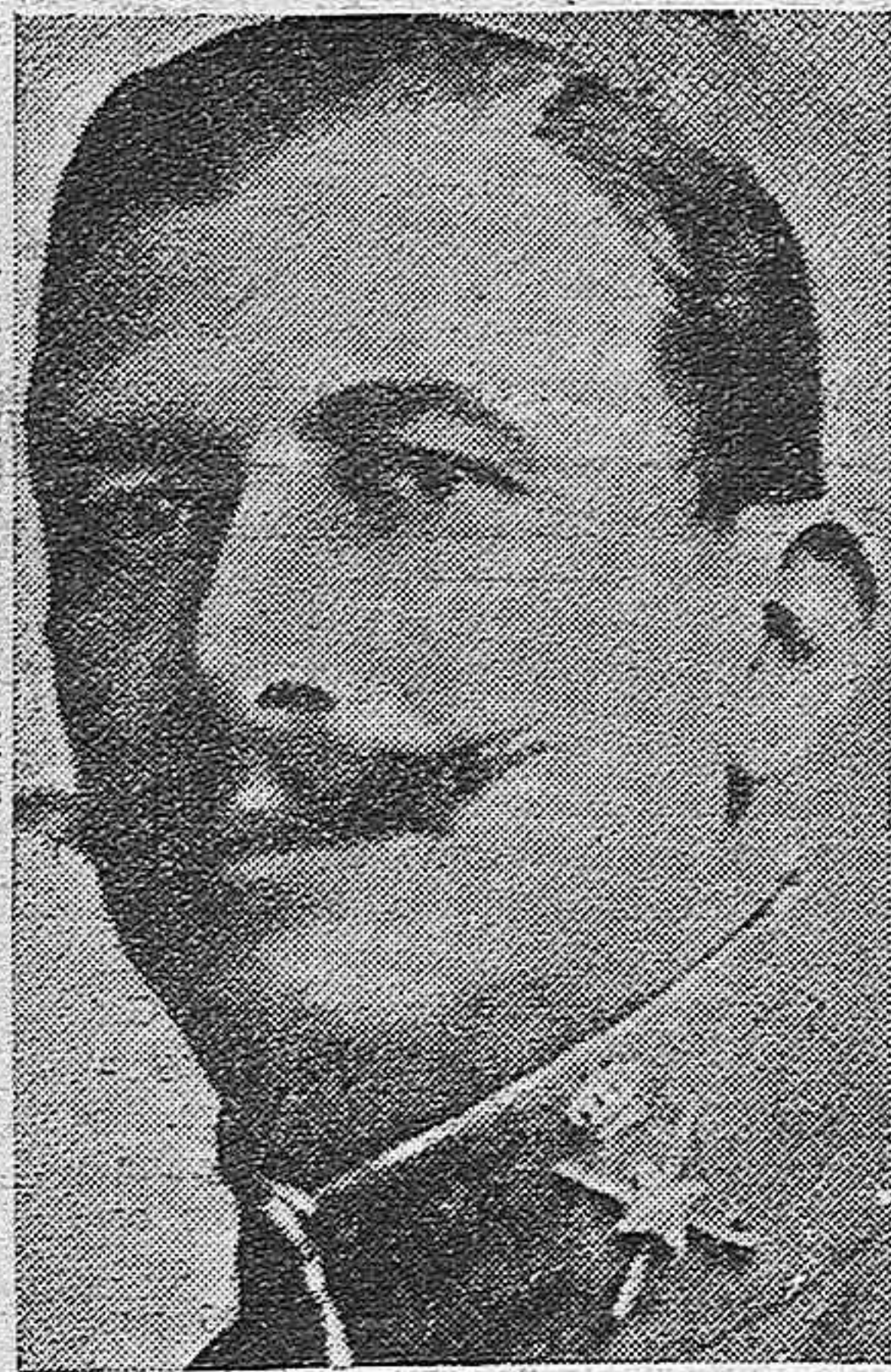
EL PRESIDENTE DEL CONSEJO, TENIENTE GENERAL DON DÁMASO BERENGUER.

El titular de la cartera de Trabajo es también título del Reino, puesto que ostenta el marquesado de Guad-el-Jelú.