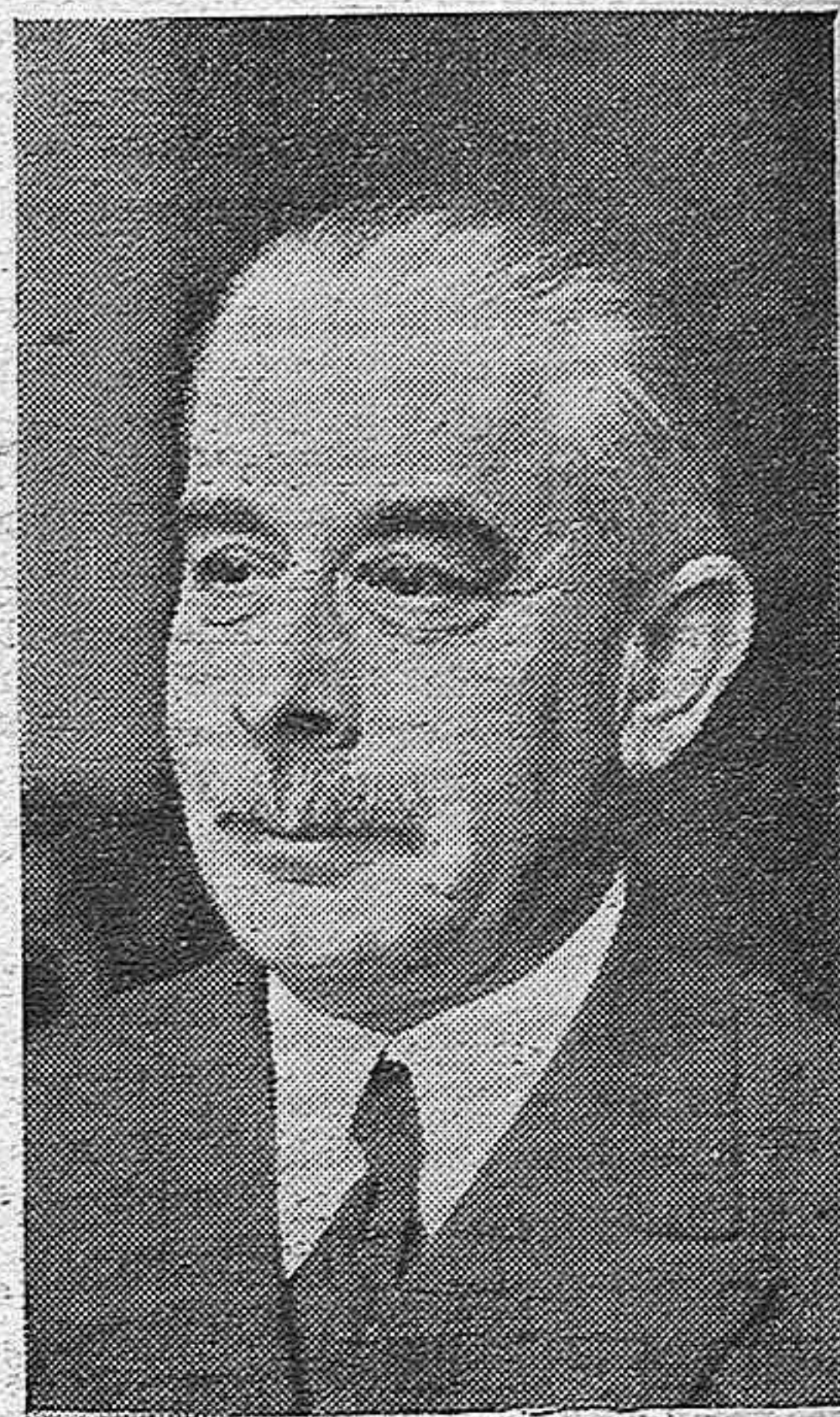
DON SALVADOR CARVIA Y CARAVACA, MINISTRO DE MARINA.