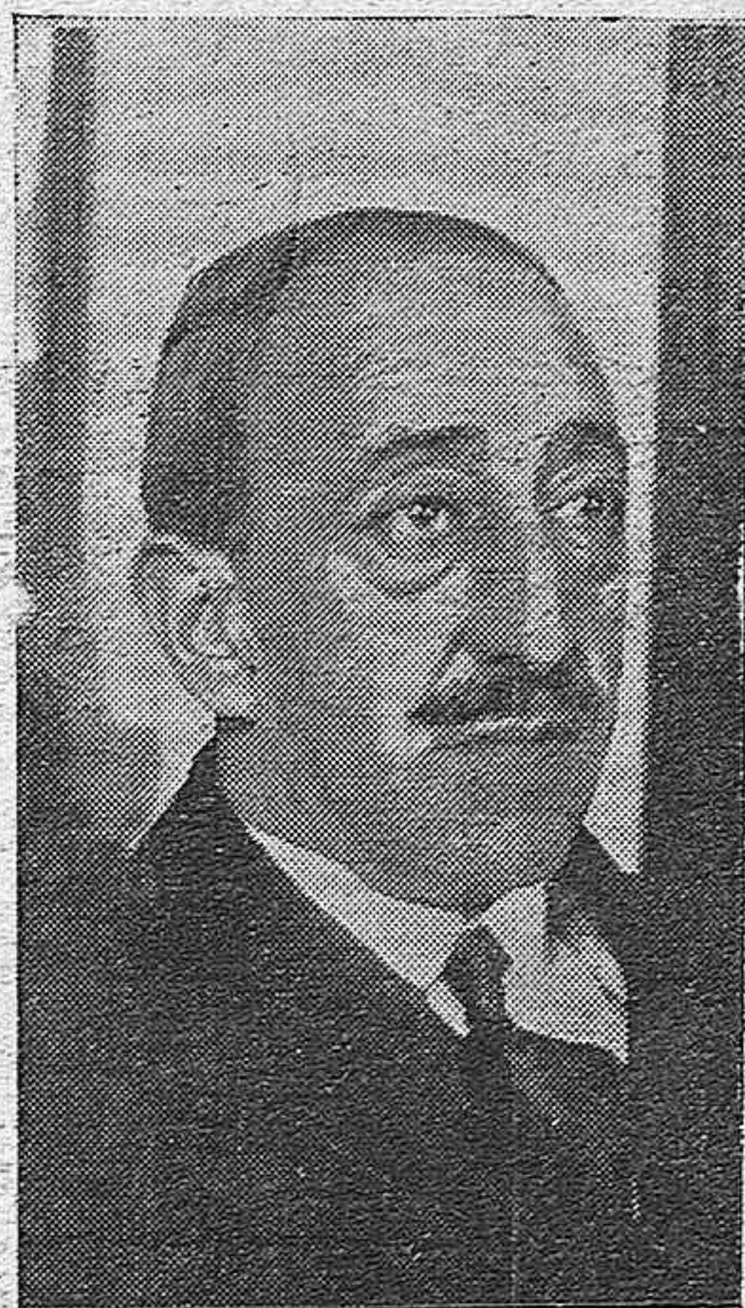
DON MANUEL ARGÜELLES, MINISTRO DE HACIENDA.

Desempeñó la vicepresidencia del Congreso y en Agosto de 1921, al formar Maura el Gobierno que siguió al derrumbamiento de la Comandancia de Melilla, fué nombrado ministro del Trabajo.