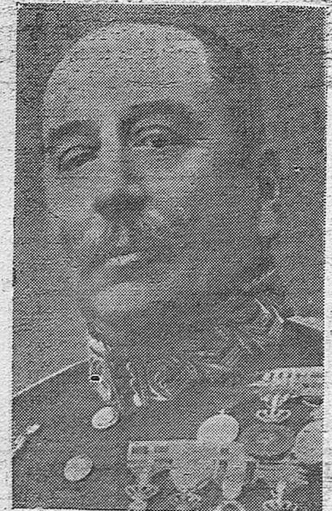
DON ENRIQUE MARZO, MINISTRO DE GOBERNACIÓN.