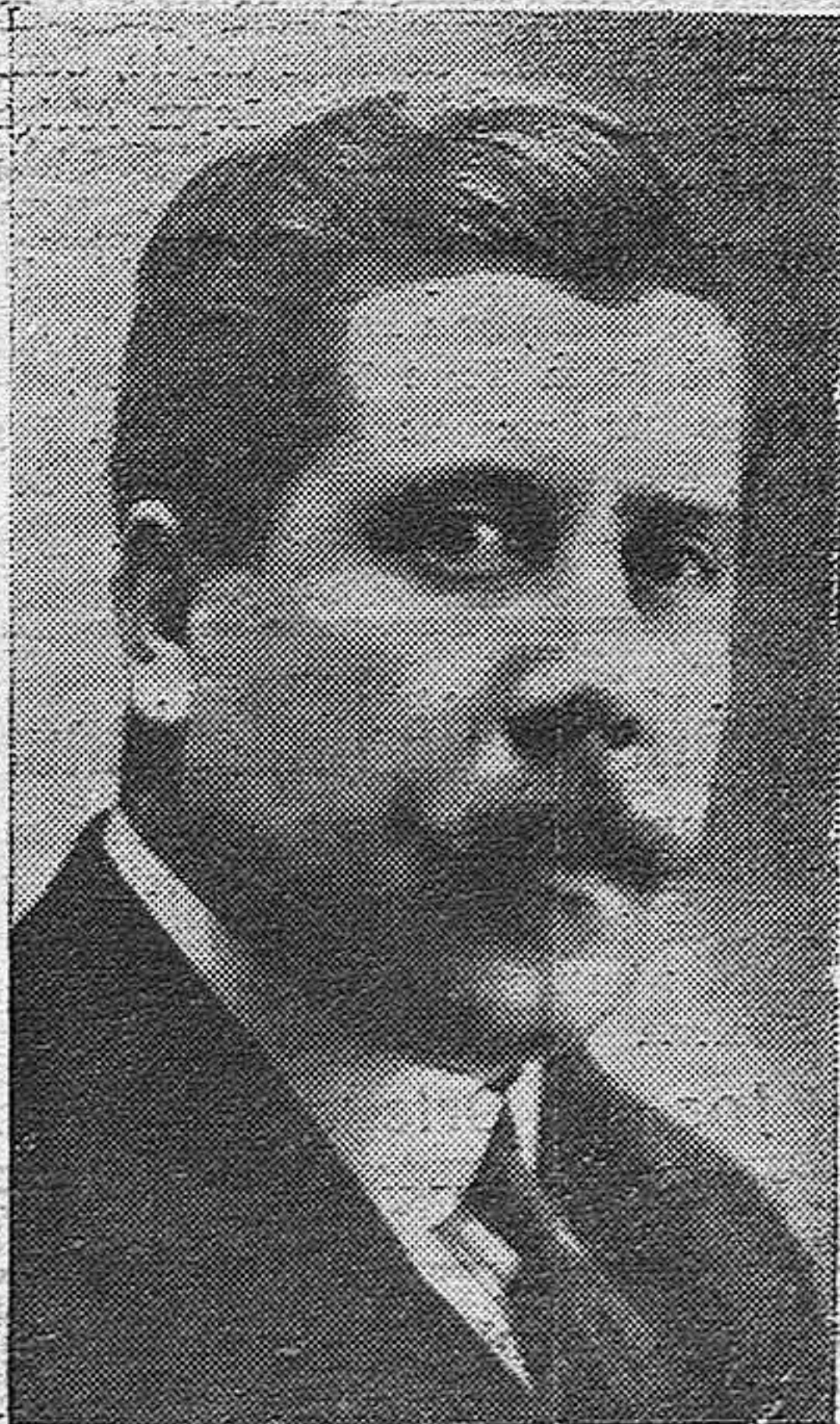
DON LEOPOLDO MATOS, NUEVO MINISTRO DE FOMENTO.