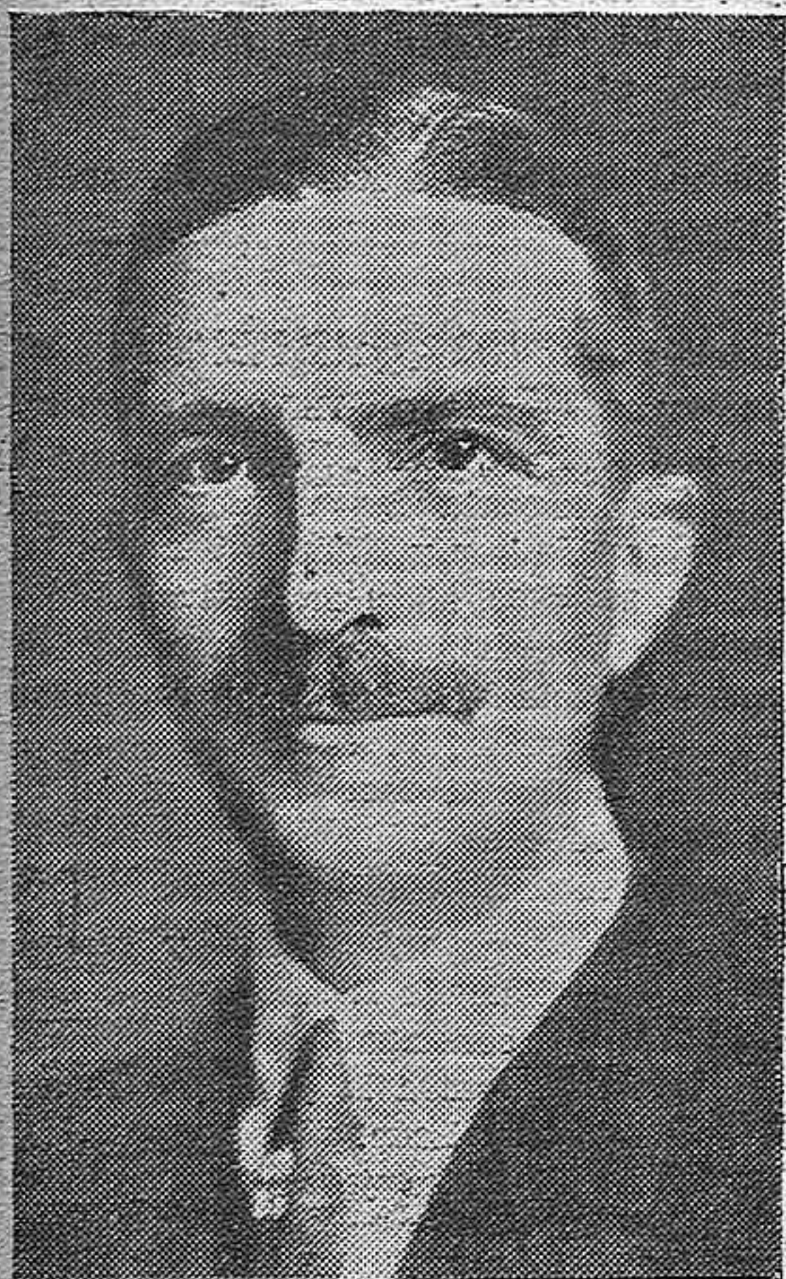
DON PEDRO SANGRO Y ROS DE OLANO, MI- NISTRO DE TRABAJO.

Y NO UN MINISTERIO DE REPRESENTANTES, COMO SE HA DICHO.