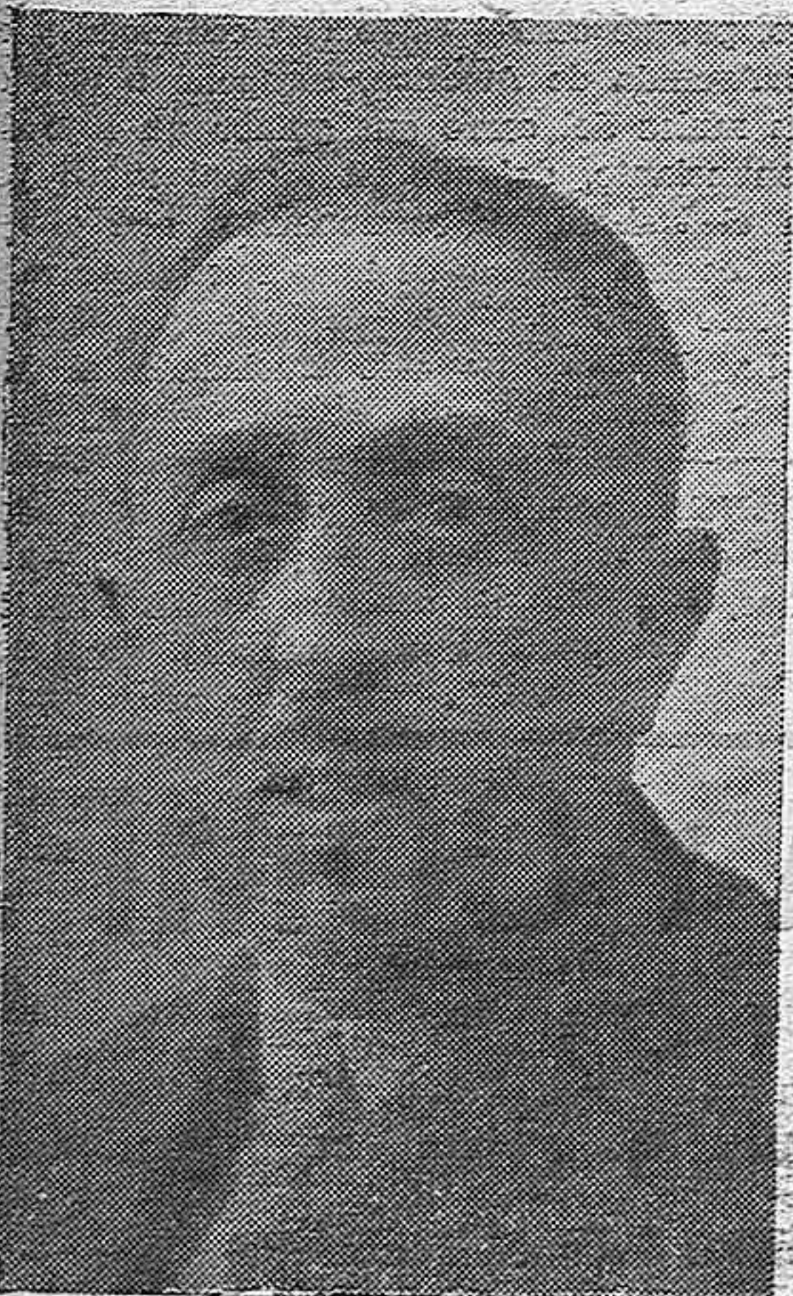
DON JOSÉ ESTRADA Y ESTRADA, MINISTRO DE JUSTICIA Y CULTO.