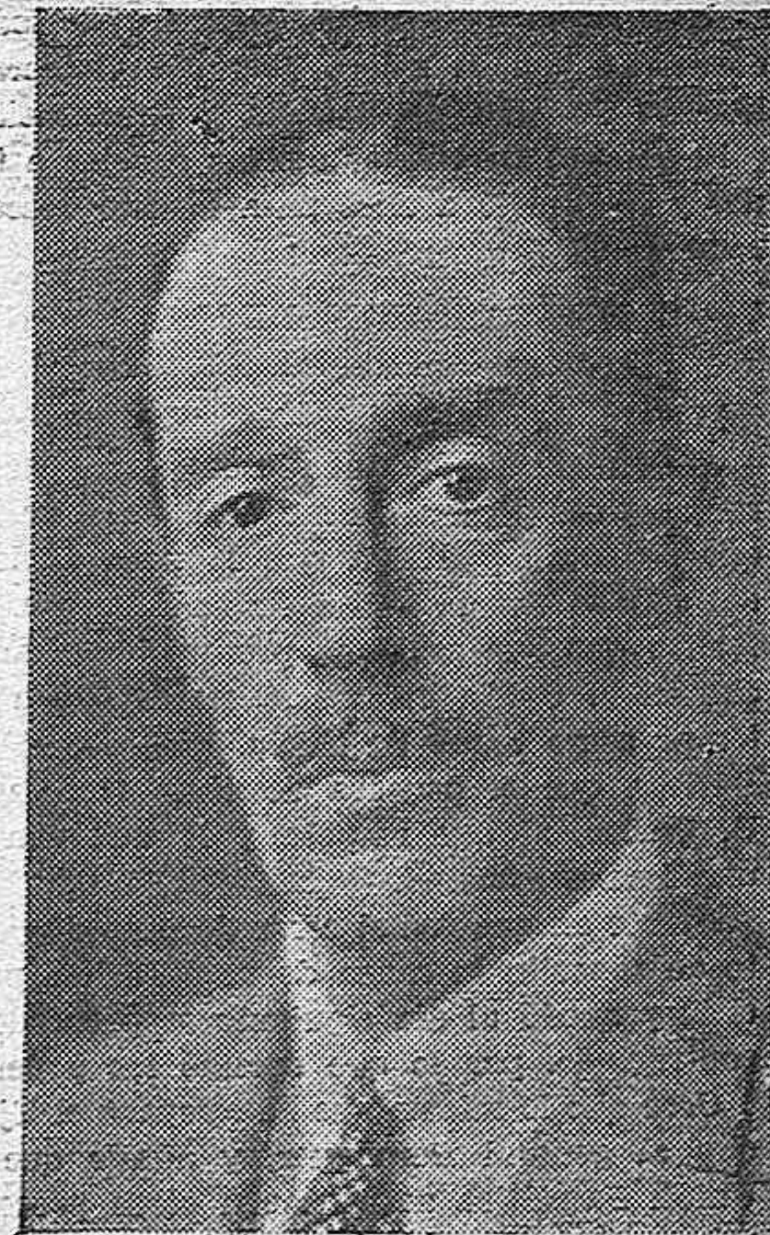
EL MINISTRO DE INSTRUCCIÓN PÚBLICA, DUQUE DE ALBA.