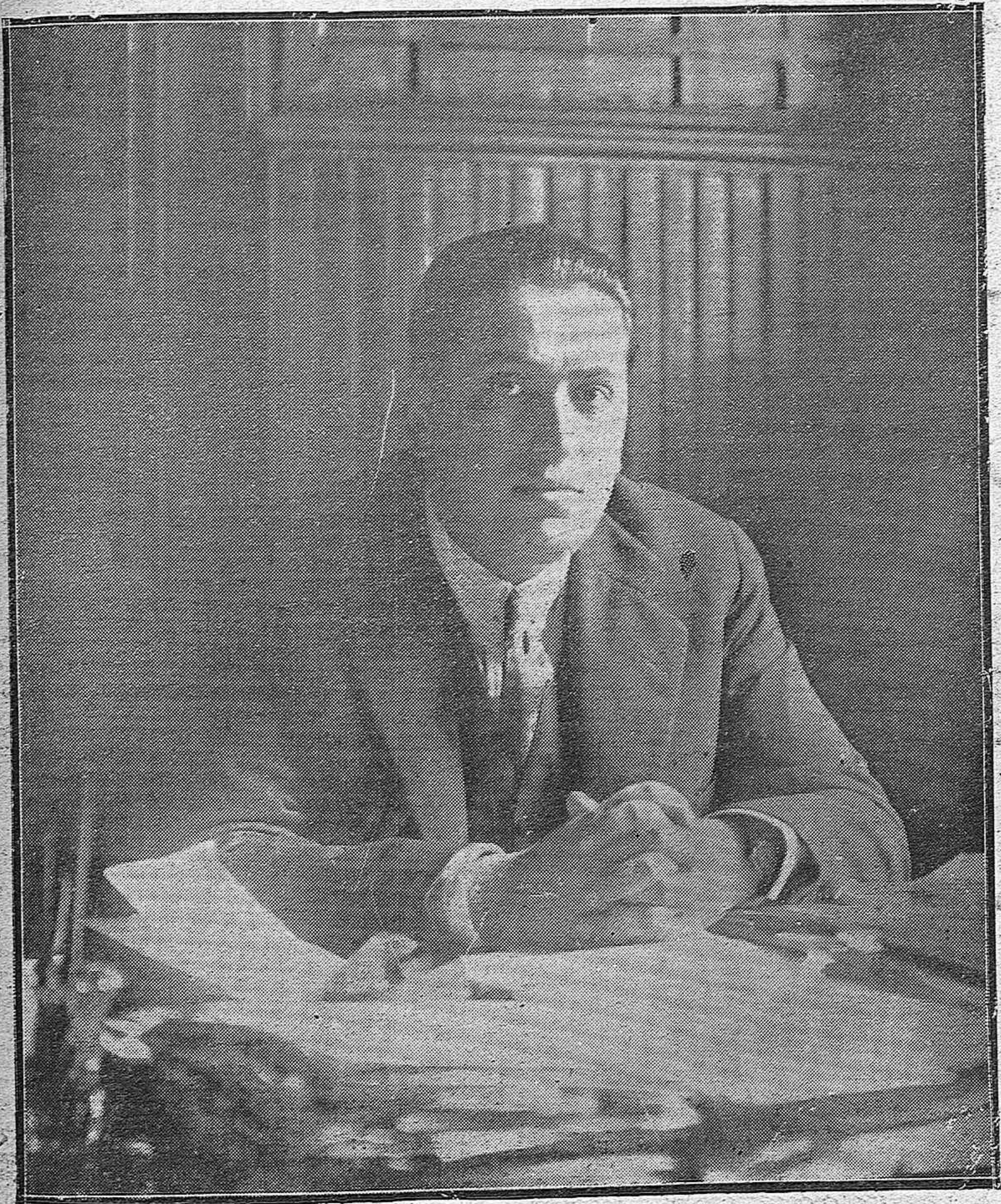
EL SEÑOR CALVO SOTELO, QUE HA DIMITIDO LA CARTERA DE HACIENDA.