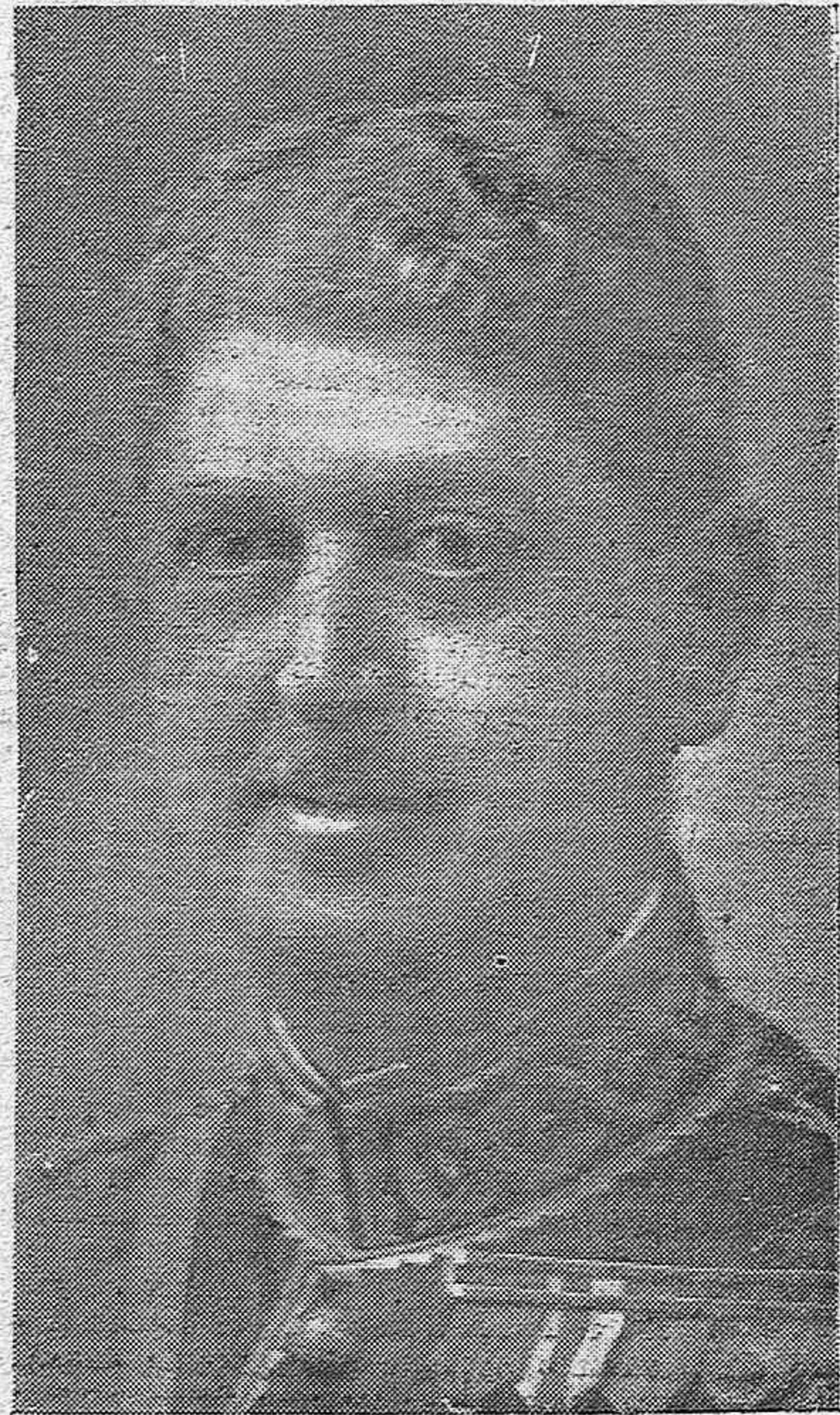
EL CONDE DE LOS ANDES, QUE HA SIDO NOMBRADO PARA LA CARTERA DE HACIENDA, QUE DIMITIÓ EL SEÑOR CALVO SOTELO.

LA VOZ admite mortuorias para su primera edición, hasta las 18'30 de la tarde. Para la edición de la mañana, hasta las 3'30 de la madrugada. Avisos y anuncios, hasta dichas horas. Teléfono 2436.