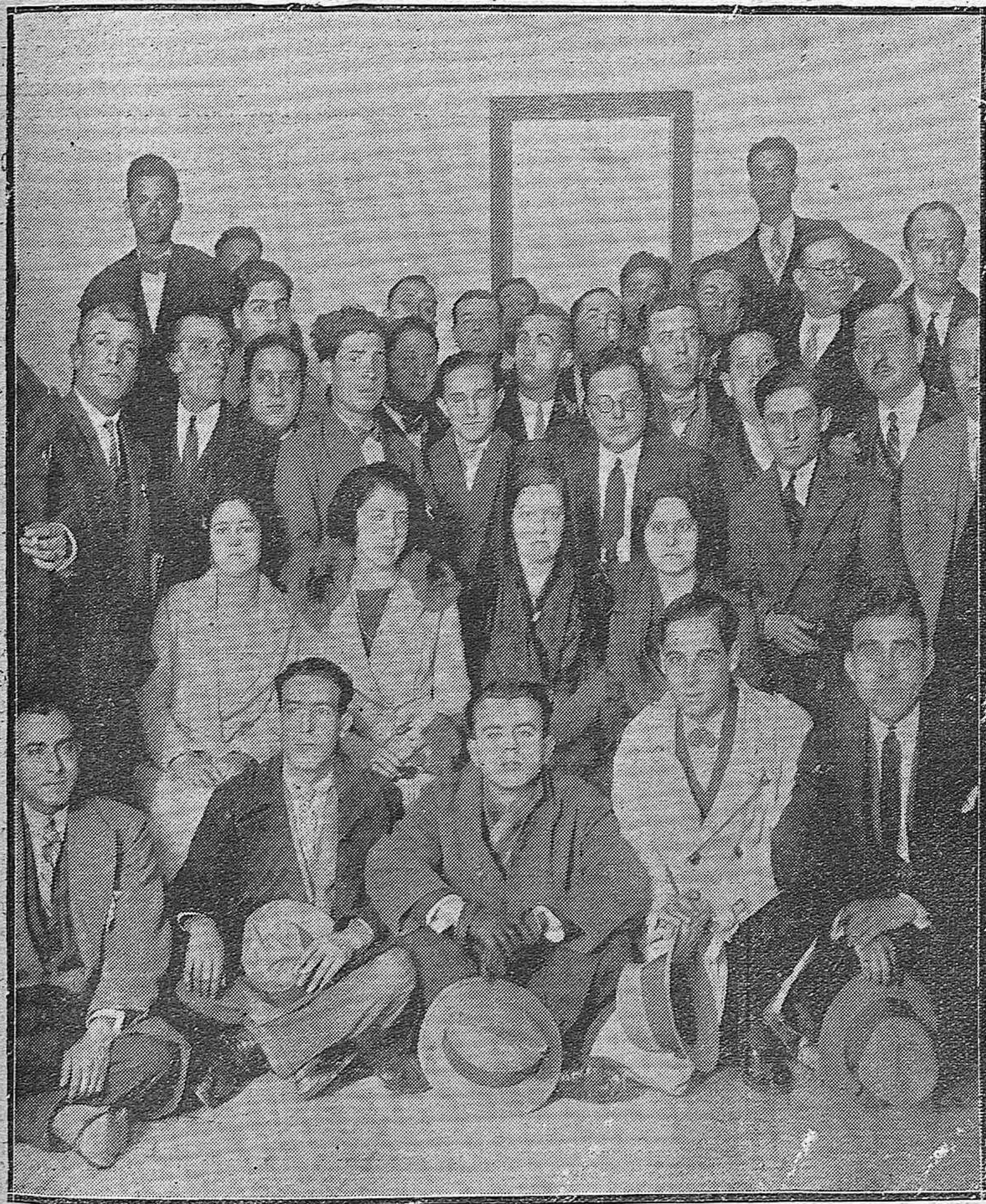
UNA ASAMBLEA.—LOS PRACTICANTES DE MEDICINA Y CIRUGIA DE CORDOBA Y SU PROVINCIA, QUE SE REUNIERON PARA ORGANIZAR EL COLEGIO OFICIAL DE LA CLASE.