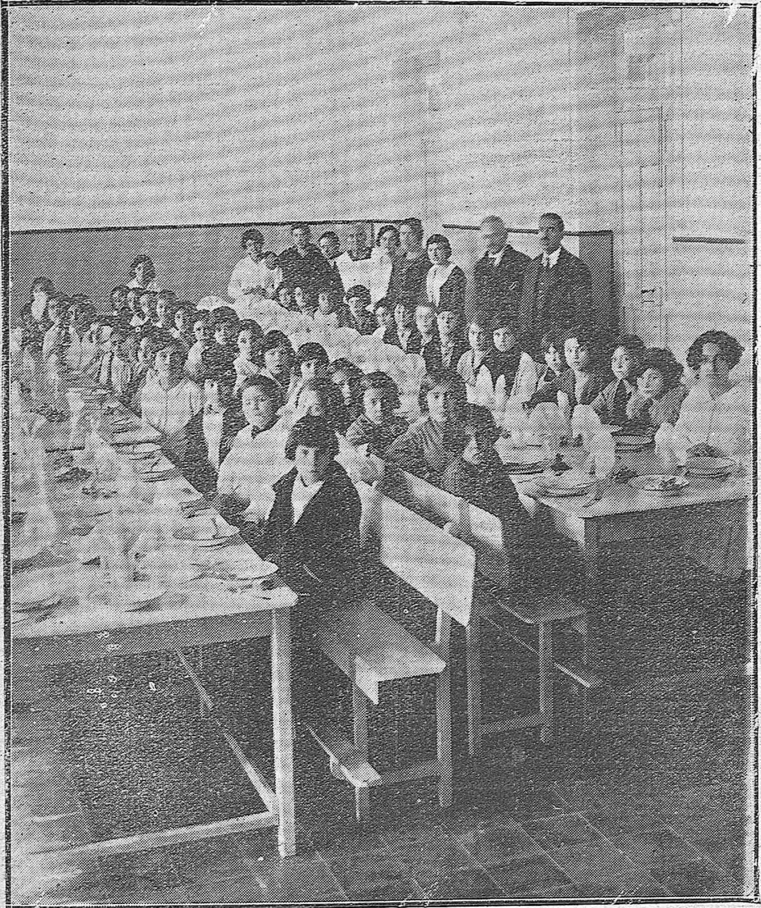
INAUGURACIÓN DE LA CANTINA ESCOLAR DE NIÑAS EN EL GRUPO ESCOLAR «MARQUÉS DE ESTELLA»