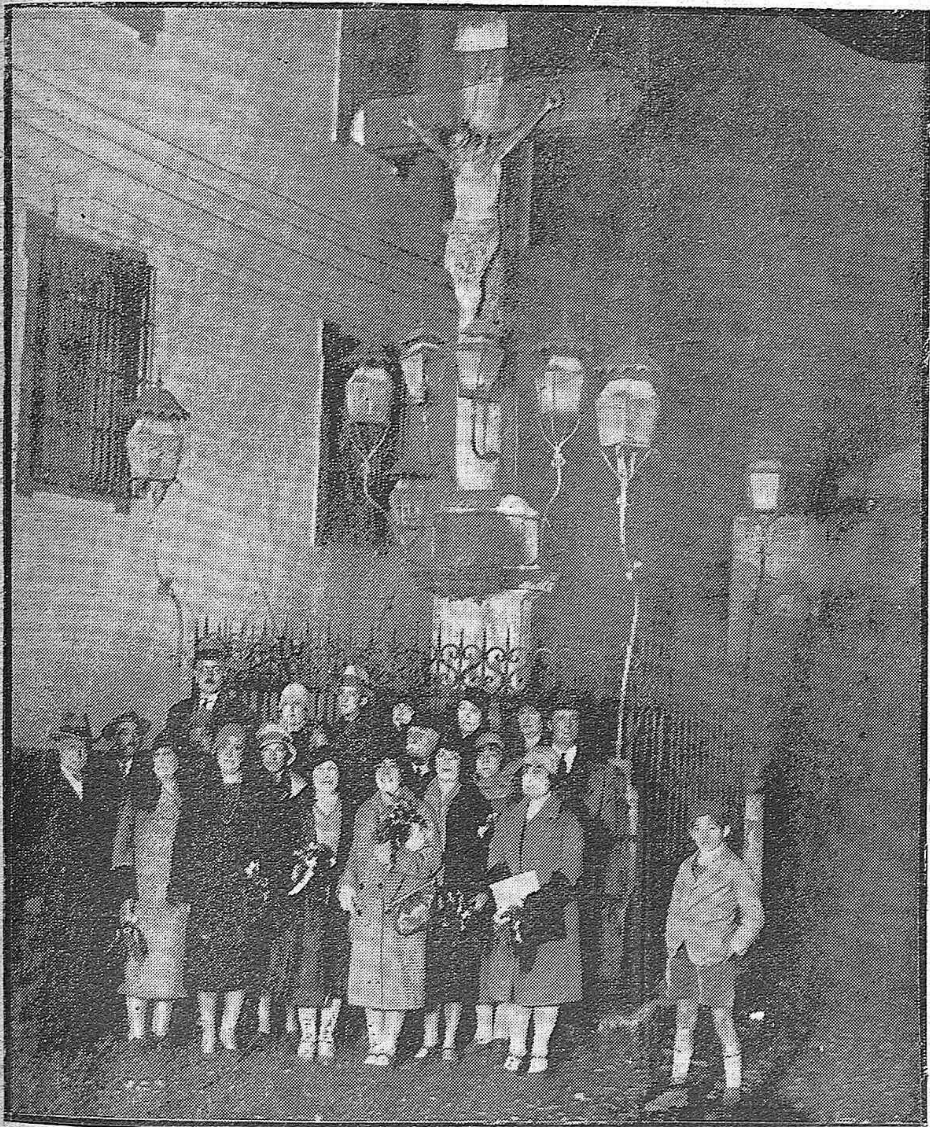
EN LA PLAZA DE LOS DOLORES.—LOS PROFESORES ARGENTINOS, QUE HOY SON NUESTROS HUÉSPEDES, EN LA VISITA QUE HICIERON AYER A LA TÍPICA PLAZA, DONDE SE ALZA EL CRISTO DE LOS FAROLES.