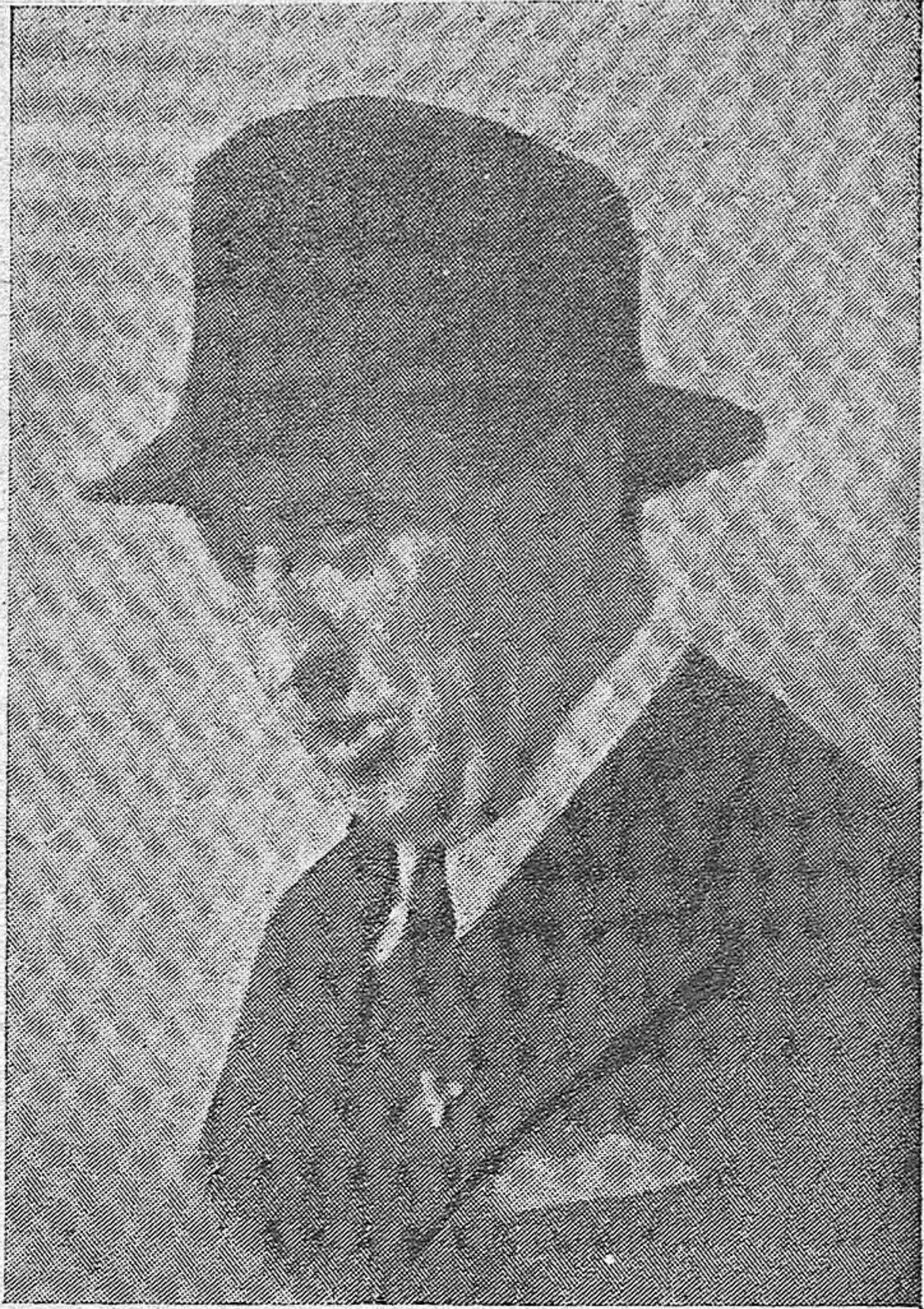
EL DOCTOR DON FERNANDO ASUERO, CUYAS SORPRENDENTES CURACIONES POR UN SENCILLO TRATAMIENTO DESCUBIERTO POR EL, CONSTITUYE LA NOTA SENSACIONAL DEL DIA

A mayores ventas — Mayores compras. A mayores compras — Mejores precios. A mejores precios — Más clientes. Y a más clientes — Mayores ventas.