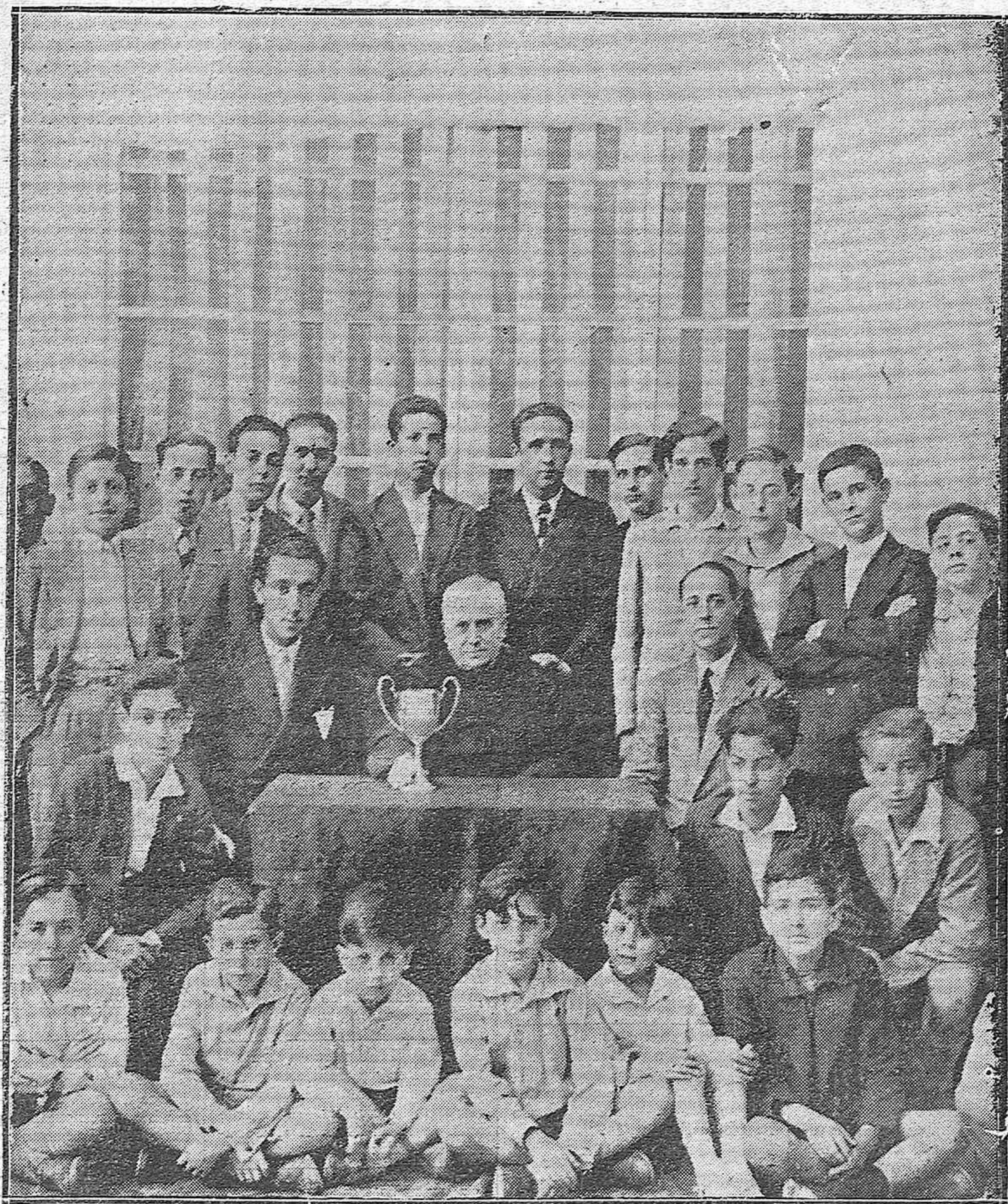
TERMINACION DEL CAMPEONATO ESCOLAR DE 1930.—ENTREGA DE LA COPA POR EL PRESIDENTE DEL RACING CLUB DE CÓRDOBA AL EQUIPO VENCEDOR C. M. SAN HIPÓLITO, ASISTIENDO AL ACTO EL EQUIPO INFANTIL DEL SAN HIPÓLITO.