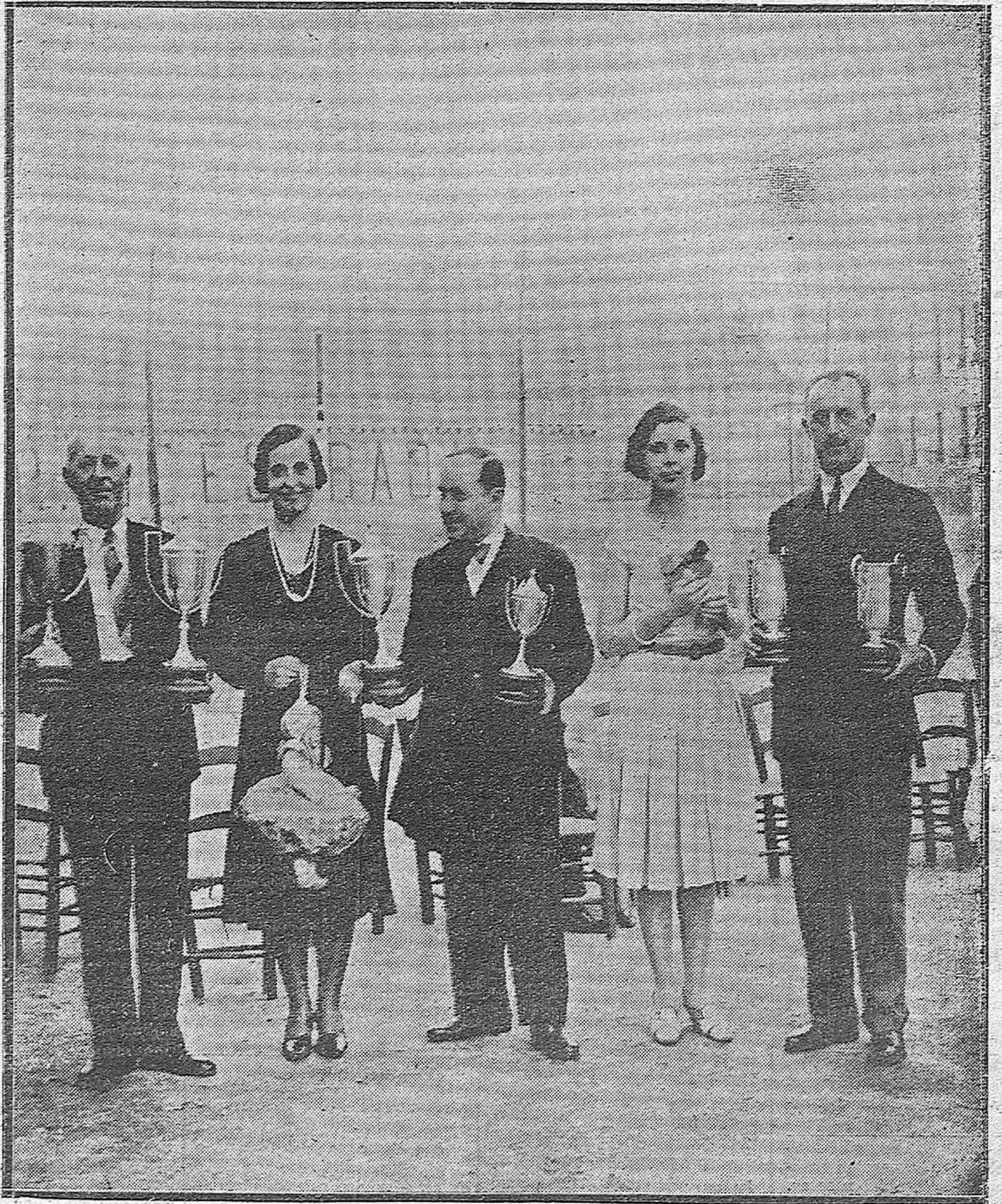
EN EL CAMPO DE TENNIS. — LAS AUTORIDADES Y EL PRESIDENTE DE LA SOCIEDAD ENTREGANDO LAS COPAS A LAS SEÑORITAS Y CABALLEROS QUE GANARON EL CAMPEONATO 1930.