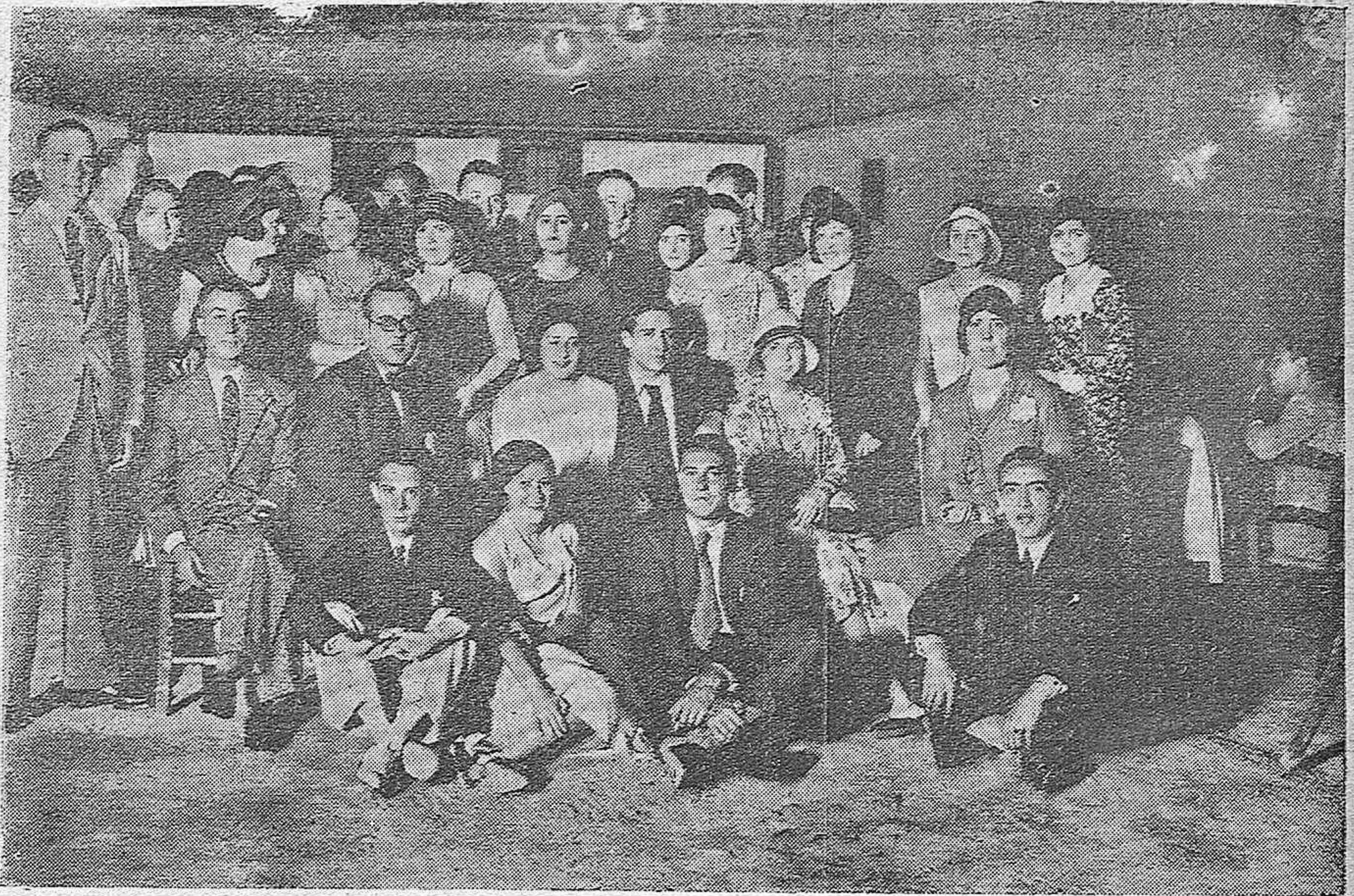
EN EL CAMPO DE TENNIS.—GRUPO DE ASISTENTES A LA VERBENA CELEBRADA CON MOTIVO DE LA ENTREGA DE COPAS.