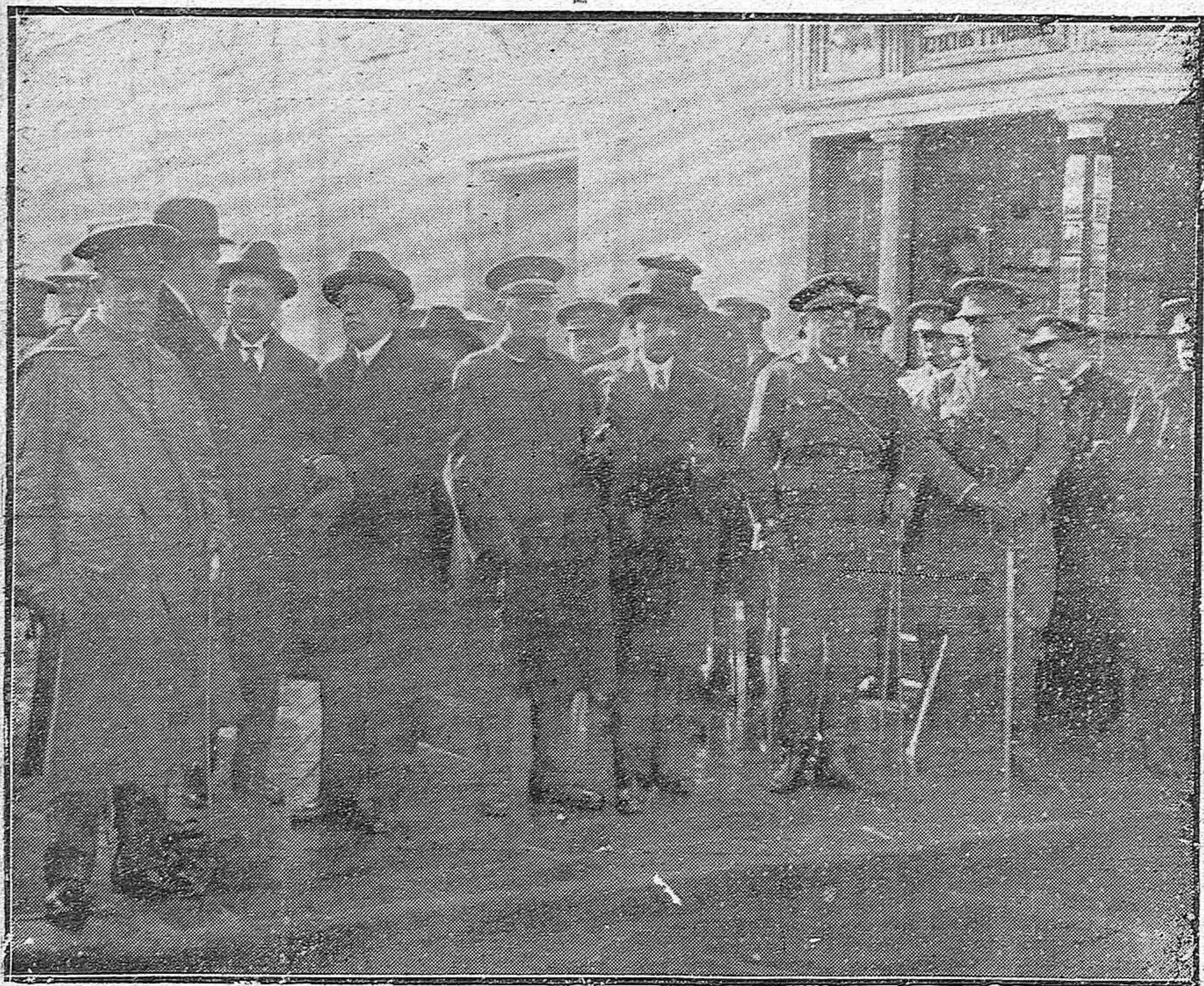
LA FIESTA DE LA PATRONA DE LA ARTILLERÍA.—Las autoridades presencian en el Gran Capitán, el desfile del Regimiento de Artillería.